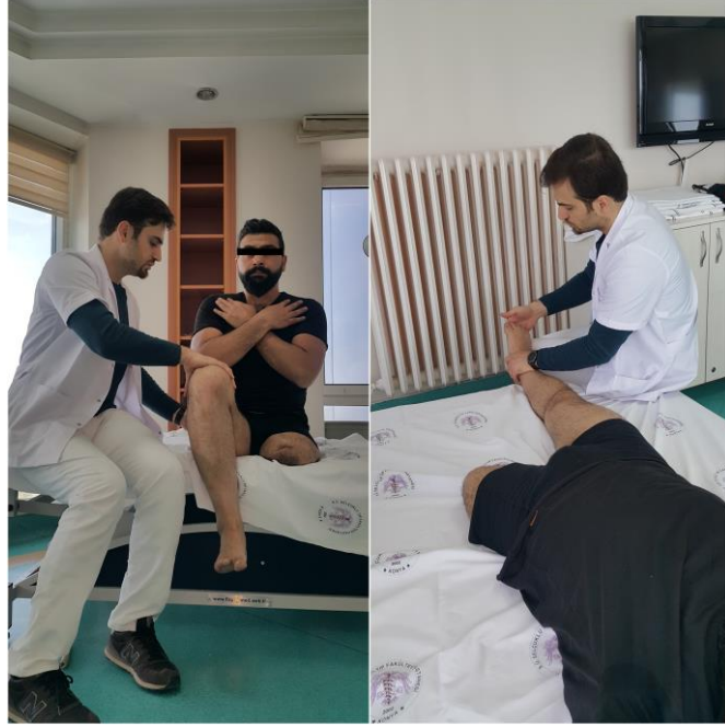
Şekil 3.4. Kas kuvvet değerlendirmeleri