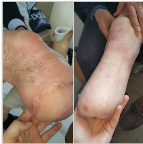
Şekil 3.7. Güdük cildi değerlendirilmesi