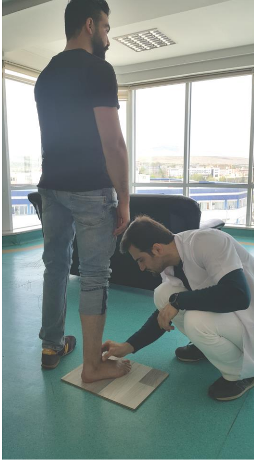
Şekil 3.8. Ayak postür indeksi