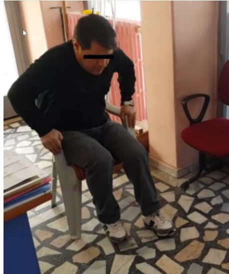
Şekil 3.11. Süreli kalk ve yürü testi

Çalışma grubundaki olgunun bir sandalyenin kollarına tutunmadan oturduğu yerden kalkıp bir yere dokunmadan 3m yürüdüktan sonra geri dönmesi ve sandalyeye doğru yürüyerek tekrar oturması esnasında gözlemsel olarak değerlendirilerek skorlanmasını içeren Timed Up and Go testi kullanıldı (133).