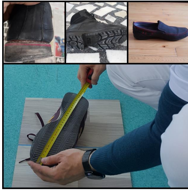
Şekil 3.12. Ayakkabı değerlendirme

Çalışma grubundaki bireylerin ayakkabıları; ayakkabının saya ve taban malzemesi, bükülme noktası, genişliği, parmak kutusu yüksekliği, yürürken ayaktan çıkma, topuk yüksekliği, ayakkabı stili, topukta aşınma ve en uzun parmak ile ayakkabı ucu arasındaki mesafe parametrelerini içeren Ayakkabı Değerlendirme Ölçeği (Footwear Assessment Score) kullanılarak değerlendirildi (134,135).