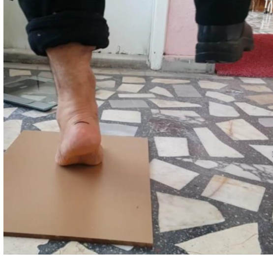
Şekil 3.10. Topuk yükseltme testi