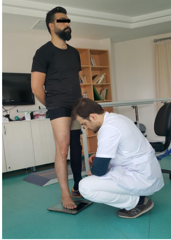
Şekil 3.2. Vücut ağırlığı ölçümü