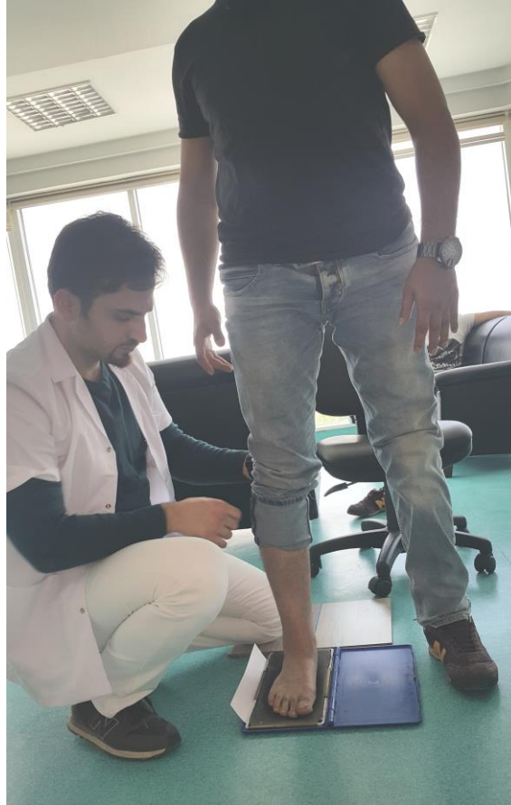
Şekil 3.13. Footprint ölçümü

Chippaux-Smirak İndeksi (CSİ), orta ayağın en dar ve metatarsal alanın en geniş bölgesi arasındaki orandır. Orta ayağın en dar yerinin, metatars bölgesinin en geniş bölümüne bölünmesiyle elde edilir. 0,6-0,7 arası değerler normal değerlerdir. 0,6'nın altındaki değerler yüksek arka eğilimi ifade ederken, 0,7'nin üzerindeki değerler de düşük arka eğilimi gösterir (146,145).