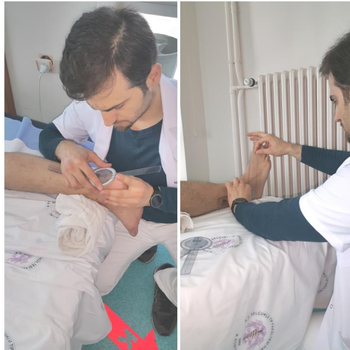
Şekil 3.3. Eklem hareket açıklığı değerlendirmeleri

Çalışma grubunda eklem hareket açıklıkları; kalça, diz, ayak bileği eklemi, subtalar eklem ve 1. MTF(metatarsofalangeal) eklemlerden universal gonyometre ile değerlendirildi (116-118). Ayak eklemleri dışındaki eklemler, öncelikle pasif olarak değerlendirildi, limitasyon tespit edilmesi durumunda universal gonyometre ile ölçüm yapıldı.