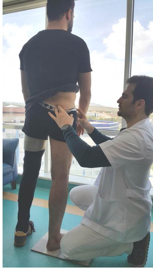
Şekil 3.9. Postür analizi