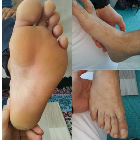
Şekil 3.6. Ayak cildi değerlendirilmesi

Çalışma grubu bireylerinde cildin görünümü, ısısı, rengi, nasır oluşumu, kızarıklık, nem, bül ve blisterler inspeksiyon ve palpasyonla değerlendirilerek sonuçlar kaydedildi.