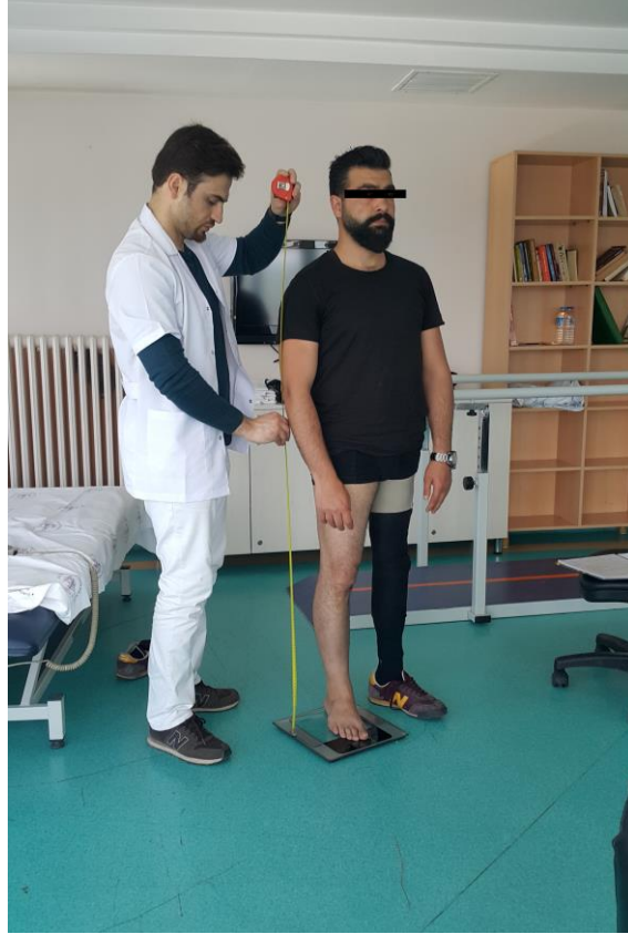
Şekil 3.1. Boy uzunluğu ölçümü

Uzunluk ölçümlerinde şerit formunda çift yönlü bir tarafı punt, bir tarafı cm göstergeli, cm gösteren taraf milimetre (mm) bölüntülü ve 300 cm uzunluğunda bir mezura kullanıldı. Katılımcıların boy uzunlukları başın en tepe noktasının yere dik olan uzaklık mezura ile ölçülerek cm cinsinden kaydedildi.