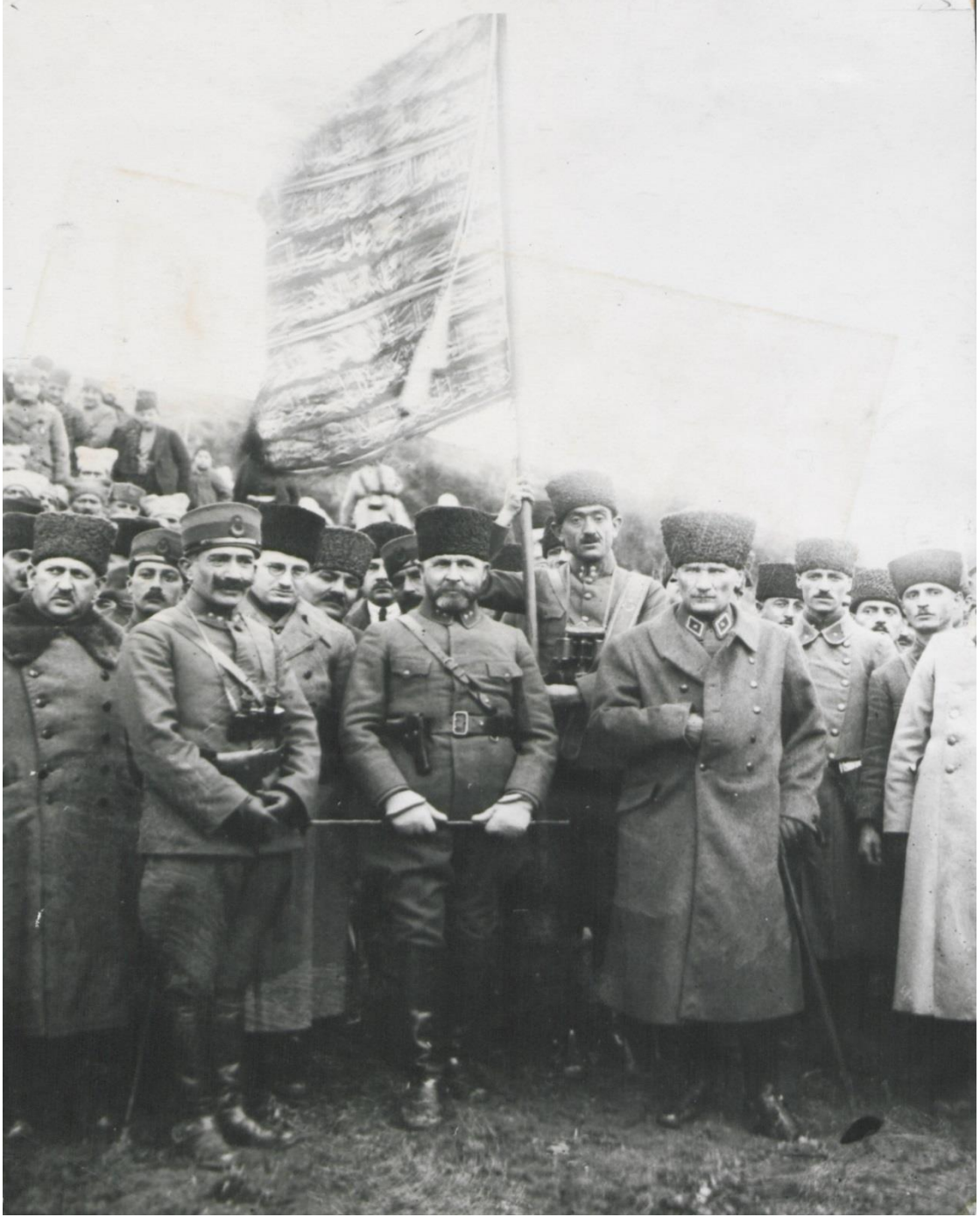
Başkumandan Mustafa Kemal Paşa'nın 1. Ordu Kumandanı Nurettin Paşa ve diğer komutanlarla İzmit'te 18 Ocak 1923 günü ordu denetlemesi.