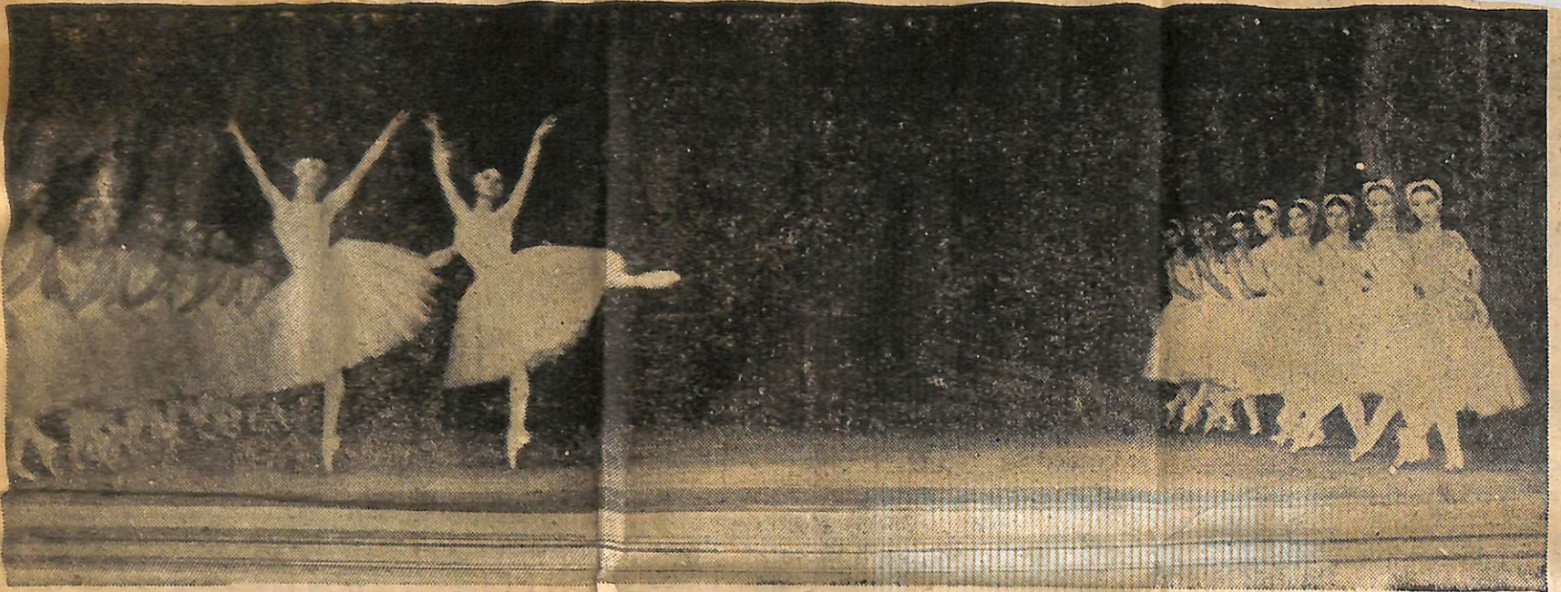
Şehrimizde 6 ile 9 Eylül tarihleri arasında şehrimizde oynanacak olan Kuğu Gölü'nün ikinci perdesinden bir sahne.