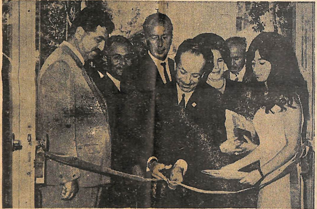
Uluslararası İstanbul 5. Çağdaş Seramik Sergisinin kurdelaşı, Milli Eğitim Bakanı tarafından kesilirken.

Şehrimizde muhtelif temsiller verecek olan Ankara Sanat Tiyatrosunun seyredeceğimiz üç oyunundan biri: Durdurun Dünyayı İnecek var. Genco Erkal bu oyunda bilhassa dikkati çekiyor.