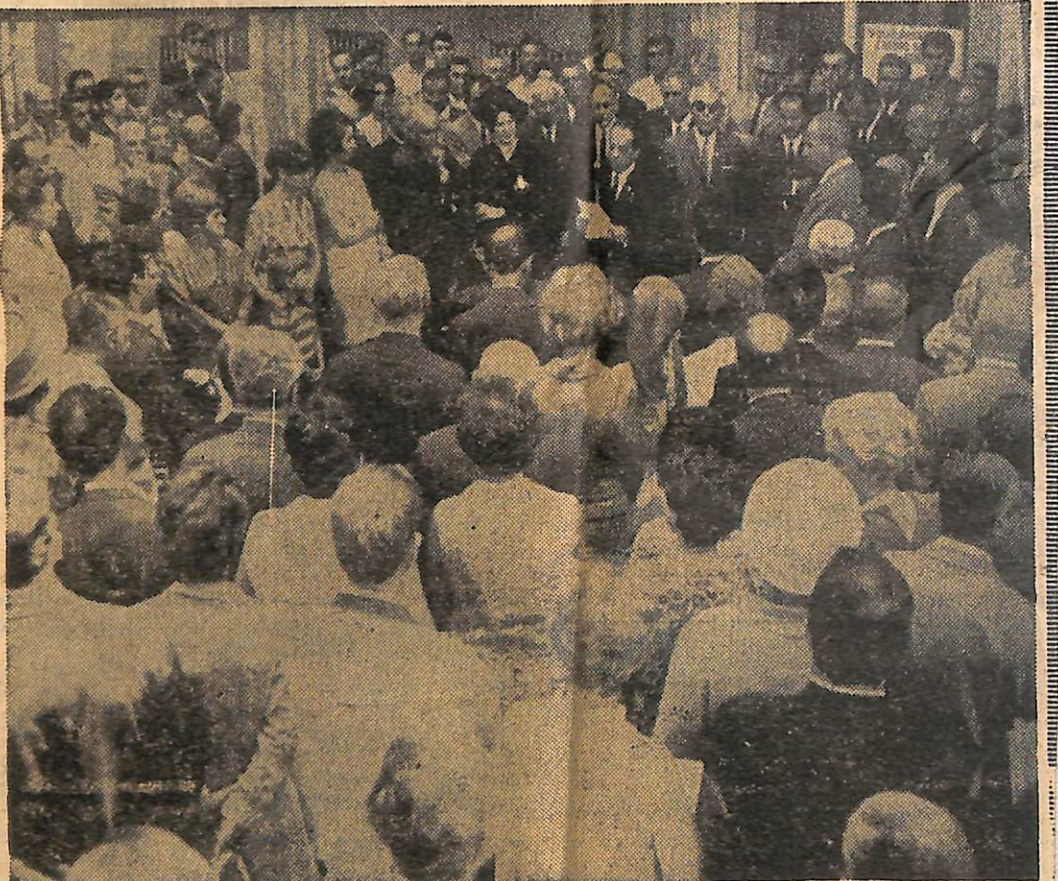
Millî Eğitim Bakanı İlhami Ertem Seramik Sergisinin açılışında konuşurken.

4) Çeşme Başı — Bale 1. perde (Müzik: Ferit Tüzün, Koreografi ve sahneye koyan: Ninette de Valois, Orkestra şefi: Ferit Tüzün, Dekor: Hüseyin Mumcu/Refik Eren, kostüm: Hal Eren)