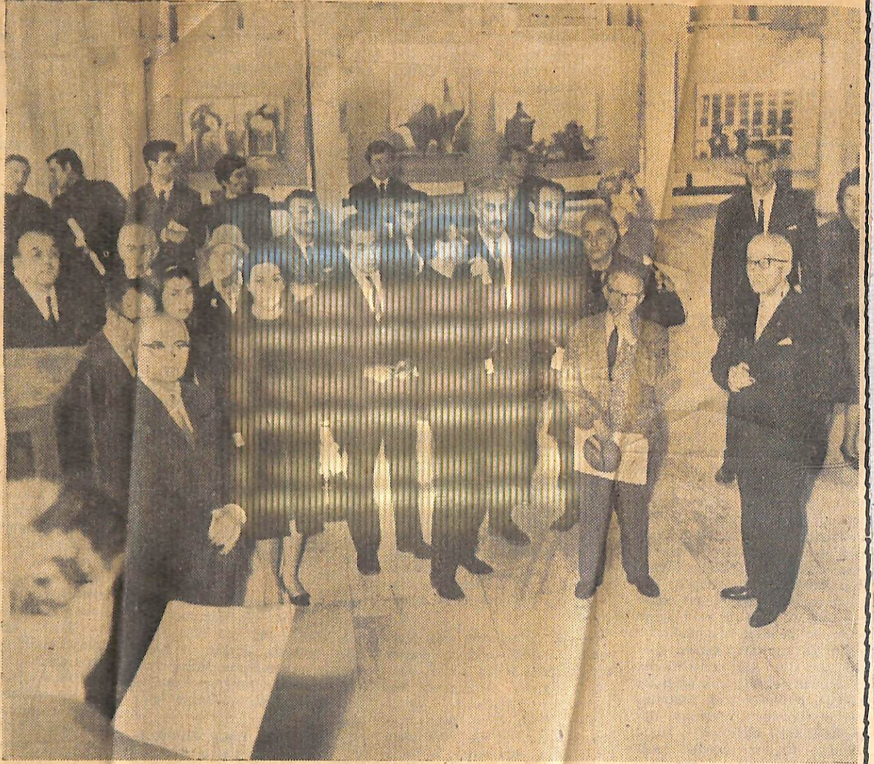
Güzel Sanatlar Akademisinde İngiliz Kültür Heyeti tarafından tertiplenen, büyük heykeltıraş Henry Moore'a ait sergide bulunan davetliler. Sergide Moore'un yüze yakın eserinin fotoğrafı ve orijinal olarak birkaç heykeli.

Henry Moore çağdaş İngiliz ve dünya heykel sanatının en güçlü kişilerinden biridir. Bugün 69 yaşında olan sanatçı, aynı zamanda ressamdır. 1940 da Londra'nın bombardıman edilmesi sırasında kuvvetle etkilendiği sığınak yaşantılarını "SİĞINAK DESENLERİ" ismi altında dizi halinde resmetmiştir. Çin mürekkebi, kurşun kalem, pastel, sulu boya olarak yapılmış olan bu resimlerde yer altındaki insan kitlelerinin sıkıntı, korku ve ıstırap içindeki bekleşimleri tüm ekspresif bir anlatım içinde gösterilmektedir. Sığınak re-