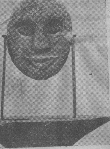
Louvre Müzesinde açılan sergide akıl hastalarının yaptıkları heykellerden bir görüldüğü.