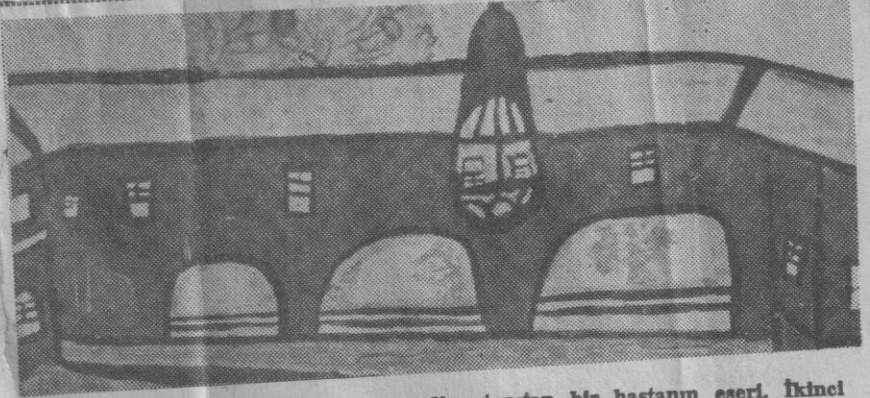
Kendisini «Amerikalı bir Asker» diye tanıtan bir hastanın eseri. İkinci Dünya Savaşında yaralandıktan sonra hastalanan gencin defalarca intihara teşebbüs ettiği açıklanmıştır. Rakat resim yapmak onu kurtarmıştır.