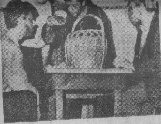
● İstanbul Erkek Lisesi «Duvarların Ötesi Piyesi ile yarışmaya katıldı.