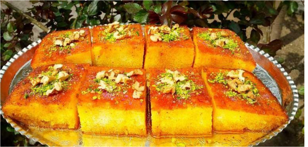
Foto (5). Kaykanak : Yeni çocuđu olan kadına (Zahı) pişirilir, özellikle çocuk erkek olursa.