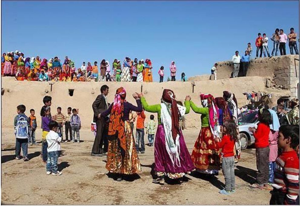
Foto (17). Gelini getiren gün. Oğlan evinin kadınları oynuyorlar. Aslında köyde kadınlar kentlerden daha rahat kamusal alanına çıkıyorlar.