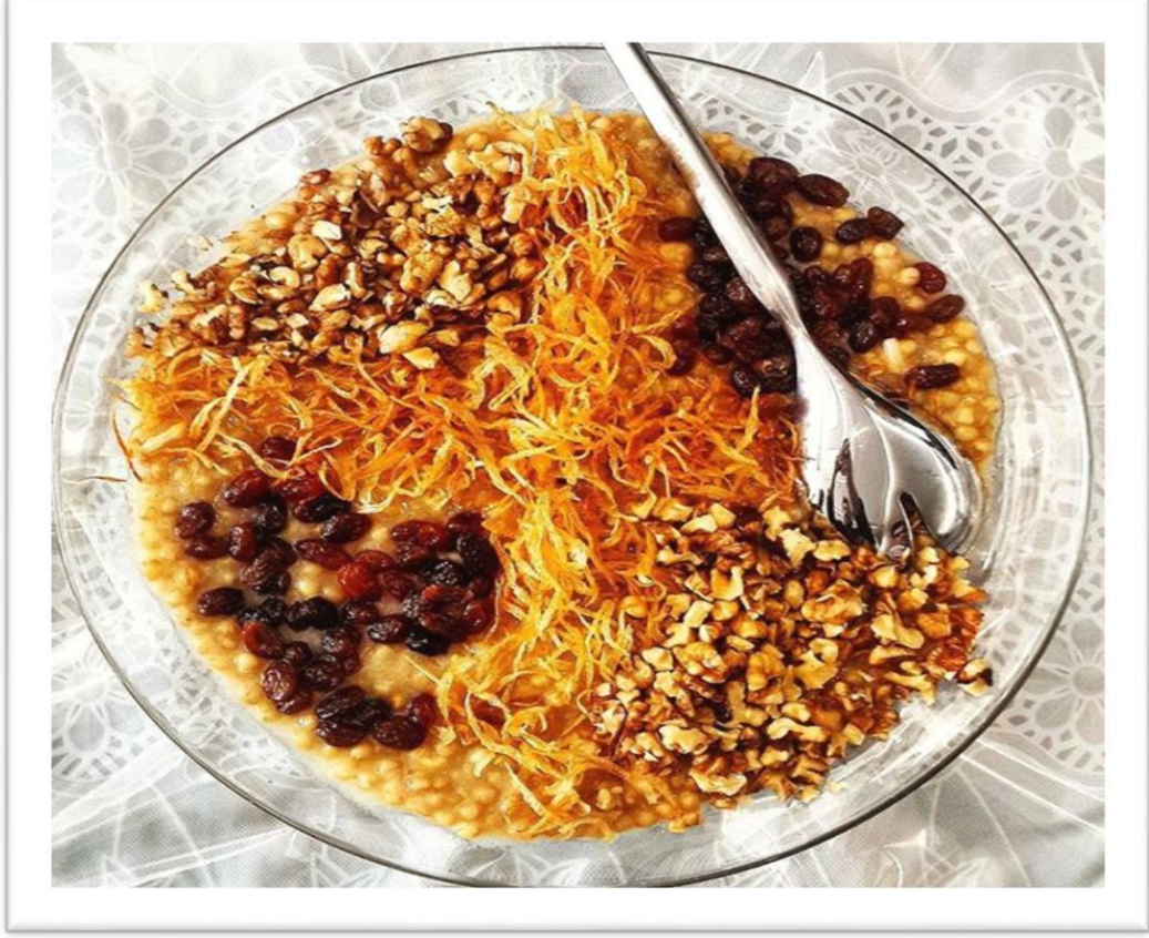
Foto (4). Dişlik /Hedik : Doğum geçiş Dönemin Törensel Yemeği. Çocuk diş çıkarttığı zaman pişirilir ve akraba ve komşulara paylanır.