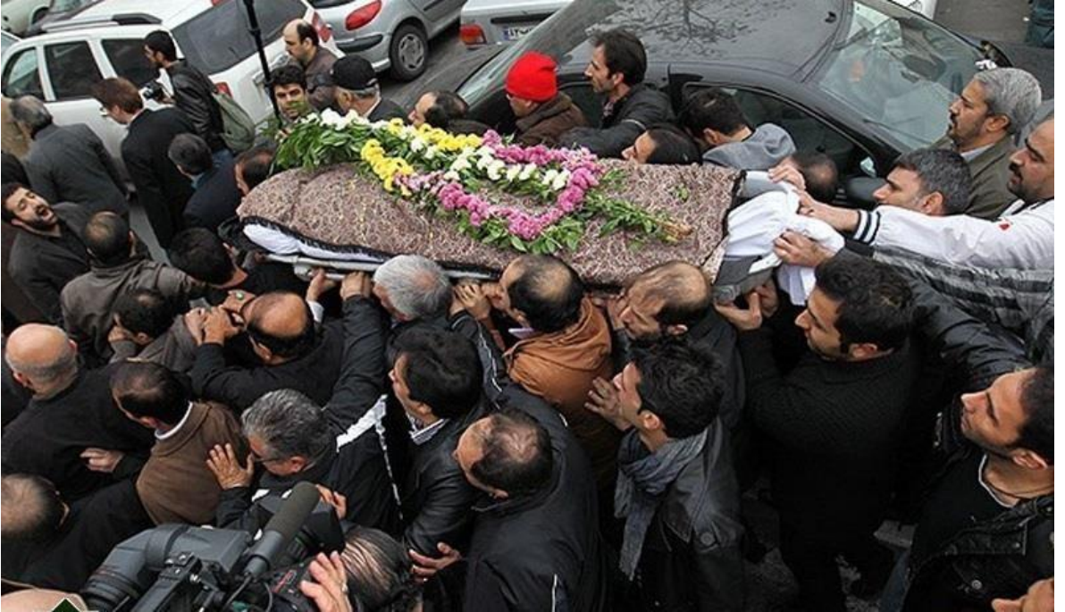
Foto (26). Ölüyü tabutla mezara götürüyorlar. Ölünün üzerine Tirme çekilmiş.