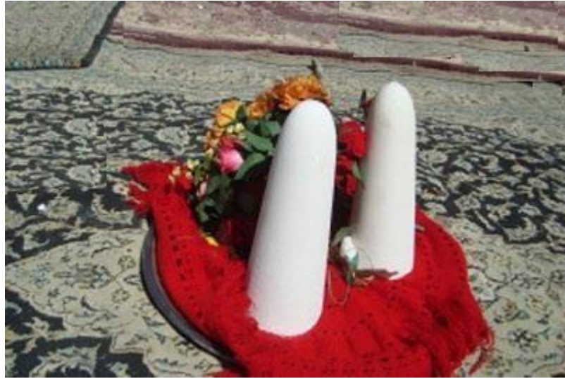
Foto (10). Ođlan evinden kız evine götürölen küpe řeker. Ođlan evi “Söz Danıřma” veya kızın “Tatlı Yemesin”de kız evine götürörlörlö. Bu küpe řekers kırılır, ondan tatlı çay hazırlanır ve “Gelin Getirme” günü kız evinde misafirlere dađıtılır.