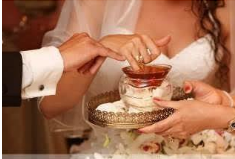
Foto (23). Akit sofrasında hazırlanan balda gelin ve damat parmakların basıp ve bir birlerinin ağzına bal konurlar.