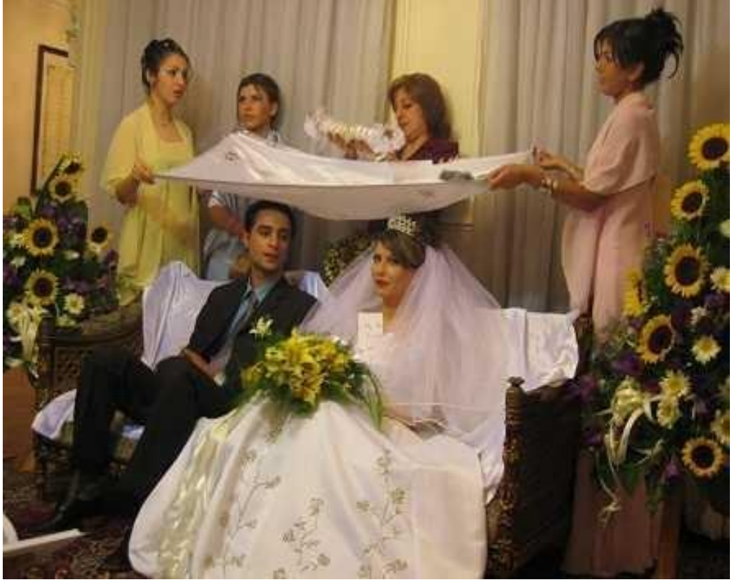
Foto (22). Nikah okunurken: gelin ve damat Akit sofrasının baş köşesinde otururken başlarının üzerine beyaz ve dikişsiz bir kumaş açılır ve iki küpe şeker ovunur.