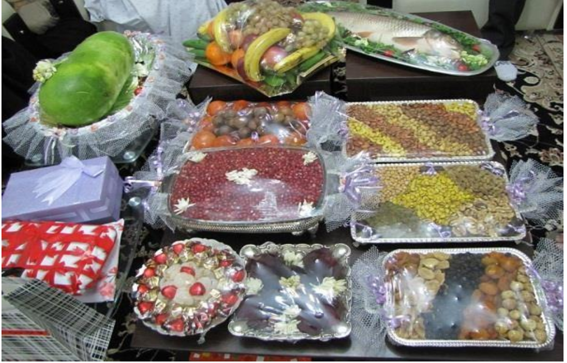
Foto (11). Çillelik: Son baharın son gecesinde oğlan evi verinden kız evine gönderilen Honça. Kuru yemiş, Nar, Karpuz, tatlı, alınan hediyelerden oluşur.