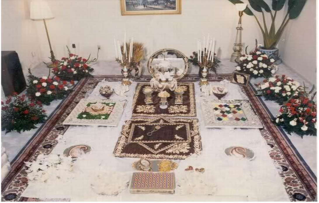
Foto (20). Azerbaycan'da son 40 yılda akıt sofrası yaygınlaşmış. Bu sofrta geçmişte kızın baba evinde olan ocağın simgesel işlevin yapır ve kız baba evinden koca evine kendisiyle bereket ve mutluluk götürüyor.