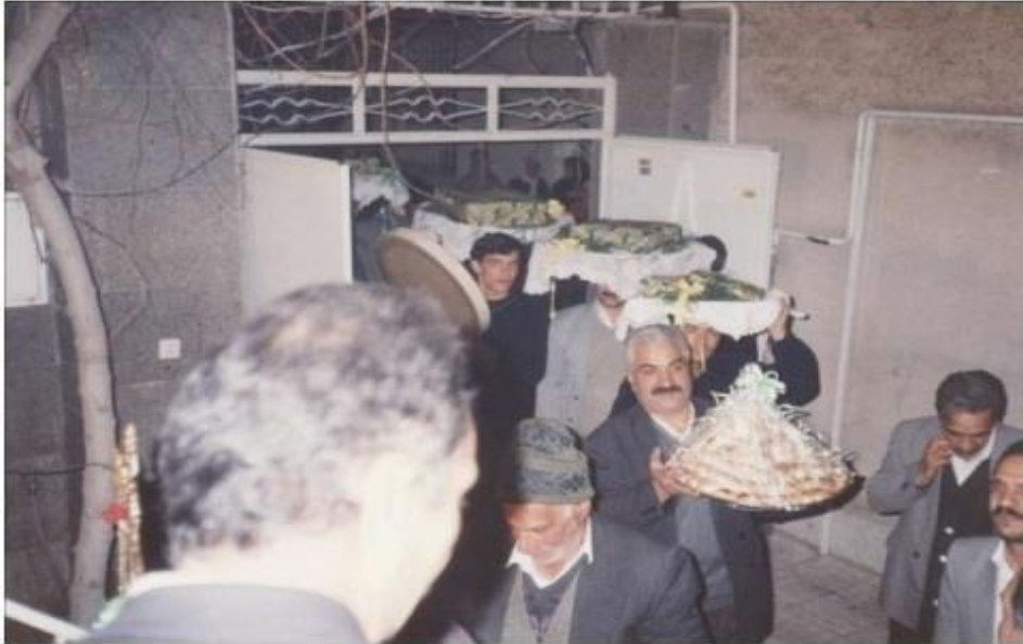
Foto (12). Oğlan evinden kız evine honça giderken, erkekler büyük bakır tepsileri başlarına konup, aini zamanda kaval, balaban ve saz çalınardı.