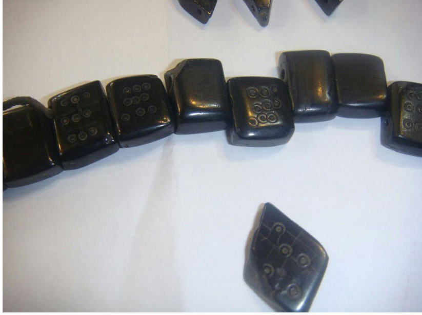
Foto (6). Şeve Taşı: Pahalı bir taştır, zahı ve çocuğa zarar deymesin diye kullanılır.