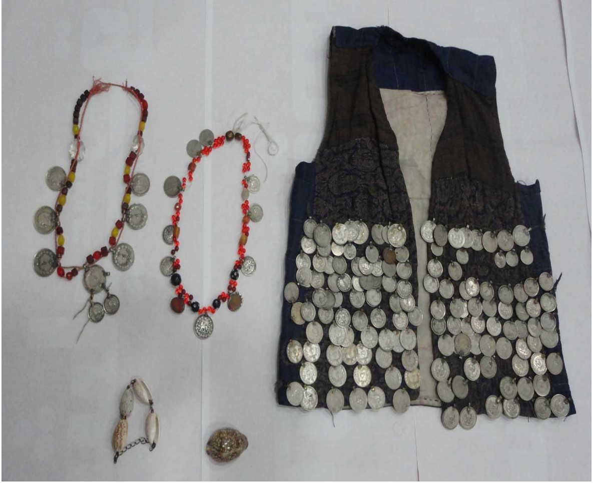
Foto (8). Sikke (eski bozuk para) ile süslenmiş Kadın yeleđi. Bu paralar sadece süslümük için deđil, Türk inancında demir koruyucu güce sahiptir.