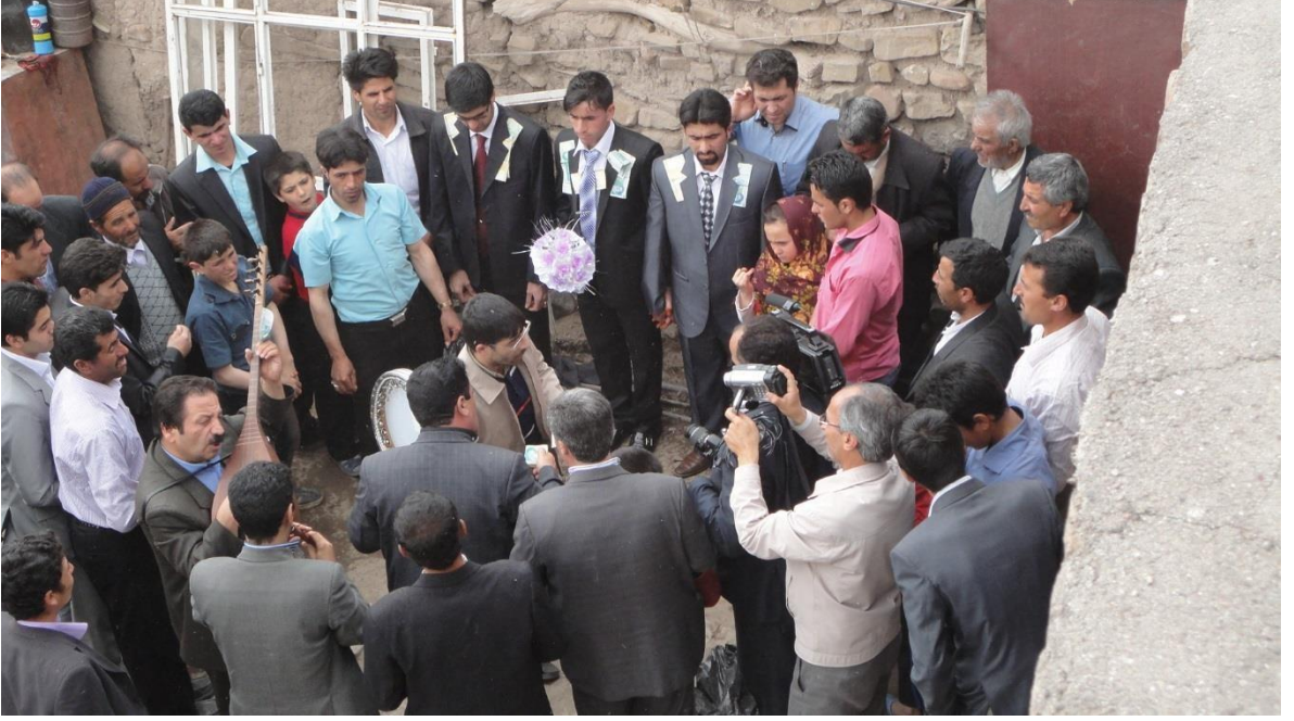
Foto (26). Aşık misafirlerden bahşış olarak beyi (damadı) tarif edir. ( tebrik deyip, iyi arzular dilemek)