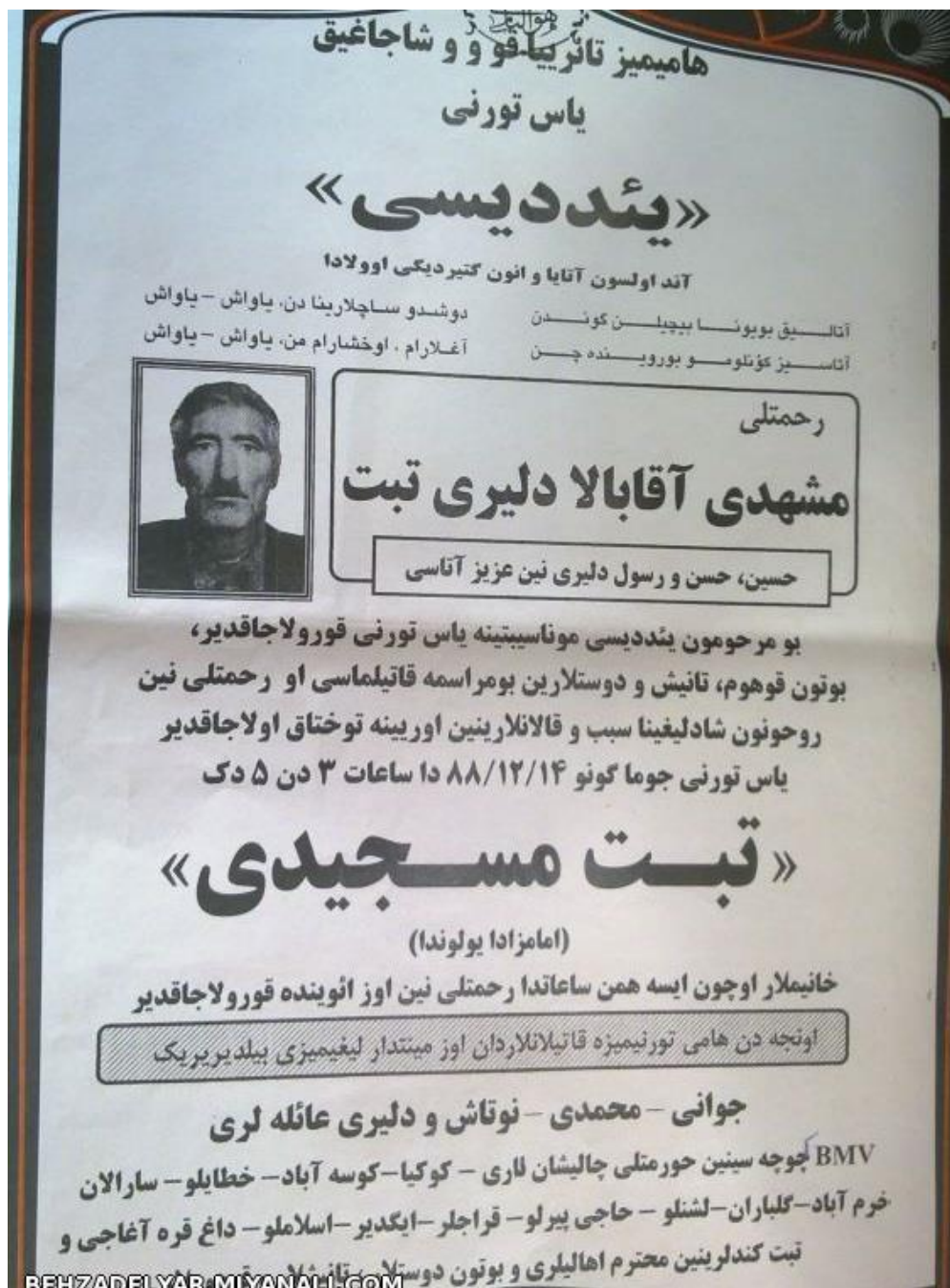
Foto (30). Azərbaycan Türkçesinde yedinci gün için hazırlanan bir ilan.