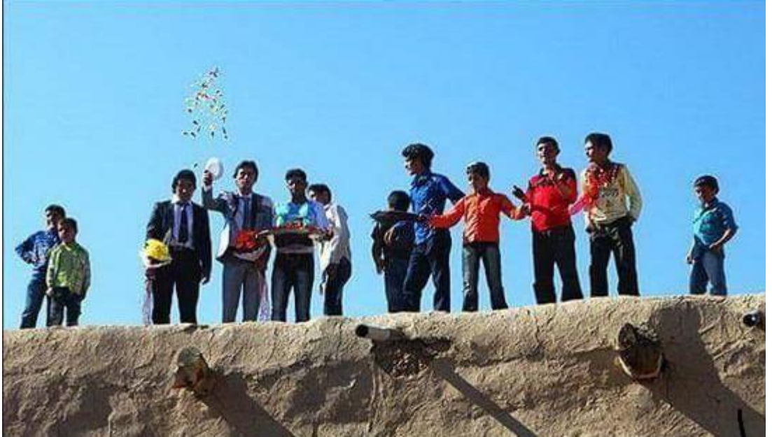
Foto(19). Gelin damatın evine girerken dama evin tabanından gelinin başına elma ve şimdiler çikolata ve tatlı atır.