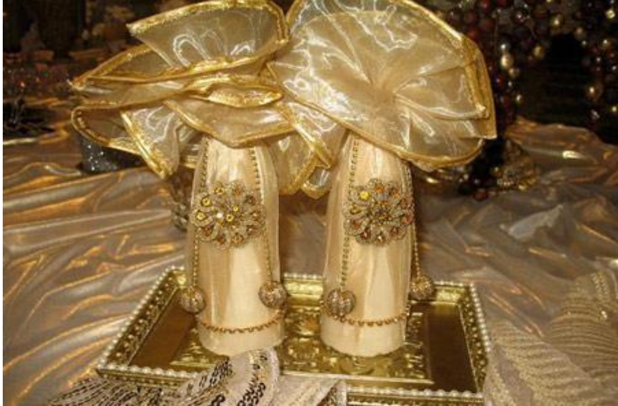
Foto (21). Suslanmış iki küpe şeker. Nikah okunurken gelin ve damadın başı üzerinde ovulur.