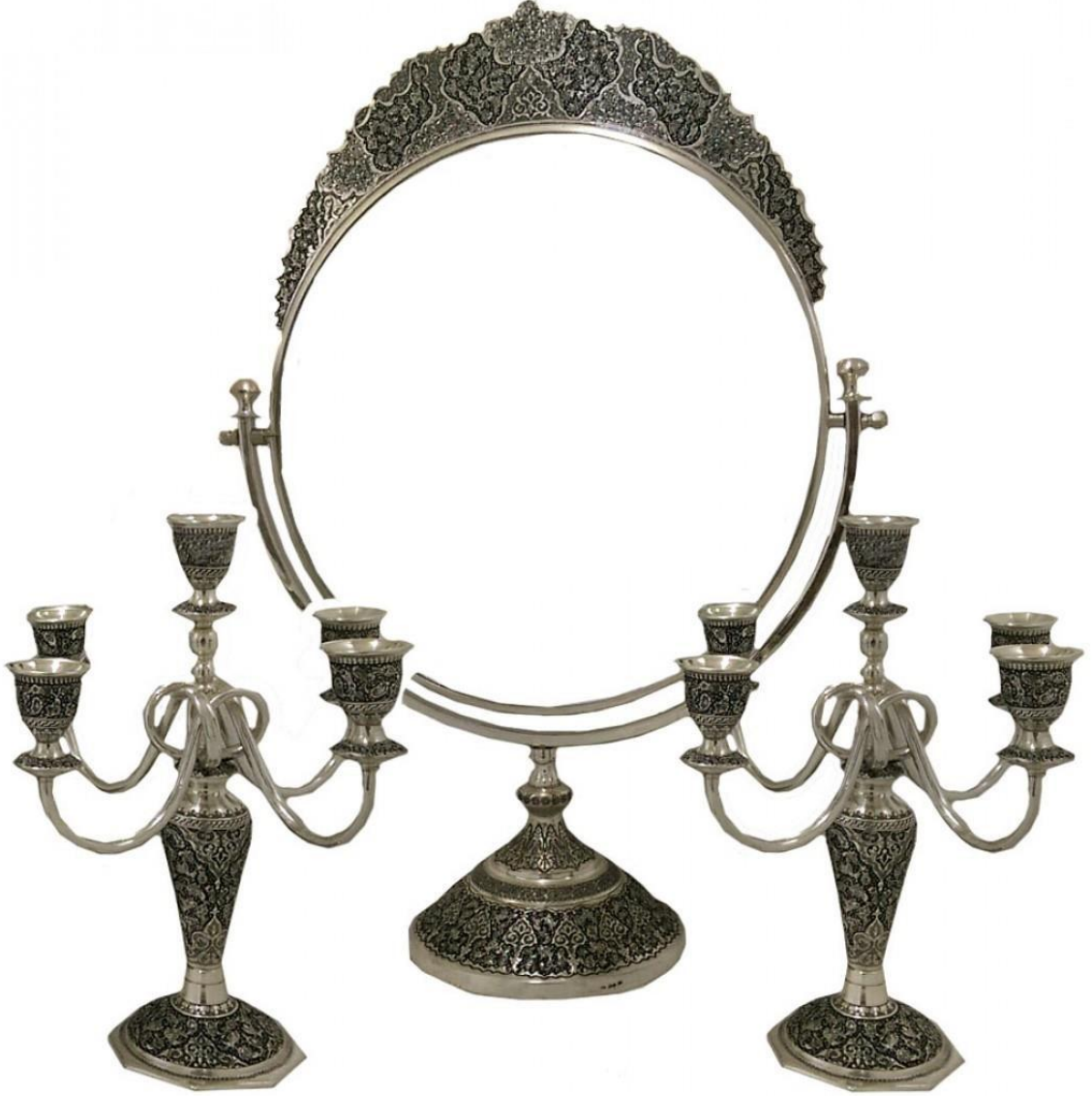
Foto (14). Duğun Alış verişinde ve Akıt sofrasında en önemli unsurlardan Ayna ve Şamdandır. Oğlan evi geline alır ve baht aynası olduğu için çok dikkatli tutulur ve evin baş köşesinde yerleştirilir.