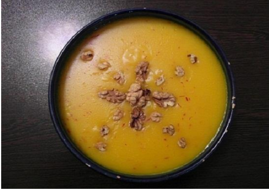
Foto (24). Kuymak evlilik geiş döneminde törensel yemek olarak gerdekten sonra gelin ve damata hazırlanır. Ü geiş dönemde hazırlanan törensel yemeklerin esas malzemesi ainedir: un, Őeker, su, zafran.