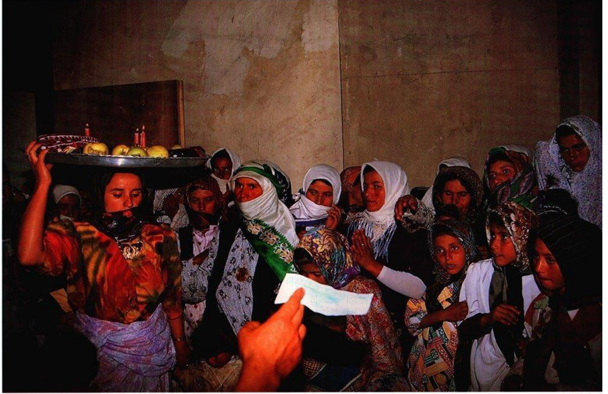
Foto (13). Kına Gecesi ođlan evinden kız evine honça götürölür. Honça meyve, tatlı, Kına, alınan hediyelek elbiseden oluşur.