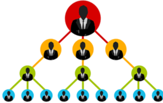
Şekil 2 : Piramit Şeması

sitesinin satışı neticesinde 175 dolar kar edilmekte ve web sitesi satın alan diğer mağdurlar da başka mağdurlara bu sistemi satarlarsa onların satışından da pay almaktadır. Dolayısıyla web sitesi mağdur tarafından dört kişiye satıldığı anda 700 dolar kendisini amorti etmekte, sonrasında yapılan her satış ise mağdura kar olarak gelmektedir.