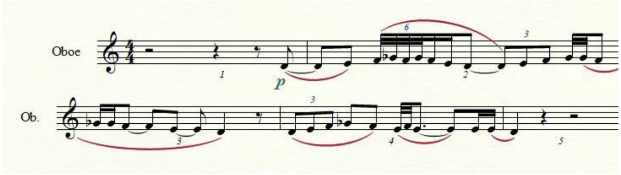
Görsel 21. 84- 87 ölçüler arası partiyon kesiti (Obua)

Ardından 84. ölçüde obua solosuyla devam eder.