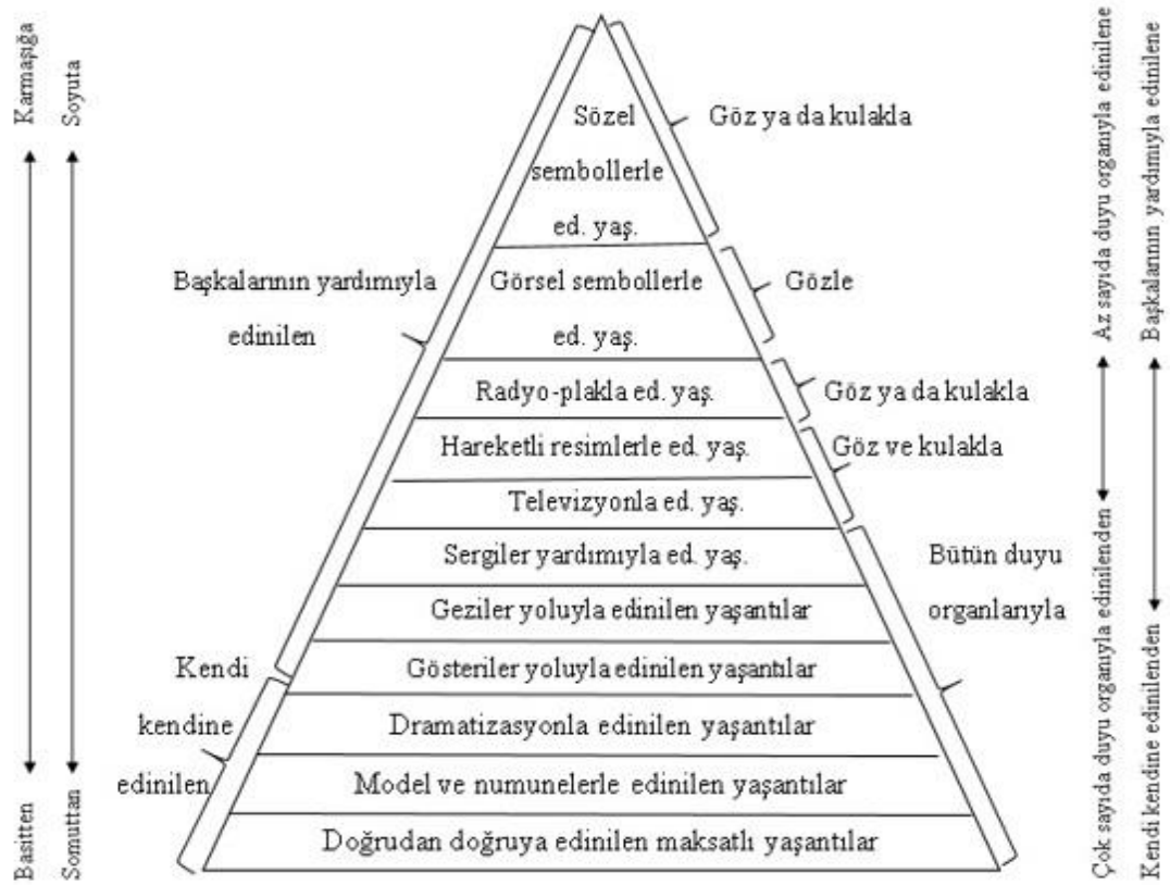
Şekil 1: Yaşantı Konisi

Görüldüğü gibi, Edgar Dale tarafından oluşturulan ve Kamuran Çilenti tarafından konuya uygun hale getirilen bu şema, öğrenmede materyalin önemini çok iyi anlatmaktadır. Öğrenme aşamasında kişilerin kendi kendilerine neler yapabileceği ve bir başka kişinin yardımı ile neler yapabileceği bu şemada görülmektedir. Bununla birlikte bu şemanın somuttan soyuta giden düzeni, kişinin hangi duyularıyla neleri öğrenebileceğini ya da karşılına çıkan bilgilerin hangi duyularına hitap ettiğini de açıklamaktadır. Bu da materyal oluşturma aşamasında materyal hazırlayanlara yön vermektedir. Çünkü hitap edilen her duyu, öğrenmede farklı etkiler göstermektedir. Birden fazla duyuya hitap eden materyaller ise öğrenmede çok daha etkili olmakta; bilgi daha iyi öğrenilip daha geç unutulmaktadır. Duyuların öğrenmedeki etkileri düşünüldüğünde yaşam konisine göre insanlar öğrendiklerinin: