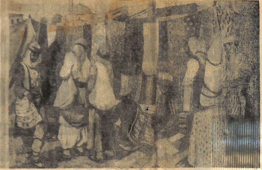
Şeref Akdik'in öy Pazarı