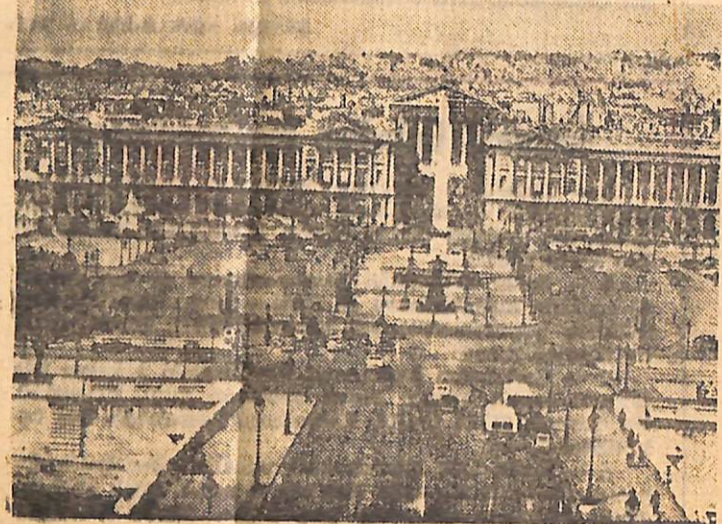
CRILLON OTELİNİN BAKMAKTA OLDUĞU ÜNLÜ CONCORDE MEYDANI, ORTADAKİ OBELİSKE SULTANAHMETTEKİ DİKİ-LİTASIN BİR EŞİDİR.