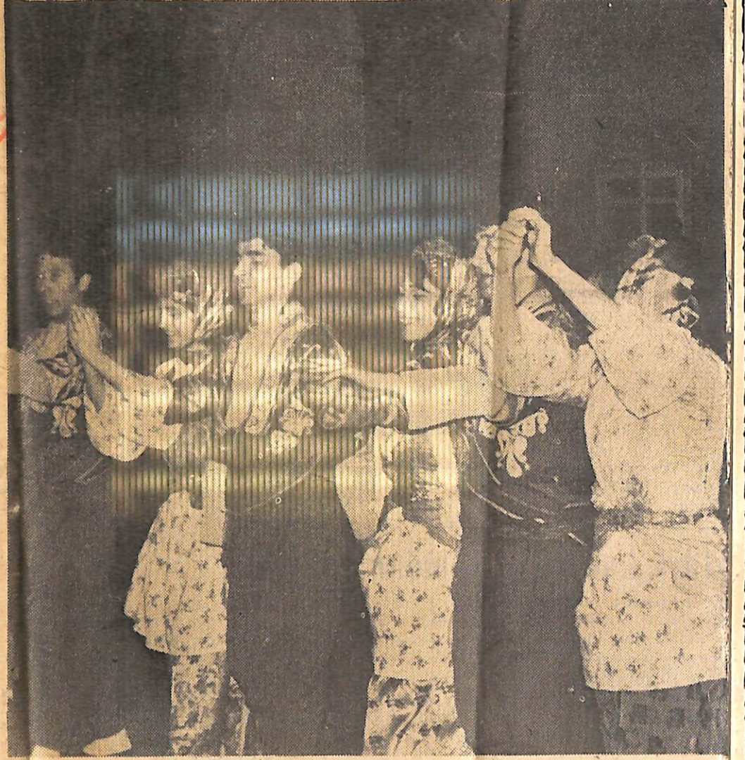
Strasburg'taki Türk haftasında halk oyunu gösterileriyle büyük ilgi toplayan Üniversiteli gençlerimiz gerek mahalli basında, gerek sair Fransız ve Alman gazetelerinde övücü yazılara konu olmuşlardır. Resimde halk oyunu gösterileri yapan gençlerin bir kısmı

tarımlı bir gazetede şunlar yazılıydı. «Anadolu köylerinin bir tablo kada, güzel millî kıyafetleri içinde halka Türk halk dansını ve müziğini sunan folklor ekibi orada bulunanlar tarafından hayranlıkla karşılanmış ve alkışlanmıştır. Ülkelerinin geleneklerini ritim ve müzikle anlatmak isteyen on erkek ve kız öğrenci dansları bütün gerçekliği ve orijinalliği ile seyirciye göstermek için bilhassa büyük bir dikkat göstermiştir. Mevsimlerin dans ve müzikle tasviri büyük bir tabiiyet ve güzellikle olması bilhassa hayranlık uyandırmıştır. Gençlerin bu başarılarından dolayı dakikalarca alkışlanmasına havretmemek lâzım.»