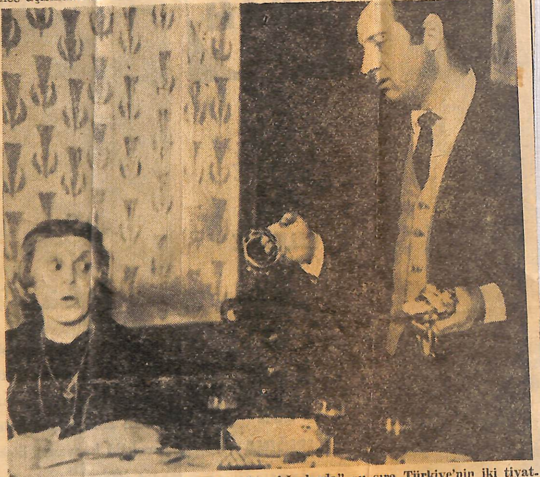
Marguerite Duras'ın oyunu "Bütün Gün Ağaçlarda" şu sıra Türkiye'nin iki tiyatrosunda birden, Ankara ve İstanbul'da oynuyor. İstanbul Şehir Tiyatrosundaki oyundan bir başka görünüş.

"Yeni roman"ın usta bir temsilcisinin okunması gereken bir oyunu. Salâh Birsell'in akıcı Türkçesi, Duras'ın dilini Türkçede başarıyla yansıtıyor. İhtiyarlığın bütün psikozları ayrıntıyla veriliyor.