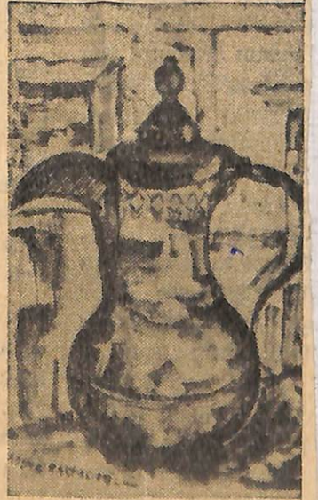
Baltacıoğlunun bir eseri.

teknisinde ulaştığı olgunluk kadar, diğer renklerin kullanılmasında da başarı sağladığı görülen ressamın ilk tablosu, ayrıca «Derinlik» yönünden ilgi çekici idi. «Bİ ZİM SOKAK» ve «GECE» adlı tablolarındaki derinlik sanatçının ulaştığı ustalığı göz-