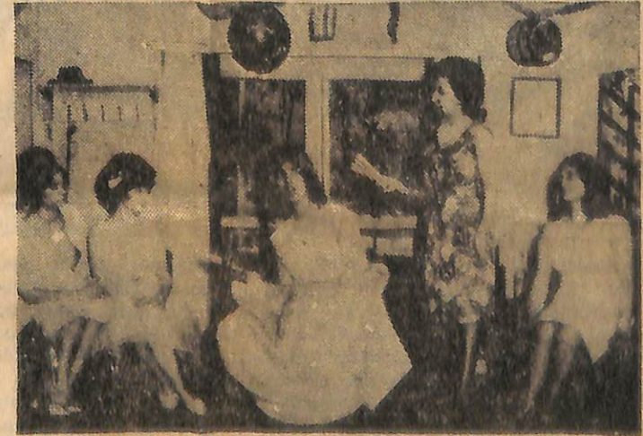
Deniz Kuvvetleri Tiyatrosu tarafından temsil edilen «Teyzesi» adlı oyundan bir sahne... Büyük fedakârlıklar ederek sahneye çıkmayı kabul eden Bahriyelî eşlerinin rol aldığı bu oyun Ereğli'de temsil edilmiştir...