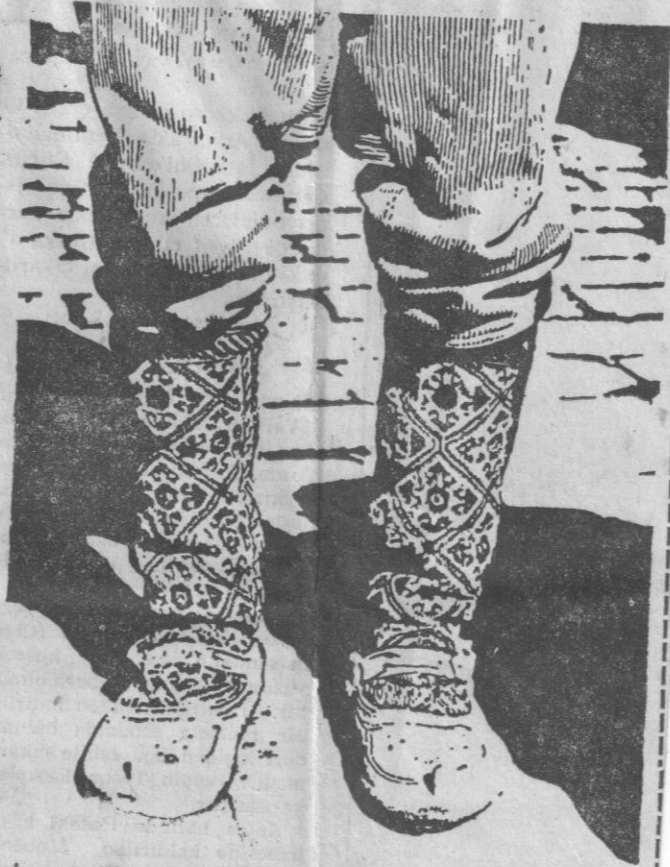
Paris sergisinde büyük ilgi uyandıran Türk halk örmesi çoraplarından örnek. Bir fotoğrafa göre aynen yapılmıştır.

Ben and Gaby Grey Foundation tarafından geçen yıl Türkiyede satın alınmış olan 24 sanatçımıza ait 44 parça grafik resim, Amerika'nın Minneapolis şehrinde sergilenmiştir. Bedri Eren Eyüboğlu gibi birçok ressamın eserleri arasında grafik resim sahasında ihtisası olan Asher'in altı tablosu bulunmaktadır. «Bugünkü Türk sanatı» adıyla tertiplenen sergi bütün Amerika'yı dolaşacaktır. Neticede bu eserler Ben and Gaby Grey Foundation tarafından başka Amerikan müesseselerine satılacaktır. Çağdaş Türk Grafik Resim Sergisi, Minneapolis'te büyük bir ilgi ve takdir uyandırmıştır.