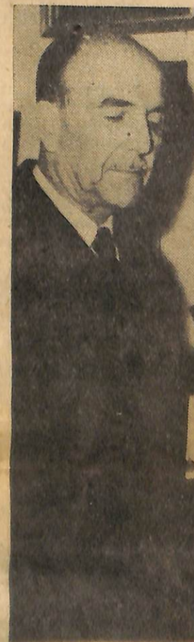
CEMAL REŞİT REY

İstanbul Senfoni Orkestrası yorucu emisyonlarından birini bitirmiş, üyeleri stüdyonun küf kokan sun'i havasından bir an önce kurtulabilmek için aceleyle giyiniyorlardı. Orkestranın Şefi C. Reşit Rey de aynı aceleyle çok penbe ve çok çiçekli kravatını bağlamaya çalışıyordu. Tam bu sırada orkestranın muzip sanatçılarından biri C. Reşit'in yanına yaklaştı ve: «Hocam, maşallah dedi. Görüyorum ki modayı izliyorsunuz. Hani Antuan modeli kravat da size çok yakışmış» diye ilâve etti. Bütün yorgunluğuna rağmen iyi bir gündünde olan Cemal Hoca gülerken: «Hani şu, sahnede çok konuşan, sulu şarkılar söyleyen uzun saçlı şarkıcıdan mı bahsediyorsun?» diye sordu. Karşısındaki C. R. Rey'in hafif müzik hakkındaki bu bilgisine şaşarak «Evet» diye tasdik edince C.R.Rey «Ayol senin bilmediğin bir şey var. Antuan kravatının modelini asıl o benden aldı. Zira ben bu kravatı satın aldığım zaman Antuan diye biri dünya yüzünde yoktu».