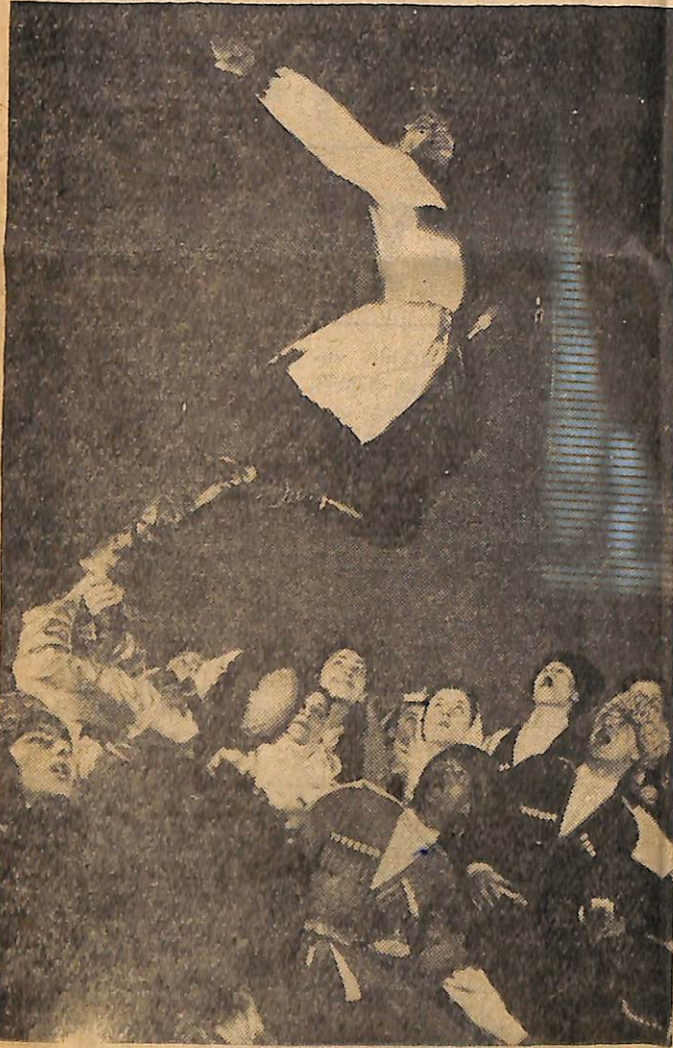
Kafkas balesi bir gösteri esnasında.

Bugün Karinska evinde sekreteri, Çinli açısı ve köpeği ile yaşıyor. Evinin bütün ay rınıtları Joan of Arc'a olan sevgisini aksettiriyor. Bence sende en güzel çiçekleri yetiştiren Karinska'ya bunları nasıl yetiştirdiğini sorduğumda şöyle cevap verdi : « Onlara her gece iyi uykular diler, öperim. Bazen kahve bile veriririm. İçimdeki yaşama sevgisi ile herşeye hayat verebileceğime inanırım ».