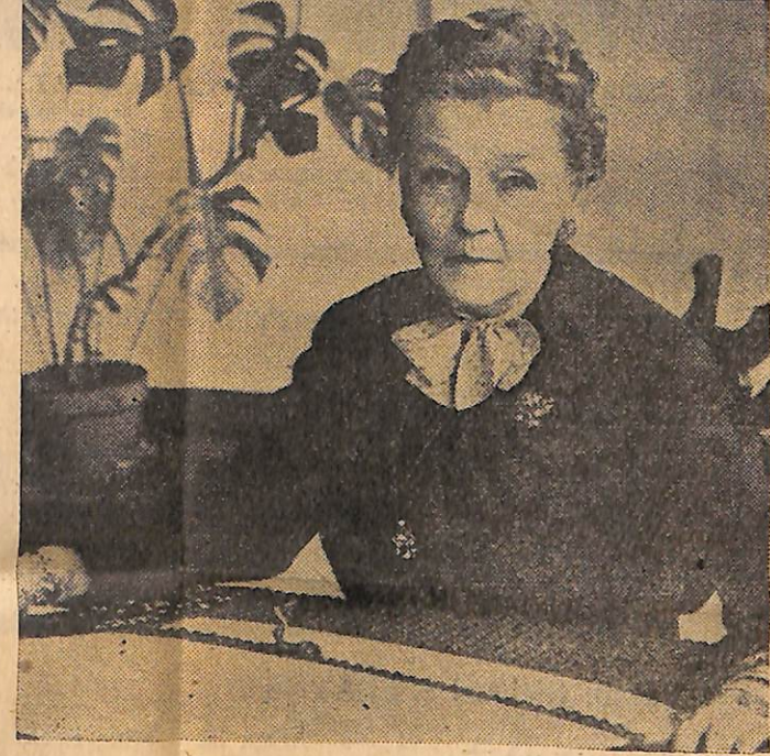
KARINSKA İŞ BAŞINDA