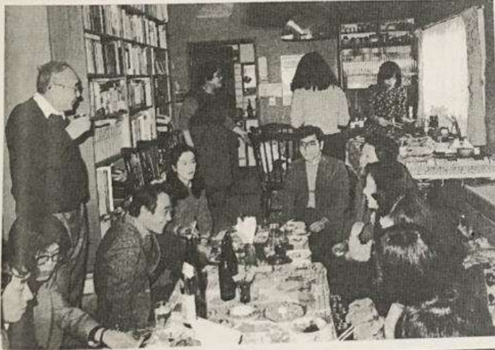
1984年1月 63歳 護先生宅（小田急善 行）での新年の集い