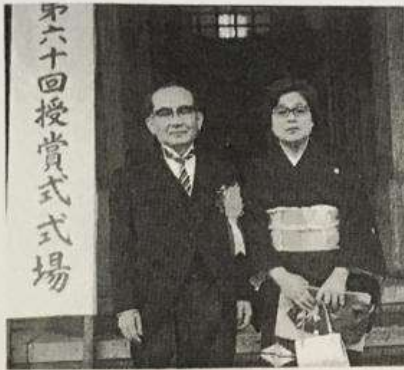
1970年5月29日 49歳 第60回日本學士院賞授賞式に臨まれる 先生と道子夫人