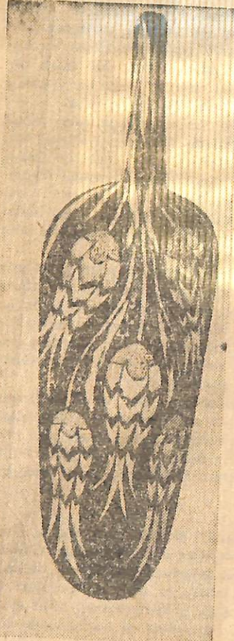
■ Bakkal küreği (Ankara çevresi-ne ait) Rüstem Paşa Câmiinden çini desenleriyle bezenmiş (Lâle motifleri).

«Bir takım sert âletlerle muayyen bir mukavemet gösteren maddeler (taş, tahta, maden ve kristal) gibi üzerine hâk (oymak) suretiyle yapılan resimlere (gravür) denir. En eski tahta üzerine gravür 1418 tarihli İsa - Meryem tasviridir. (Pyrogravure) Fransızca bir