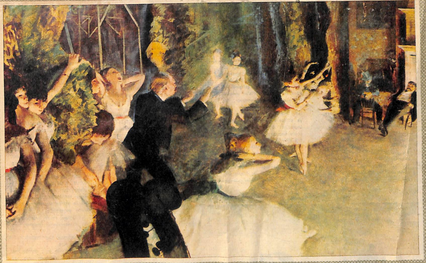
BALE SAHNESINDE PROVA