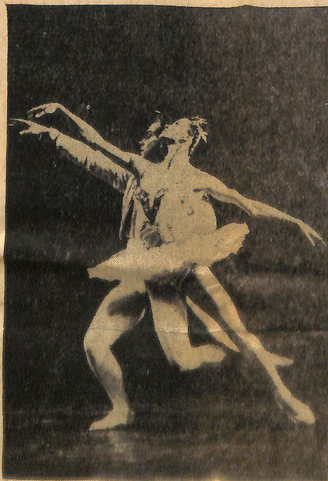
İngiliz balesinin iki ası bir gösteride