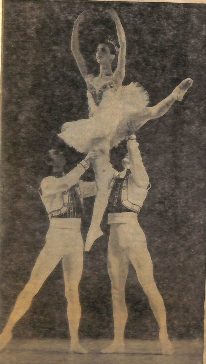
Türkiye'ye geliş mevsimin en ilgi çekici sanat olaylarından birisi olarak kabul edilen Londra Festival Balesinin gösterilerinden birisi.