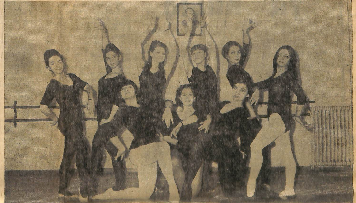
HAZIRLANIYORLAR — Genç Balerinler resital için muntazam bir şekilde çalışmalarına devam etmektedirler.