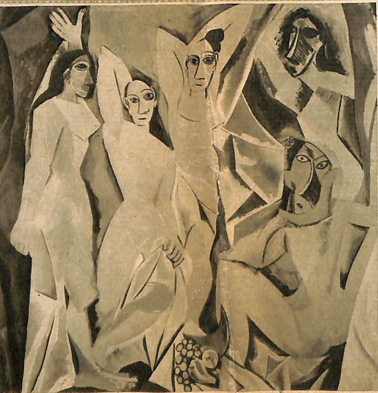
AVİGNONLU GENÇ KIZLAR

Picasso bir gün arkadaşı Matisse'in evinde Afrika zenci heykellerini gördü, bunlardaki özensiz içtenliğe hayran kaldı. Ondan sonra kendisi de bu yolda çalışmaya koyuldu. Böylece, bir «fauviste» olan Picasso, bu yoldan yeni bir yöne doğru atıldı, 1907'de Kübizmin ilk formüllerini ortaya koydu. Şimdi hayatı ve çevresini yeni bir biçimde görüyor, her şeyi tablosuna birtakım küplerden meydana gelmiş gibi geçiriyordu. O sıralardaki