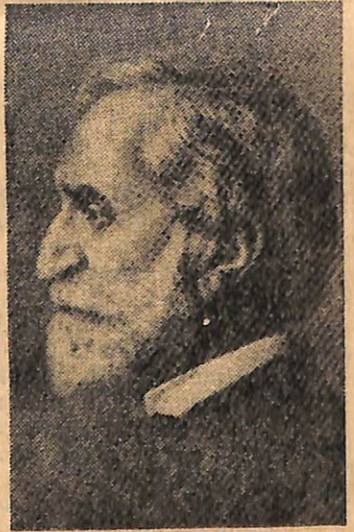
VERDİ — Hatıraları unutulmuyor.

frank yolladı. Kısa mektup aynen şöyle yazılmıştı: «Sayın bayım, müsaade buyurun sanız size 1500 frankınızı ve ilişğinde 500 frankla birlikte gönderiyorum. Bu 500 frank misafirlerinizin konuşmalarını kesmeye teşebbüs ettiğim için kendi kendime kestğim bir para cezasıdır.»