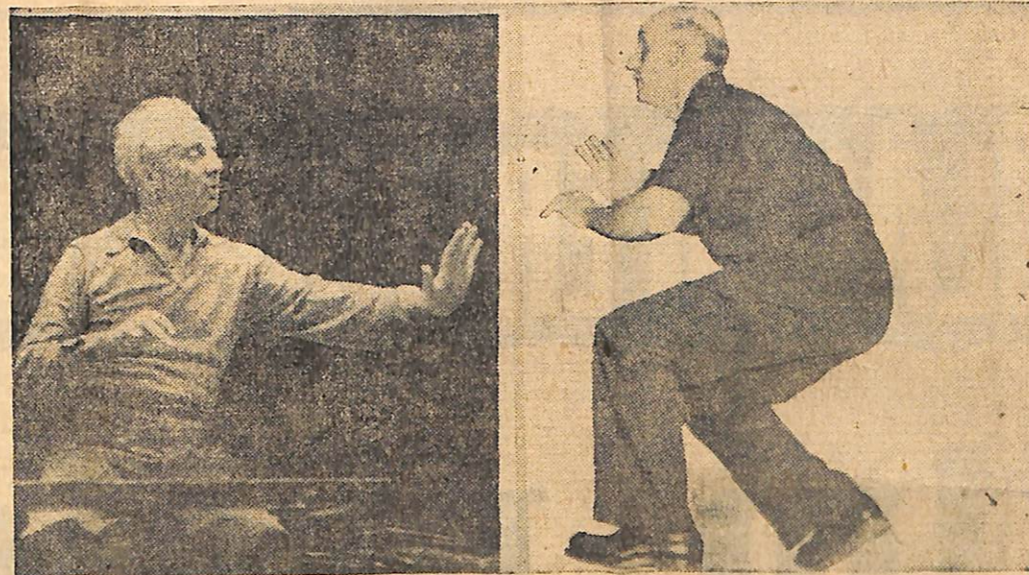
Leopold Stokowski ve Dimitri Mitropoulos orkestra yönetirken