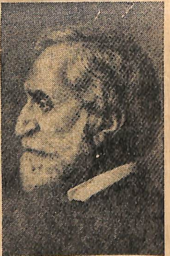
VERDİ — Hatıraları unutul- muyor.

frank yolladı. Kısa mektup aynen şöyle yazılmıştı: «Sa- yın bayım, müsaade buyurur sanız size 1500 frankınıza ve ilişğinde 500 frankla birlikt- te gönderiyorum. Bu 500 frank misafirlerinizin konu- malarını kesmeye teşebbüs ettiğim için kendî kendime kestiğim bir para cezasıdır.»