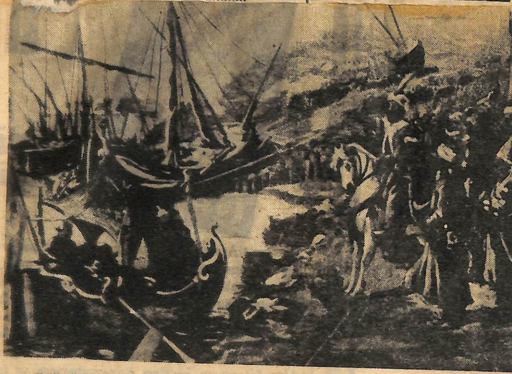
Fatih Sultan Mehmed, İstanbul'u fethetmek için gemilerini Halic'e indirirken..

Yapı ve Kredi Bankası, çeşitli kültür işle- rinde önderliği çoktan ele almıştır. Ve cidden hakkıdır da. Bu defada orada çok enteressan bir sergiye şahit oluyoruz.