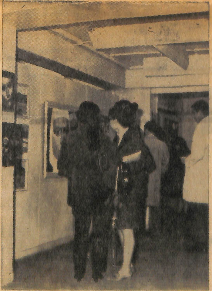
Muhsin Kut'un sekizinci sergisi büyük ilgi gördü ve bazı tablolar hayranlıkla seyredildi.