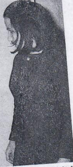
Fotoğrafta Léopold Lévy'yi anmak için Akademide tertiplenen sergiden bir köşe görülmektedir.

zaklaşmış, mahallenin tılsımı kaçmıştı. Resim sanatı, arada geçen yıllarda tabiat karşısında uzun bir kendinden geçme olmaktan çıkmıştı. Oysaki, tabiatın görüntüleri karşısında pek az ressam Leopold Levy kadar derinden ilgi duymuş, duyduklarını anlatmasını bilmiştir.