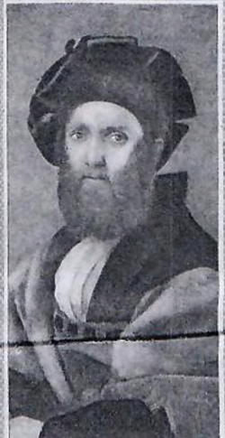
BALTASSARE CASTIGLIONE (Portre)

— Ben biliyorum: Onların ağızları yok, gagaları var da ondan. Gagaları sivri olduğu için ısıklık çalıyorlar.