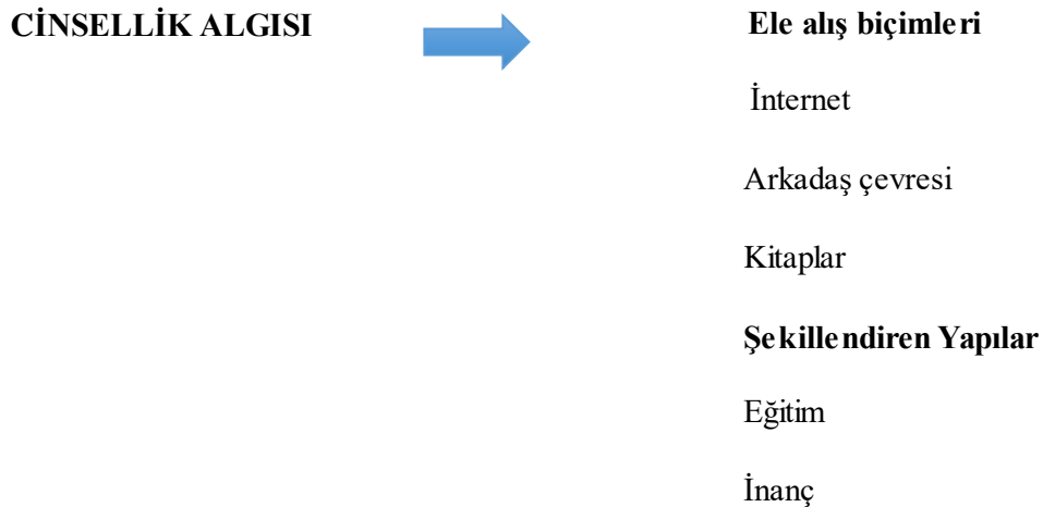
Tablo 1: Araştırma Modeli: