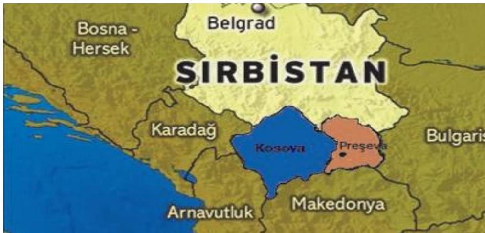
Şekil 1. Sırbistan Haritası

Preşova Vadisi'ndeki etnik topluluklar arası ilişkilerden kaynaklanan sorunların araştırılması için, öncelikle bu bölgenin coğrafi konumunun ve tarih boyunca yaşanan gelişmelerin değerlendirilmesi önem arz etmektedir. Preşova, Buyanots ve Medvece Belediyeleri Sırbistan Cumhuriyeti'nin güneyinde yer alır, Kosova ile Dukagyin Vadisi'ne sınırı bulunmaktadır. Sırbistan, Makedonya ve Kosova üçgeni arasında yer alan bölgenin büyük bir kısmını, Sırbistan'ın güneyi ile Kosova Anamoravas, Kosova'nın merkez bölgesi ve Makedonya'yla bağlayan ana otoyol ve demiryollarının içinden geçtiği dağlık bölgeler oluşturmaktadır. Preşova şehri, kuzeyde Buyanots ve Vrane, güneyde Kumanova ve Üsküp, batıda ise Gilan ve sonrasında tüm Kosova'yla bağlanan bir coğrafi düğümü teşkil etmektedir. Preşova şehri E – 75 otoyolunun 5 km batısında ve Preşova ile Gilan'ı bağlayan M – 25.2 otoyolunun da güzergahı üzerinde bulunmaktadır. Ulaşımına uygun konumu, şehrin ekonomik gelişiminin esasını oluşturmaktadır. Şehrin bulunduğu bölgeden en önemli altyapı koridorları olan Belgrad – Niş – Üsküp demiryolu ve karayolu ulaşımı yolları, 1888 yılında inşa edilen Belgrad – Üsküp – Selanik demiryolu geçmektedir (Qazimi, 2010). Bu iki önemli rota Avrupa'yı Ege Denizi'yle bağlamaktadır (Kelmendi, 2006).