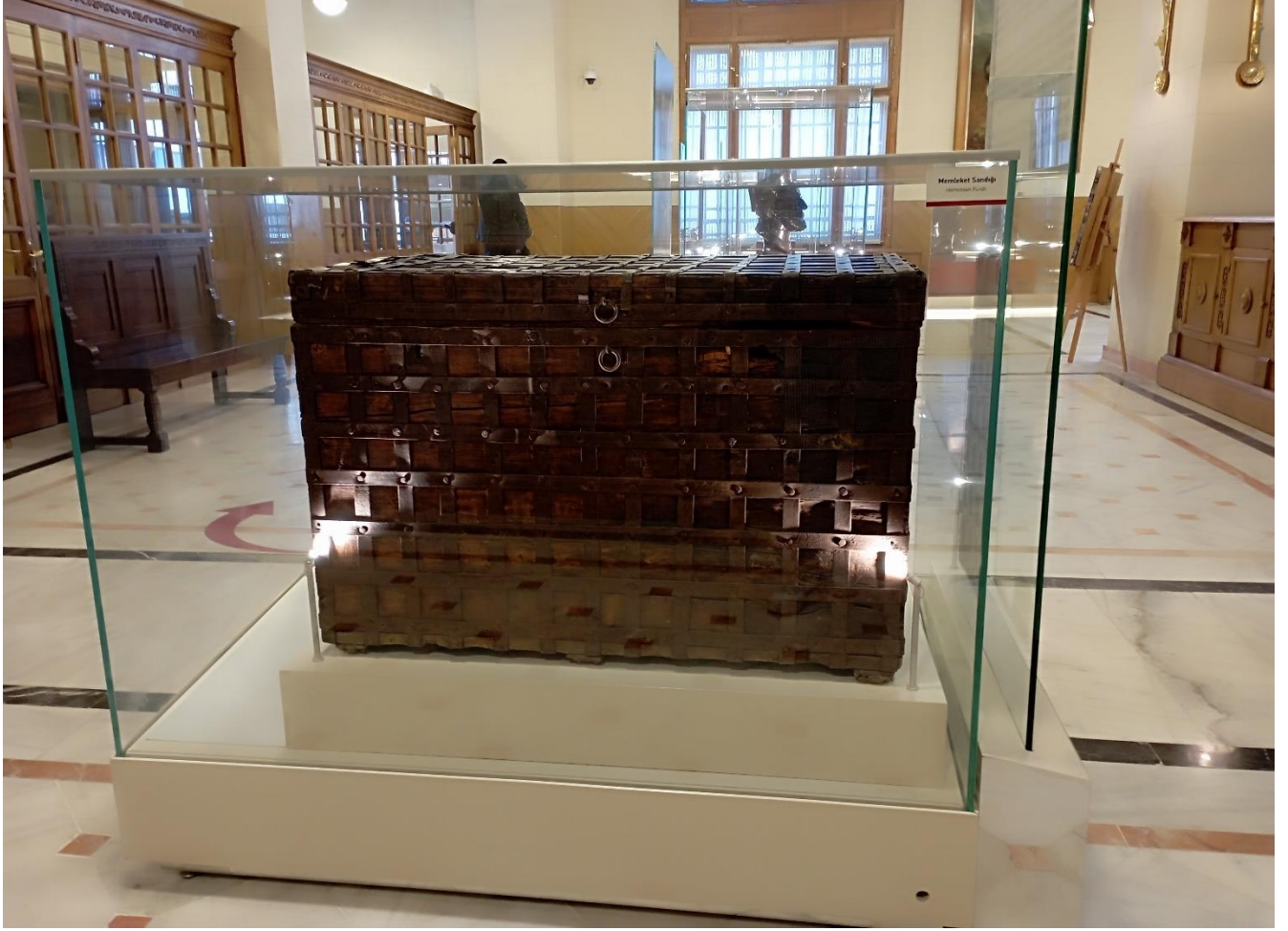
Ek 3: Memleket Sandıklarının bir replikası, Ziraat Bankası Müzesi'nde yer almaktadır.