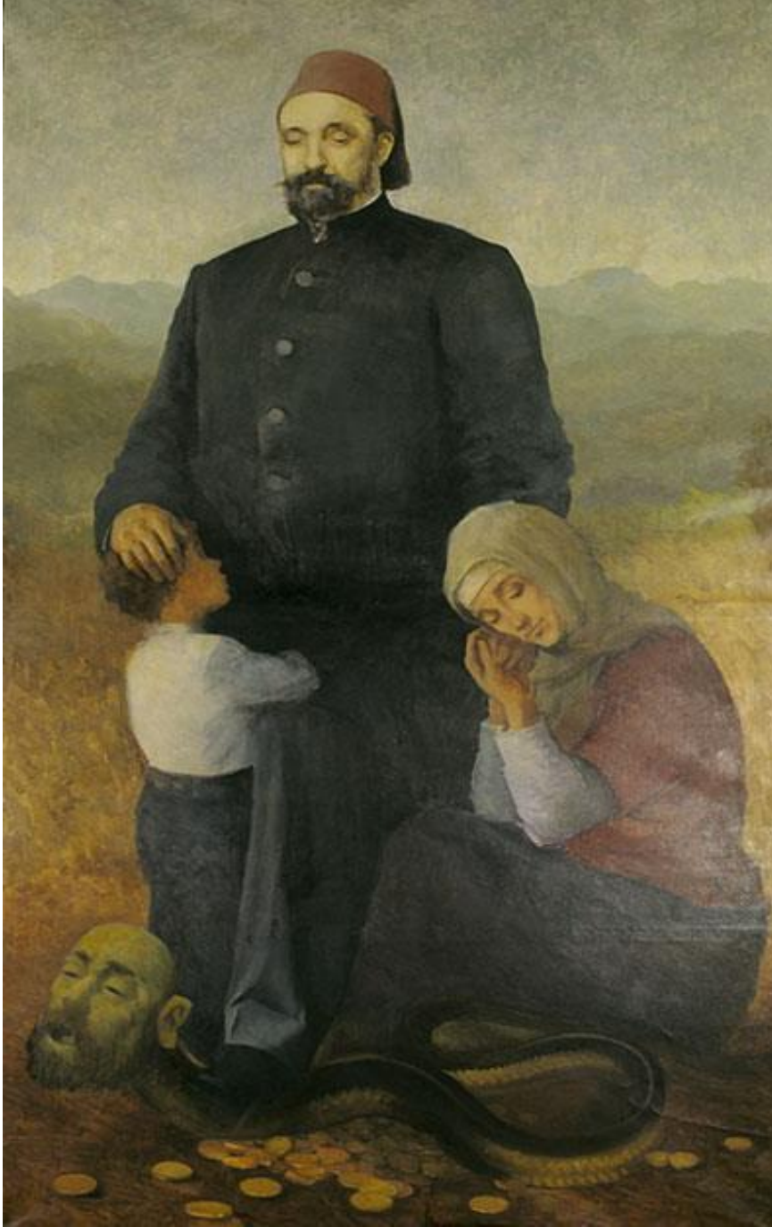
Ek 2: Mithat Paşa'nın yoksul halkı tefecinin elinden kurtarışını temsil eden tablo 377