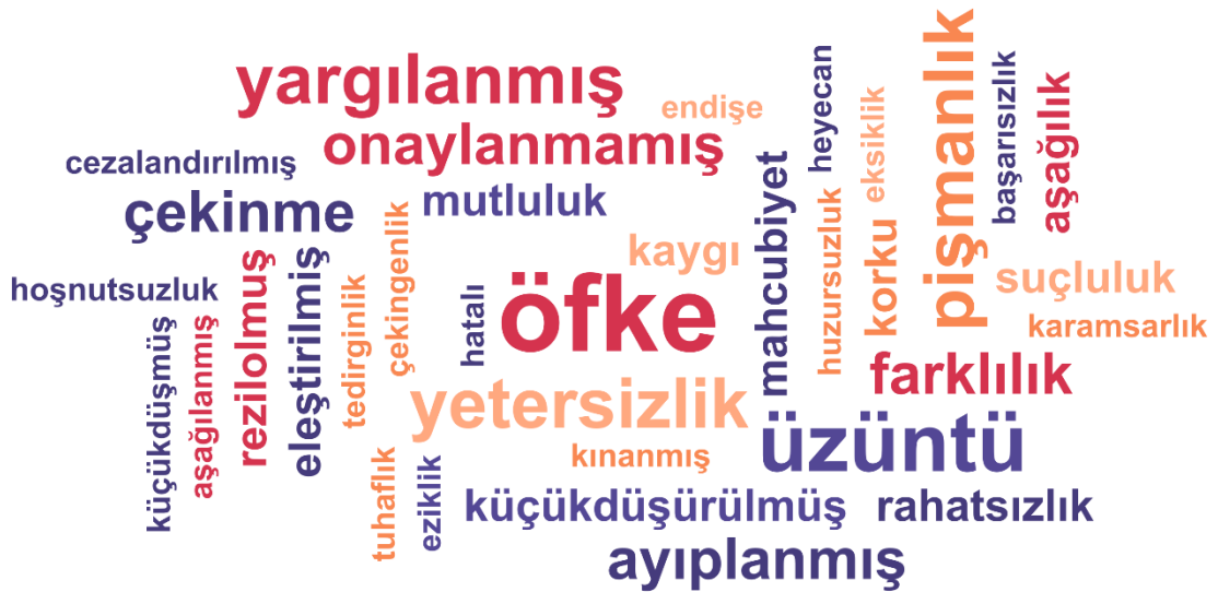
Şekil 1. Utançla ilişkilendirilen duygulara dair kelime bulutu

Utanç duygusunun hissettirdikleri çok çeşitlidir. Gençlerle yapılan görüşmelerin bütününde toplamda 72 kez utançla ilişkilendirilen bir duygu ifadesi kullanılmıştır. Bunlar içerisinde 36 farklı duygu ifadesinin utançla ilişkilendirildiği görülmüştür. Utançla birlikte en çok anılan gelimeler sırasıyla öfke, üzüntü, pişmanlık, yargılanmışlık, yetersizlik ve ayıplanmışlıktır. Aşağıda yer alan kelime bulutunda utançla ilişkilendirilen diğer duyguları görmek mümkündür. Kelime bulutunda en büyük fontla yazılan kelimelerin sıklığı en fazla olacak şekilde görselleştirilmiştir.