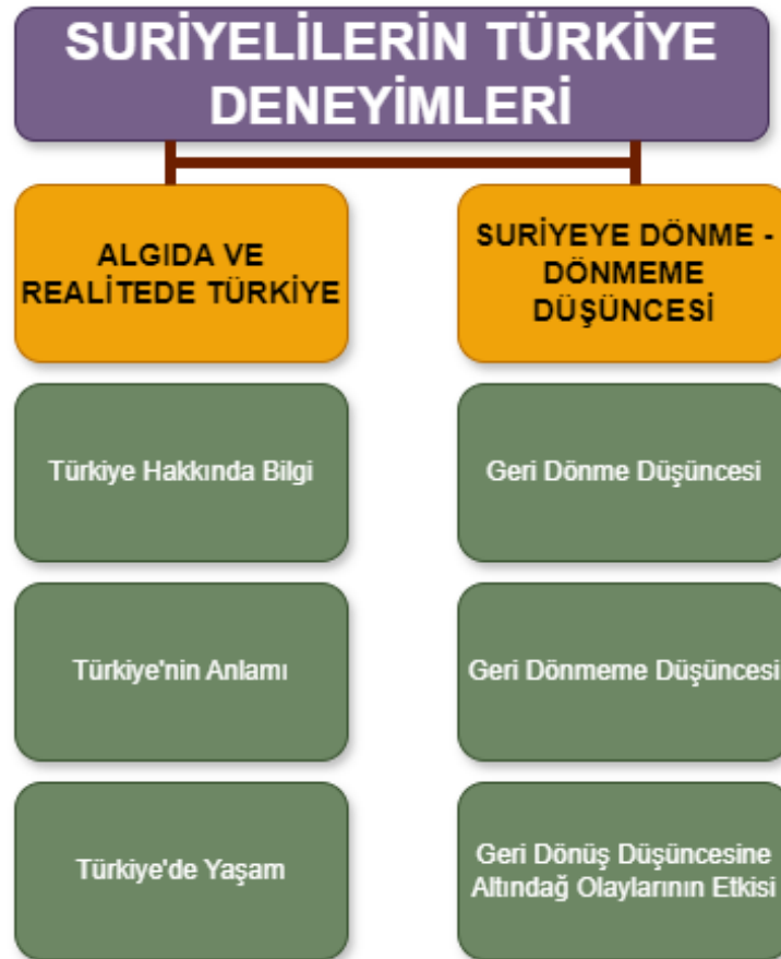
Şekil 5. Suriyelilerin Türkiye Deneyimlerine Ait Şema

Bu başlık altında Suriyeli göçmenlerin Türkiye'ye gelmeden önceki Türkiye algıları, Türkiye'ye geldikten sonra Türkiye'yi ne şekilde anlamlandırdıkları, Türkiye'deki yaşam hakkındaki olumlu ve olumsuz düşünceleri, kendilerine fırsat sunulduğu takdirde ülkelerine dönmek isteyip istemedikleri ve bunun Altındağ Olayları ile ilişkisi ele alınmıştır. Bu kapsamda çalışmanın bahsi geçen konular “Algıda ve Realitede Türkiye” ve “Suriye'ye Geri Dönme / Dönmemesi” alt temaları altında tartışılmıştır. Tema, alt tema ve kategorilere ait şema şekil 5'te gösterilmiştir.