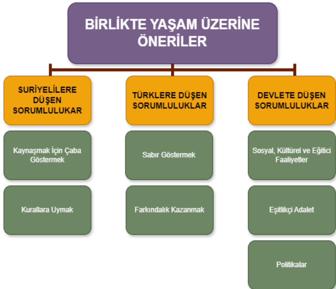
řekil 8. Birlikte Yařam Üzerine Önerilere Ait řema

Bu başlık altında katılımcıların gözünden yeniden Altındađ Olaylarına benzer olayların yařanmaması ve iki halkın uyum içinde yařayabilmesi için gerekli önerilere yer verilecektir. Bu kapsamda bahsi geęen konular ‘‘Suriyelilere Düşen Sorumluluklar’’, ‘‘Türlere Düşen Sorumluluklar’’ ve ‘‘Devlete Düşen Sorumluluklar’’ olmak üzere 3 alt temadan oluşmaktadır. Tema, alt tema ve kategorilere ait řema řekil 8’de gösterilmiştir.