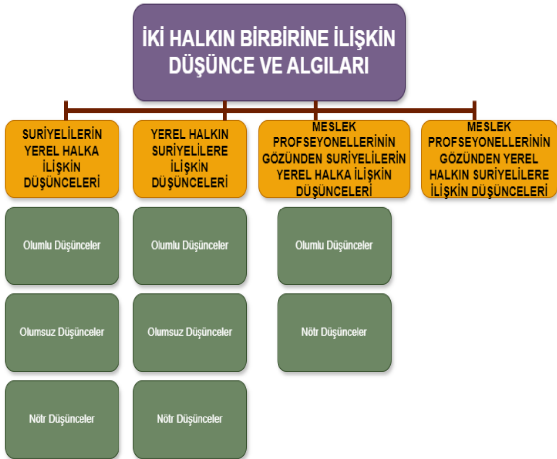
Şekil 7. İki Halkın Birbirine İlişkin Düşünce ve Algılarına Ait Şema

Bu ana tema altında Türk ve Suriyeli katılımcıların birbirlerine yönelik algı ve düşüncelerine ve de profesyonellerin gözünden iki halkın birbirine yönelik algı ve düşüncelerine ilişkin bulgulara yer verilmiştir. Bu bağlamda çalışma “Suriyelilerin Yerel Halka İlişkin Düşünceleri”, “Yerel Halkın Suriyelilere Yönelik Düşünceleri”, “Meslek