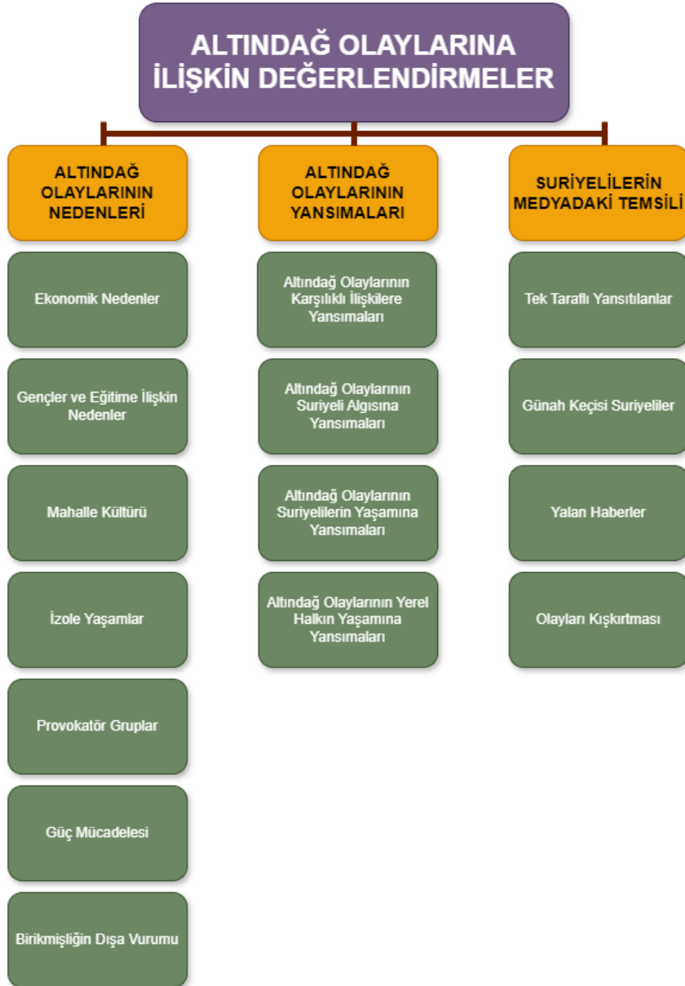
Şekil 6. Altındağ Olaylarına İlişkin Değerlendirmelere Ait Şema

şekilde yansıdığı bunların yanı sıra katılımcıların gözünden medyanın Suriyeli temsili incelenecektir. Bu kapsamda çalışma “Altında Olaylarının Nedenleri”, “Altında Olaylarının Yansımaları” ve “Suriyelilerin Medyadaki Temsili” olmak üzere 3 alt temaya ayrılmıştır. Tema, alt tema ve kategorilere ait şema şekil 6’da gösterilmiştir.