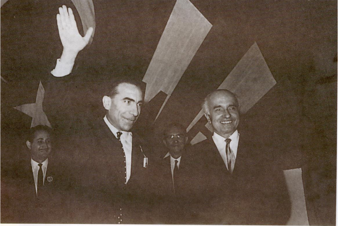
Alparslan Türkeş, Genel Başkanlığını ilan ediyor.