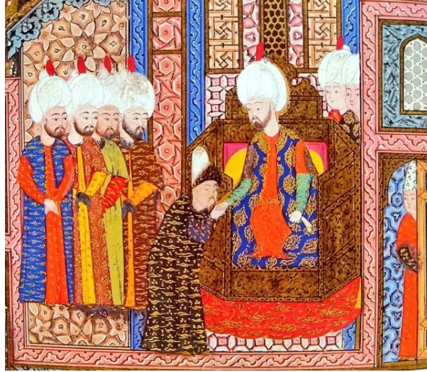
Resim 4: I. Süleyman (sağda), Kırım Hanı Devlet Giray'a elini öptürüyor (Esin Atıl, Süleymannâme , resim 53'ten ayrıntı.)

Hanı Mehmed Giray'ı geçireceğinden şüphelenmiş ve Han'ı Yedikule'ye hapsedirmişti. 358