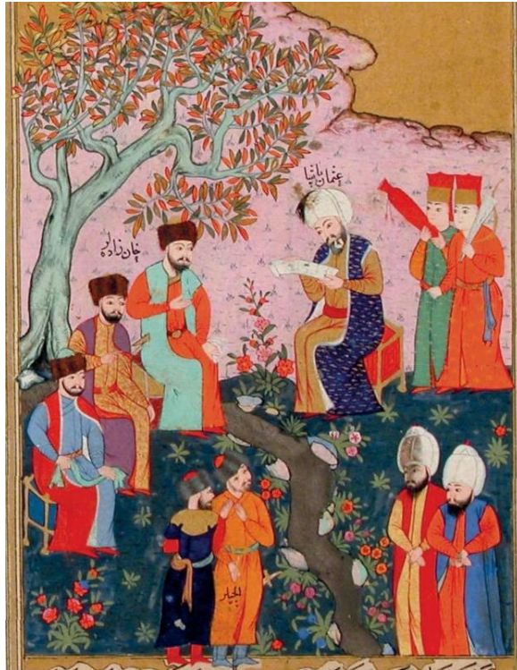
Resim 5: Sadrazam Osman Paşa, Kırım hanzadelerinden daha hâkim bir konumda oturarak Han'ın itaat mektubunu okuyor ( Osmanlı Minyatüründe Belgeler , s. 107, ayrıntı).