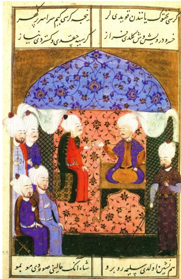
Resim 3: Sultan I. Selim (sağda) Çaldıran'da esir ettiği son Timurlu hükümdarı Bediüzzaman Mirza ile konuşurken, muhatabından üstün bir konumda çizilmiştir (Şükrî, Selinnâme , TSMK, H. 1597, s. 140a).

dönemde, 1873-1881 arasında yazılan Netâyicü'l-vukûât adlı eserde I. Selim'in Timur oğulları üzerine yürüyerek onlardan ulu dedesi I. Bayezid'in intikamını almak istediği, onu bu fikirden veziriazam Pîrî Paşa'nın vazgeçirdiği yazılıdır. 353 Bu olay gerçek olmasa bile XIX. yüzyılın tarihsel hafızasında Ankara Savaşı'nın tuttuğu canlı yeri gösterir. Tatarları yenen Memlûkleri yenmek Selim için yeterince tatmin edici olmuş olmalı.