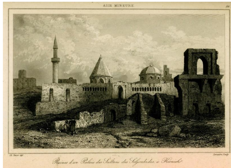
Resim 1: 1882’de basılan gravürde önde Alaeddin Köşkü kalıntıları, arkada Alaeddin Camii (C. Texier, Küçük Asya , c. III, s. 307).

Burada daha önceki tarihçiler tarafından dile getirilen, Selçukluların Osmanlı elitlerinin bilincine kutsiyet kanalı üzerinden dâhil olduğu önermesi 183 somut bir görünüm kazanır. Charles Texier’in bir gravürü ( Resim 1 ) bu bakış açısını daha berrak görmemize yardımcı olur. Siyasi anıt-yapılar bir süre sonra kaderine terk edilirken dinî anlamı olan vakıflar 184 ve ibadethaneler korunmuş, onarılmış, çalıştırılmış, süregelen hak sahiplikleri de teslim edilmiştir; yapıların üzerine minare, duvarına kitabe eklenmiştir.