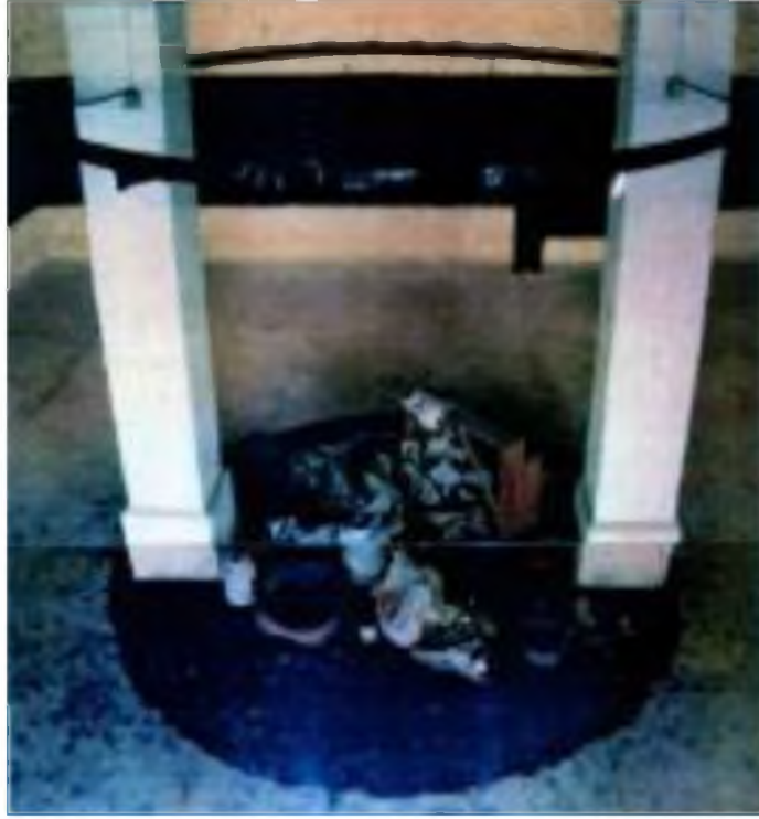
Görüntü 26: Cebrail Ötün, Öteki , 1996, enstalasyon görüntüsü.

Ötün sergi mekanının kapı ve pencerelerini kapatarak iki gün boyunca işlerini oluşturmuştur. Sürecin kavramsal alt yapısında mekanın, zamanın ve içe dönük bir bilincin yapısal ilişkileri yer alır. Sergi mekanındaki ışıklandırma elemanlarını müdahale ederek boyaması ve kullanım eşyalarını da mekana dahil ederek yerleştirmesi kutsal bir alanın yaratılmasına işaret eder. Sergi tamamlanan, oluşturulan ve gösterilmek istenenle gösterilmeyenin çelişkilerini barındırmaktadır. Bu çelişkilerde soyutlanan ve öteki konumuna dönüşen sanatçının kendisidir.