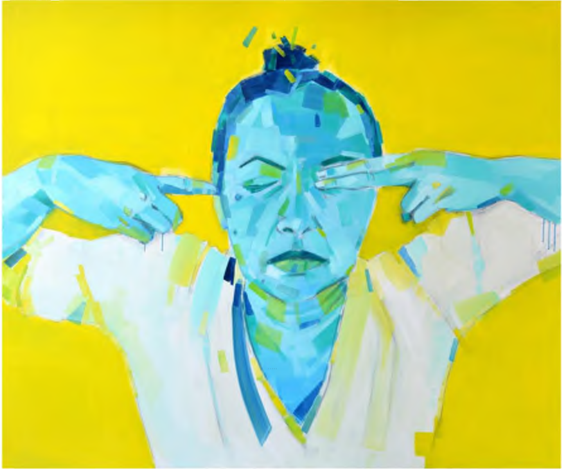
Görüntü 31: Evrim Özeskici, Ben de Görmem Duymam Konuşmam , 2015, tuval üzerine yağlıboya, 100x120 cm.

Örneğin; “Ben de Görmem Duymam Konuşmam” adlı çalışma öteki sorunsalı üzerinden toplumun duyarsızlaşmasına ve tepkisizleşmesine yapılan bir eleştiridir. Resimdeki karakter ifadenin merkezindedir. Sağ eliyle kulağını sol eliyle ise bir gözünü kapatmıştır. Ağız ve diğer gözü de kapalı olan kişinin tüm duyu organları işlevini yitirmiştir. Arka plandaki rengin şiddeti hastalıklı ve değişime uğramış bir kişiliğin belirtisidir. Figürün bedeni yapıbozuma uğramıştır.