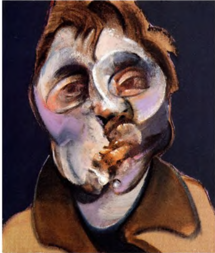
Görüntü 10: Francis Bacon, Oto Portre , 1969, tuval üzerine yağlıboya.

Francis Bacon eserlerinde beden olgusuna ve varlığın sorgulanmasına yönelik düşünceleri öne çıkmaktadır. Dolayısıyla egzistansiyalist bir yaklaşımı vardır. Bu felsefenin çıkış noktası olan “varoluş özden önce gelir” düşüncesi bireyselliğin, bağımsızlığın ve kişiliğin varoluşu oluşturduğunu doğrular. Varlık kavramı bireyle bütünleştiğinden ötürü diğer tüm şeyler kişinin kendisine göre “o”yu oluşturur. Bu da ötekinin varlığına işaret eder. Örneğin Bacon’un oto portrelerinde ve Papa serilerinde öteki kavramı dikkat çekicidir.