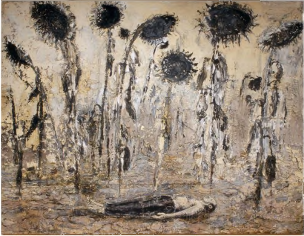
Görüntü 13: Anselm Kiefer, Gecenin Siparişleri , 1996, tuval üzerine karışık Teknik, 356 x 463 cm.

Anselm Kiefer'in "Gecenin Siparişleri" adlı eseri öteki üzerine önemli veriler sunmaktadır. Çorak bir arazide yanmış ayçiçekleri başlarını eğmiş yerde yatan kişiye bakmaktadırlar. Bu figür sanatçının kendisidir. Sanatçı burada öyle görünüyor ki Auschwitz'deki toplama kampında yakılan insanlara bir gönderme yapmıştır.