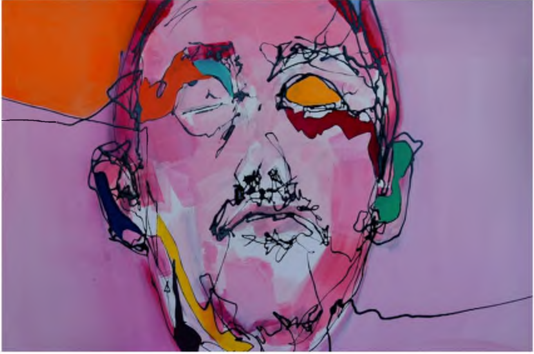
Görüntü 36: Evrim Özeskici, Zıt Kutuplar-II , 2015, tuval üzerine karışık teknik, 40x60 cm.