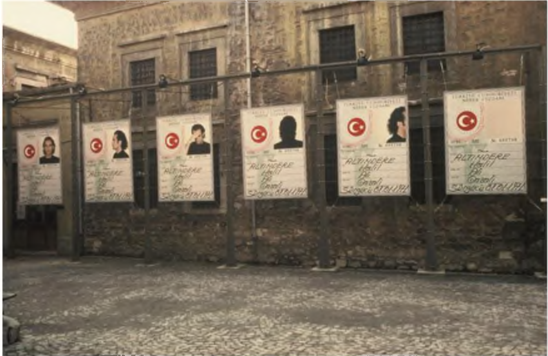
Görüntü 22: Halil Altındere, Tabularla Dans II , 1997, 6 kimlik, değişebilir boyut, enstalasyon görüntüsü (5. İstanbul Bienali)

1997 yılında düzenlenen “5. Uluslararası İstanbul Bienali”nin “Yaşam, Güzellik, Çeviriler / Aktarımlar ve Diğer Güçlükler Üstüne” adlı konseptin öteki, kimlik, cinsel kimlik ve politik aktarımlar üzerine inşaa edilmesi önemlidir.