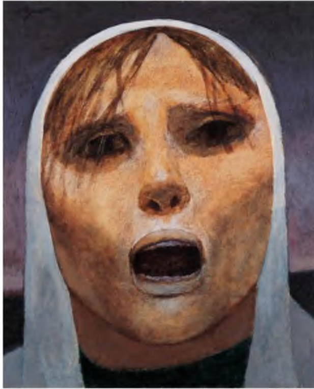
Görüntü 16: Nuri İyem, Ağıt , 1986, tuval üzerine yağlıboya, 54x65 cm.

1950 sonrası Türk resim sanatımızda toplumsal konuların ele alınıp eleştirel bir kimlik kazanması önemli bir gelişmedir. Nuri İyem'in 1960 ve sonrasında yaptığı figüratif resimleri Anadolu insanlarını Türk sanatında toplumcu gerçekçi ifade etmiştir.