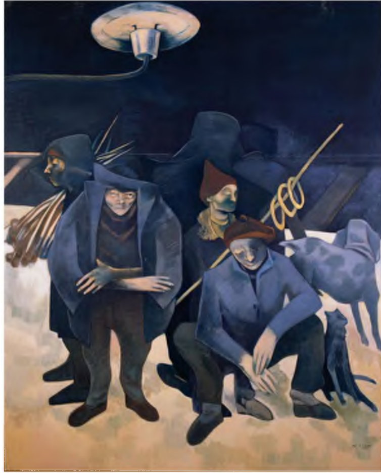
Görüntü 19: Neşe Erdok, Kızıltoprak İstasyonu , 1981, tuval üzerine yağlıboya, 100x160 cm.

Neşe Erdok ise resimlerinde kimlik sorunsalı ve bireylerin psikolijilerini irdelemektedir. Erdok resimlerinde günlük yaşamdan kesitler sunar ve karakterlerin bedenlerini yapıbozuma uğratar. Yapıtlarında hastalar, yoksullar, dilenciler, çocuklar toplumun ötekisidir. Sanatçı, figürlerin ruhsal çözümlemesini yaparak onları kimlik değişimine uğratar. Bu yüzden hastalıklı, bunalımlı ve çaresiz insanların ekspresif anlatımı konularının en belirgin özelliğidir. “Kızıltoprak İstasyonu”, “Soma”, “Disiplin ve Ceza” ve “Selpakçı Kız” adlı resimlerinde toplumun alt kesimlerini ele alır ve öteki kavramına dikkat çeker.