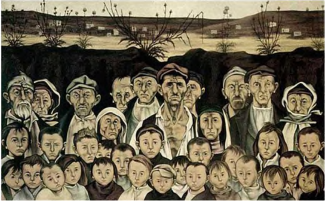
Görüntü 18: Neşet Günel, Duvar Dibi 3 , 1973, tuval üzerine yağlıboya, 153x245 cm.

Neşet Günel'in hemen hemen tüm resimlerinde dışavurumcu biçim ve ifadeci üslup vardır. Neşet Günel "Yeniler Grubu"nun ortak tavrı olan toplumcu gerçekçi sanat anlayışından etkilenmiştir. "Yeniler Grubu"nun toplumu ele alarak halka tanıtması, yoksul yaşam kesitlerine ve ezilenlere yer vermesi Neşat Günel'in de ortak sorunudur. "Duvar Dibi" serilerindeki ötekiler; köylülerdir. Resimlerindeki karakterlerin baş, el ve ayaklarında yapılan deformasyonlar bilinçli olarak yapılmıştır. Günel'in "Duvar Dibi" serileri ezilen, emek veren yoksul insanların toplumda var olma savaşını göstermektedir. Renklerin kahve, gri ve sarı tonda yapılması toprak işçilerinin içinde bulunduğu gerçekleri ifade eder. Resimde toplumun bir ötekisi olarak insanların yüzleri donuk, ifadesiz ve karanlıktır.