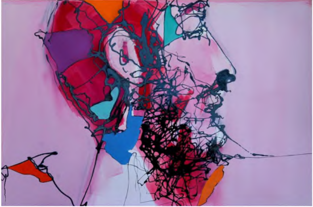
Görüntü 37: Evrim Özescici, Zıt Kutuplar-III , 2015, tuval üzerine karışık teknik, 40x60 cm.