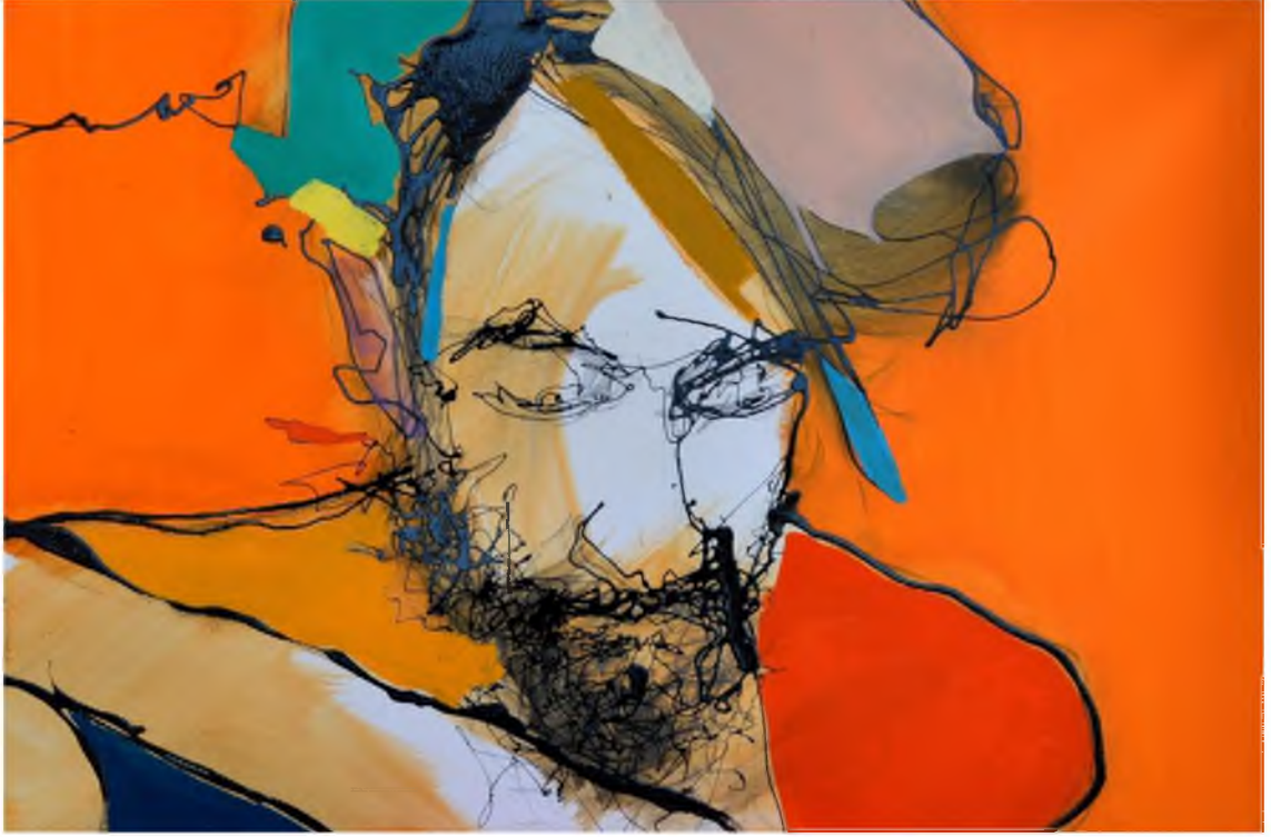
Görüntü 39: Evrim Özeskici, İsimsiz-II , 2015, tuval üzerine karışık teknik, 40x60 cm.