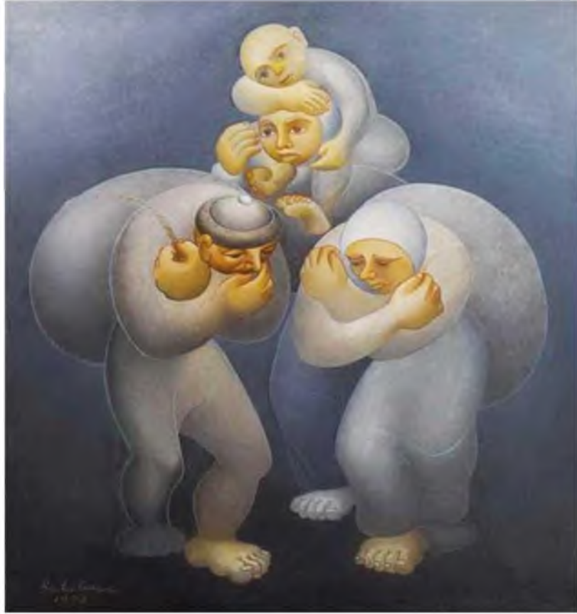
Görüntü 17: İbrahim Balaban, Mavili Göç , 1972, tuval üzerine yağlıboya, 85x90 cm.

Göç konusuna değinen toplumun öteki ve kimlik sorunlarını ele alan bir başka sanatçı İbrahim Balaban'dır. Anadolu'nun zorlu yaşam koşullarını ve göçün insan üzerindeki travmasını konu edinir. Resimlerindeki formlar Anadolu medeniyetinin tarihsel kimliğinden esinlendiğini gösterir. Yapıtlarında Anadolu insanının naif biçimsel tasvirleri Sümer ve Hitit heykellerinin kaba biçim ve form anlayışından etkilendiğine işaret eder. Balaban "Buradakiler", "Göçte Konaklayanlar" ve "Mavili Göç" adlı eserleriyle köy yaşamını ve insanların yoksulluklarını toplumun gerçekleri olarak ele almış ve toplumun ötekisi olarak resmetmiştir.