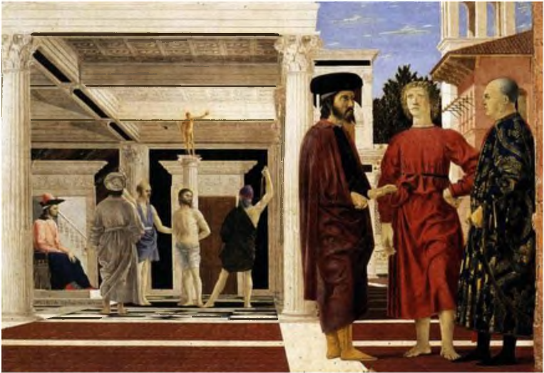
Görüntü 4: Piero della Francesca, İsa'nın Kırbaçlanması , 1465, tempera, 58,4x81,5 cm.

Rönesans resminin kurucusu olan Masaccio'nun 1427 dolaylarında yapmış olduğu "Kutsal Teslis" adlı eserindeki İsa figürü geniş bir perspektiften izleyiciye yücelik duygusunu hissettirmiştir. Kilisenin içerisindeki freskin geniş spektrumlu açısı sayesinde bir başka mekana geçişin hissini ve aynı zamanda resmin gerçekçiliği sayesinde de bedene yapılan işkencenin acısını duyumsatmıştır. Resimde dışlanan ve ötelenen figür İsa'dır. Bu sayede Hristiyanlığın temel figürü olan İsa'ya dinsel ve tarihsel bir önem atfedilmiştir.