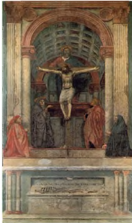
Görüntü 3: Masaccio, Kutsal Teslis , 1427, fresk, 667 X 317 cm.

Tarihsel olarak “öteki” kavramına ilişkin örnekler Rönesans’tan günümüze kadar devam etmektedir. Rönesans döneminde öteki’ne ait işaretler (eserlerde) dinsel içeriklidir. Rönesans eserlerinin çoğunda işlenen konularda şiddet, melankoli, işkence ve acı gibi duyguların baskın olması dönemin karakteristik yapısından kaynaklanmaktadır. Rönesans döneminde bir kavram olarak incelenen “öteki”nin dini, ahlaki ve kutsal bir boyutu vardır. Ancak bu dönemin sanatçılarının öteki’yi bir kavram olarak incelediklerini düşünmek pek doğru olmayacaktır.