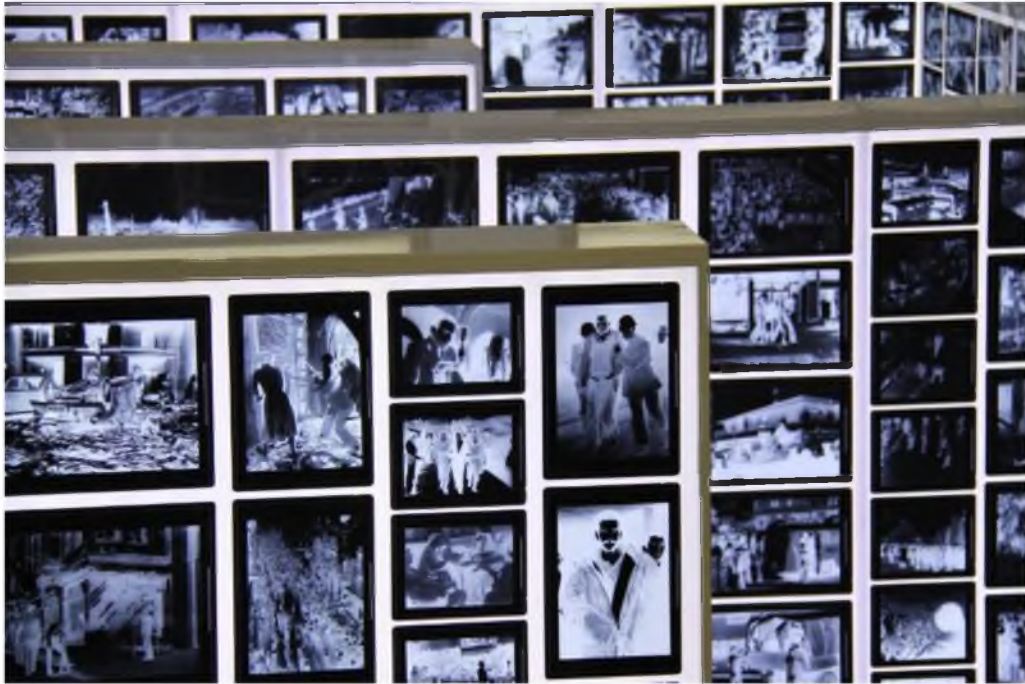
Görüntü 23: Hale Tenger, Böyle Tanıdıklarım Var III , 2013, röntgen filmlerine kuru lazer baskı pleksi levhalar, enstalasyon görüntüsü

Sivas katliamında yaşananları unutturmamak için 35 sanatçı biraraya gelerek 2013 yılında açılan “Unutmamak” adlı sergi, ötekiyi ve ötekileştirilen insanları bugüne taşır. Bu serginin önemi; toplum üzerinde kimlik, öteki ve bellek kavramları açığa çıkarılarak toplumsal bir bilinç oluşturmaktır. Mehmet Güteryüz, Komet, Süleyman Saim Tekcan, Adnan Çoker, Halil Akdeniz, Mustafa Ata ve Ara Güler gibi sanatçıların eserlerini yakması topluma yönelik bir sorumluluk bilincidir. Aynı zamanda bu sergi ile toplum üzerinde bir farkındalığa dönüştürülmek istenmiştir.