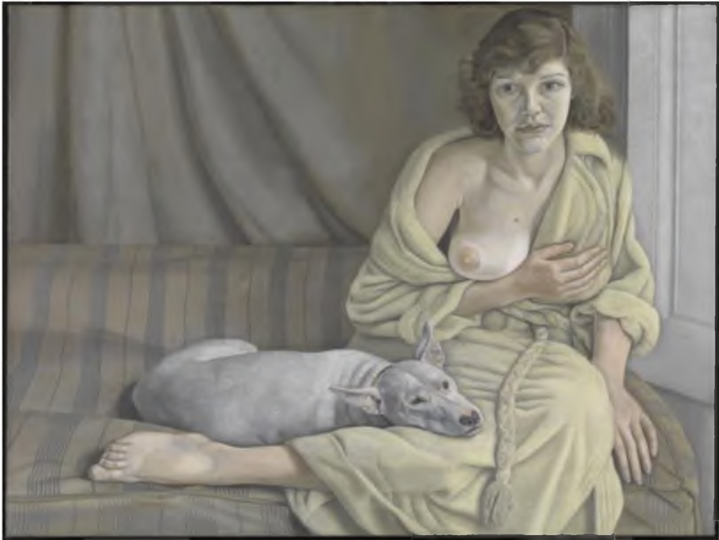
Görüntü 15: Lucian Freud, Beyaz Bir Köpeğiyle Kız , 1950-1, tuval üzerine yağılıboya, 76,2x101,6 cm.

Sanatçı ötekinin fizyolojik yapısına dikkat çekmiş ve toplumda dışlanan konumunu abartılı bir deformasyonla ortaya çıkarmıştır.