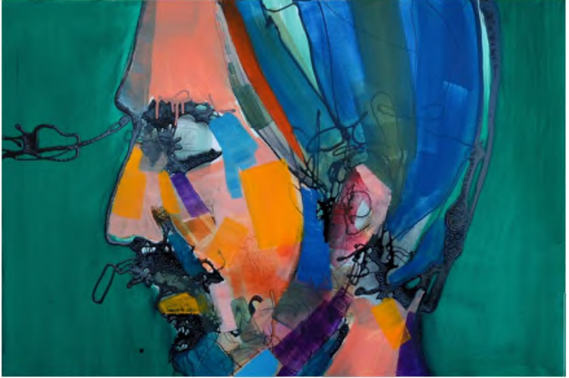
Görüntü 42: Evrim Özeskici, İsimsiz-V , 2015, tuval üzerine karışık teknik, 40x60 cm.