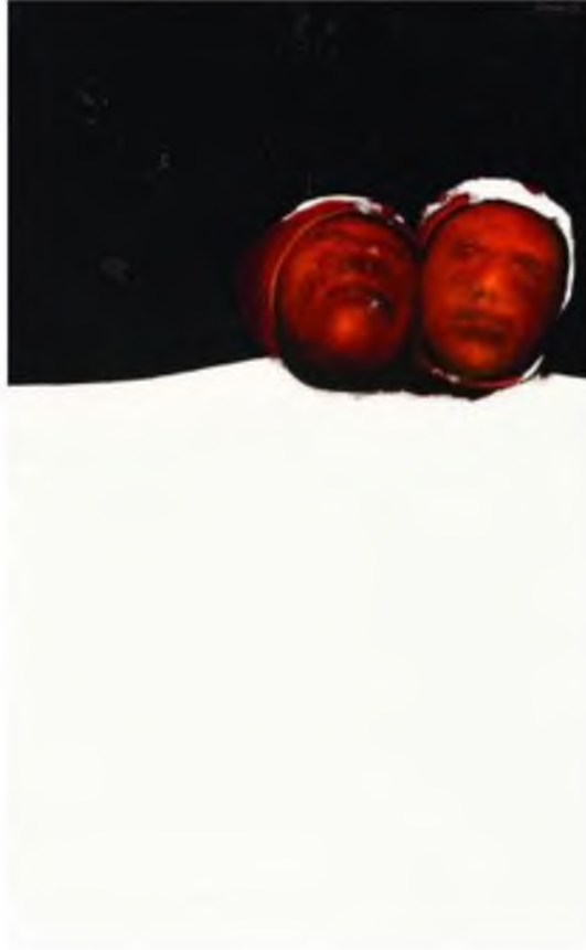
Görüntü 21: Ömer Kaleşi, Balkan Dramı V , 1993, tuval üzerine yağlıboya, 81x130 cm.

durumu aşmanın tek yolu ise; “öteki” önyargısını yok sayabilecek denli insana sahip oldu” 1