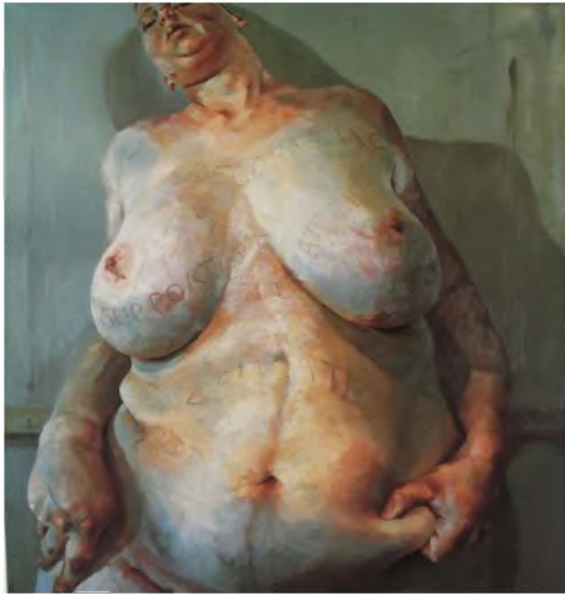
Görüntü 14: Jenny Saville, Markalanmış , 1992, tuval üzerine yağlıboya.

Bir başka örnek Jenny Saville üzerinden verilebilir. Sanatçıyı diğerlerinden ayıran şey bedenin yapıbozumudur. Kimlik ve öteki üzerine sorunsal yaklaşımıdır. Pornografik görüntüler ile bedenin kimlik sorunsalını irdeler. 1999 yılında gerçekleştirdiği “Matrix” adlı eseri öteki üzerine görsel çözümler sunar. Beden kadına, yüz ise erkeğe aittir. Aynı şekilde 2004 yılına tarihlenen “Geçiş”te de buna benzer sorgulamalar vardır. Sanatçının kendisiyle erkek bedeni arasındaki geçişi yansıtmıştır. Tüm bunlar toplumun öteki olarak nitelendirdiği karakterlerdir. Kanımca Saville, bedenleri yapıbozuma uğratarak farklı kimliklerin bir aradalığına vurgu yapmak istemiştir. Bu durum öteki ve ötekileştirmeye karşı toplumsal eşitliği savunmuş olabileceğine dair önemli ip uçları vermektedir.