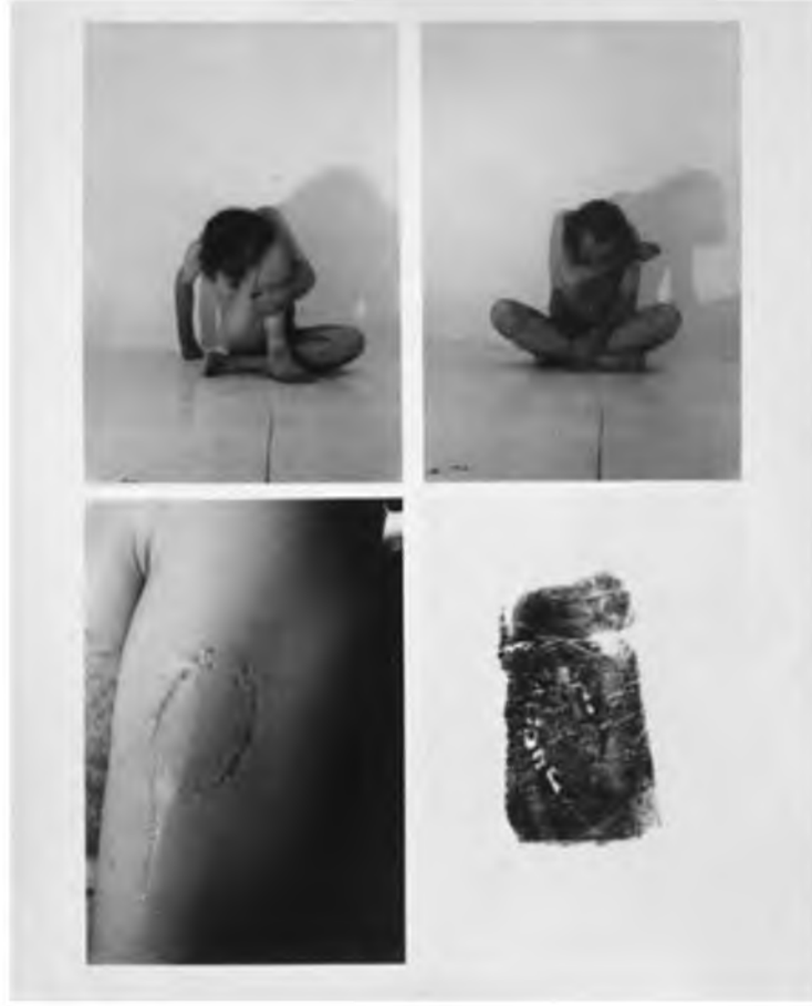
Görüntü 1: Vito Acconci, Tescilli Markalar , 1970, performans.