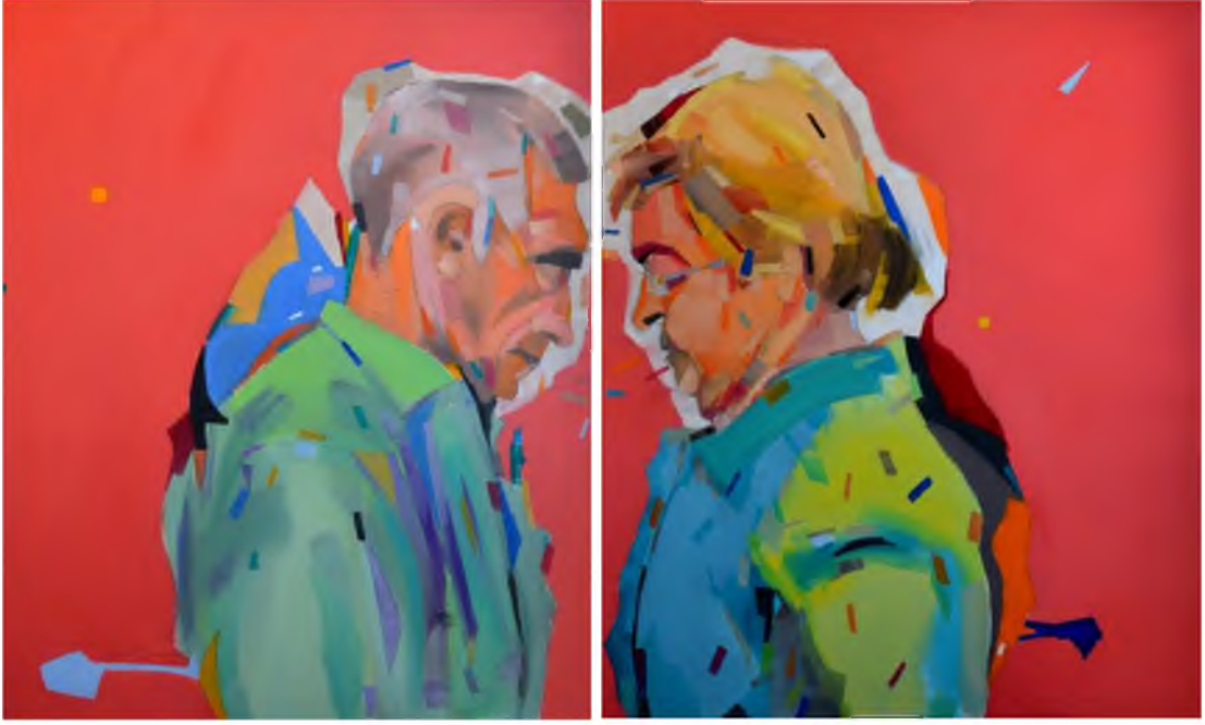
Görüntü 44: Evrim Özescici, Kapalı Diyalog , 2016, tuval üzerine yağlıboya, 120x200 cm.