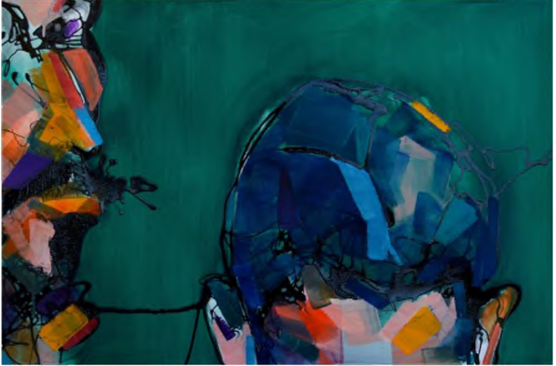
Görüntü 41: Evrim Özeskici, İsimsiz-IV , 2015, tuval üzerine karışık teknik, 40x60 cm.