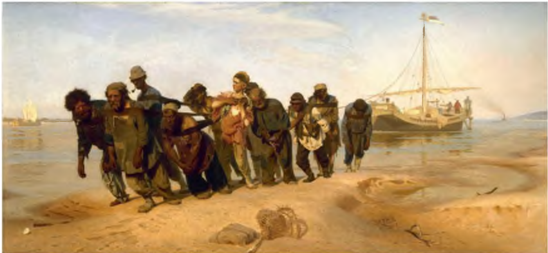
Görüntü 7: İlya Efimoviç Repin, Volga'da Sal Çekicileri , 1870-73, tuval üzerine yağlıboya, 131.5 x 281 cm.

Realist sanatçılara gelindiğinde ise toprak işçileri, emekçiler, köylü manzaraları, toplumun ezilen ve ötelenen yanları önemlidir. Gerek Romantikler gerekse Realistlerin ortak yanı yüceleştirmeden çok toplumsal olaylara yer vermeleridir. Bu duruma sebep olan en büyük etkenin Sanayi Devrimi olduğu açıktır. Resimlerde ötekine ilişkin göstergelerin devrimden sonraki süreçte baskın olduğu görülmektedir. Yırtık gömlekler, yamalı pantolonlar, zor hayat koşulları halkın mücadelesini göstermektedir. Bunlar sanatta uzun yıllar ele alınmayan konulardır. Sanat dönüşüme uğramıştır. Sanat ve hayat arasındaki buzlar erimeye başlamıştır. Günlük sıradan konuların resme yansınmasıyla birlikte resimde büyük bir değişim olmuştur. Teşhir etme ve kimliğin sahnelenmesi gündeme gelmiştir. Tek başına ben'in iktidarı değil mücadelenin, özgürlüğün ve işçilerin de durumu tartışılmıştır. Bu nedenle iki farklı kutbun mücadelesiyle sürekli karşılaşmıştır. Bunlar öteki(ler) ve diğerleri ya da zengin ve fakirlerdir.