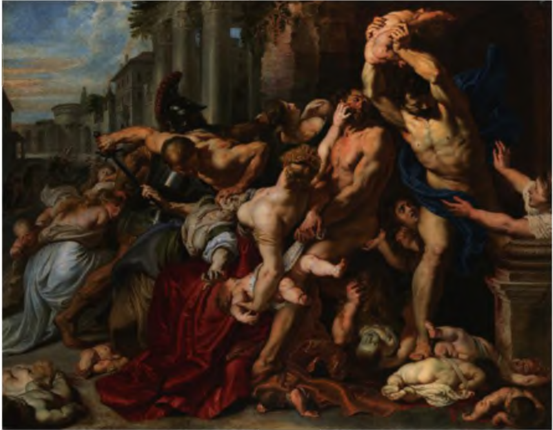
Görüntü 6: Peter Paul Rubens, Masumların Katli , 1611-1612, ahşap panel üzerine yağlıboya, 142 x 182 cm.

Rönesans'ta öne çıkan dinsel içerik, ölüm, şiddet ve İsa betimlemeleri Barok Dönemi'nde de devam etmektedir. Caravaggio'nun "Hz. İsa ve Dikenli Taç" adlı eseri İsa'nın çilesi ve yaşadığı şiddet karşısındaki acısını dile getirir. İsa tüm olanlar karşısında yaşayacaklarına boyun eğerek acısını yaşamaktadır. Sağdaki iki figür sol taraftaki askerin emri karşısında İsa'ya dikenli tacı giydirmektedir. Bu bağlamda eserin gücü ifadenin gerçekliğinden kaynaklanmaktadır. Resimdeki figürler işkenceyi yapanlardır. Bunlar ben(ler) kavramıyla ilişkilendirilebilir. İsa ise ötekidir.