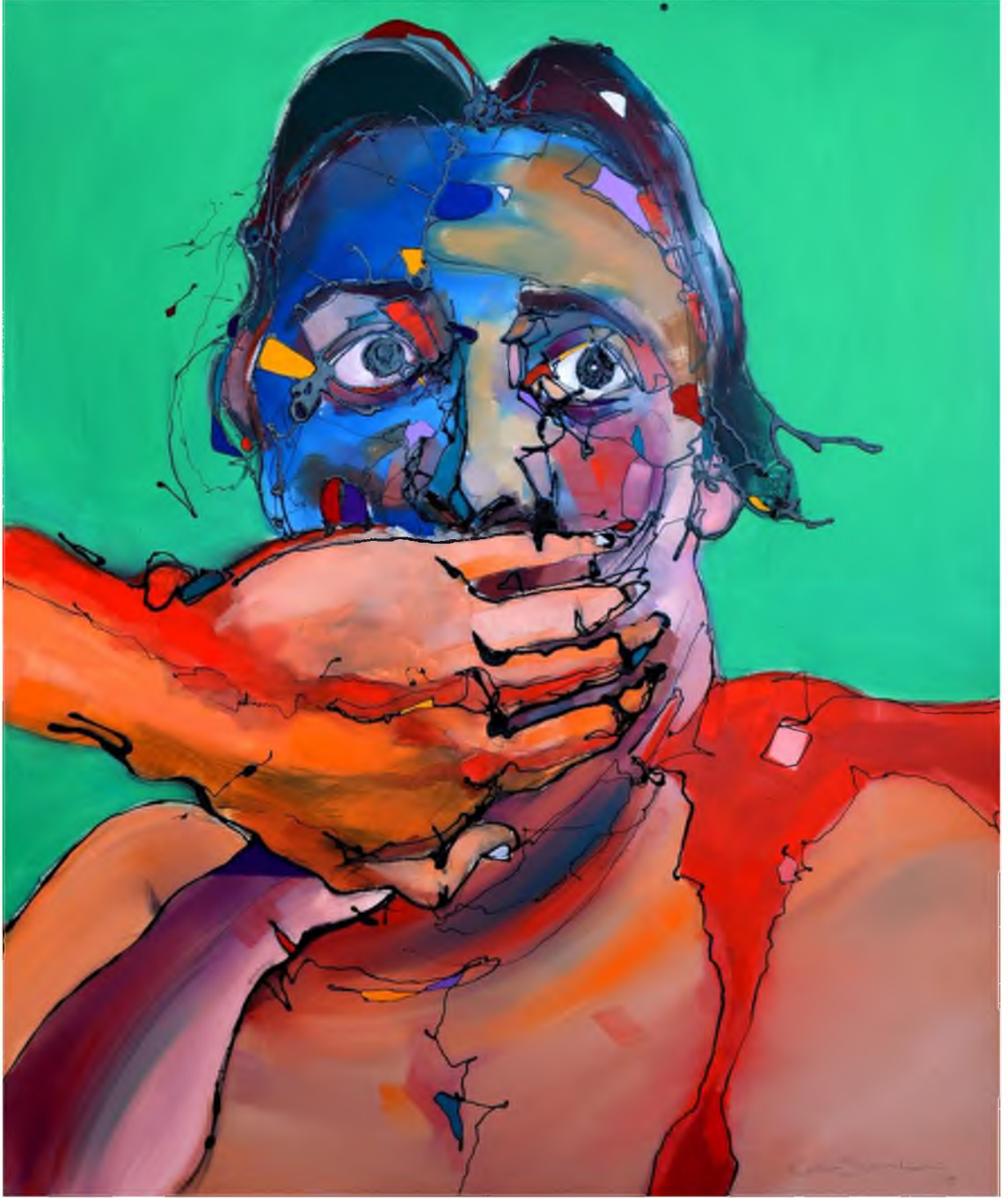
Görüntü 43: Evrim Özskici, Bilinçli Müdahale , 2016, tuval üzerine yağlıboya, 120x100 cm.