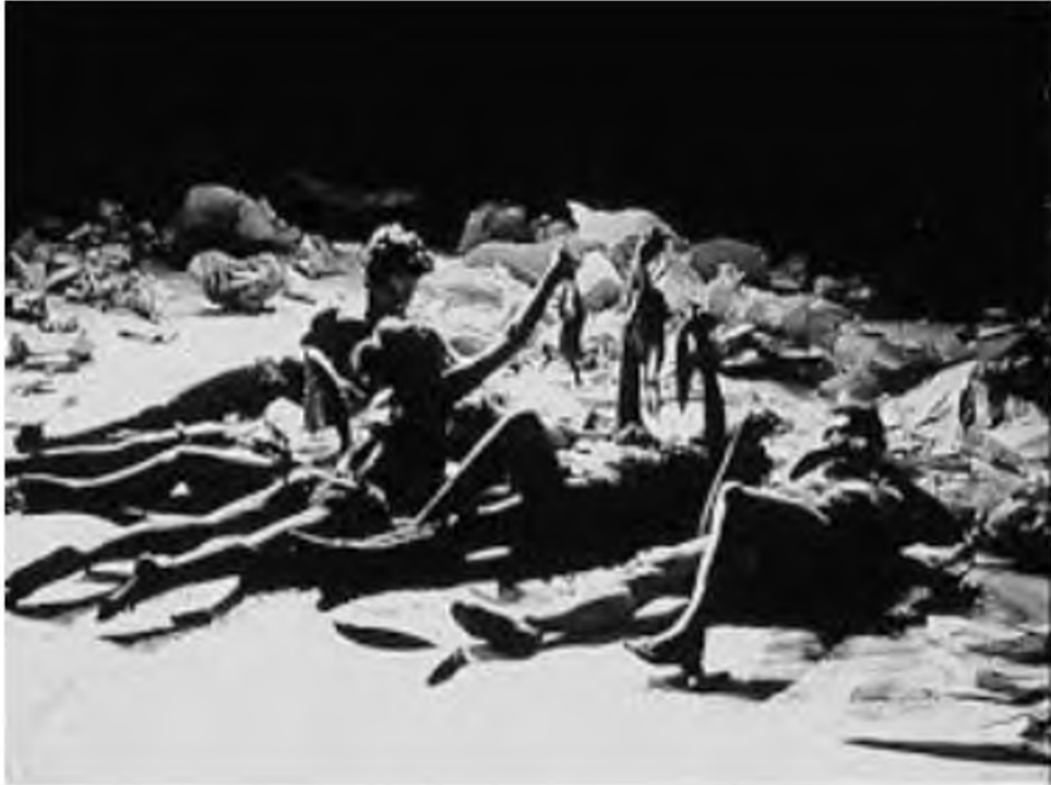
Görüntü 2: Carolee Schneemann, Et Şenliği , 1964, performans.

Gerçek olan bedenin içinde kapitalist ekonomiye yönelik bir eleştiri yüklenmiştir. Sanatçı salt çıplaklık imgesinden yola çıkarak acıyı deneyimlemiştir. Bu performansın öteki algısı, insanların sürü içgidüsü içerisinde sürekli tüketime odaklanmasıdır. İnsanlığın tek tip, monoton ve yalnızlık içerisindeki bir düzene ayak uydurduğuna da işaret etmektedir. Sanatçının “benliği” üzerinden tüm insanlığa verilen kitlesel bir mesajdır.