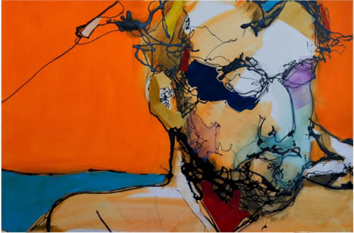
Görüntü 38: Evrim Özeskici, İsimsiz-I , 2015, tuval üzerine karışık teknik, 40x60 cm.