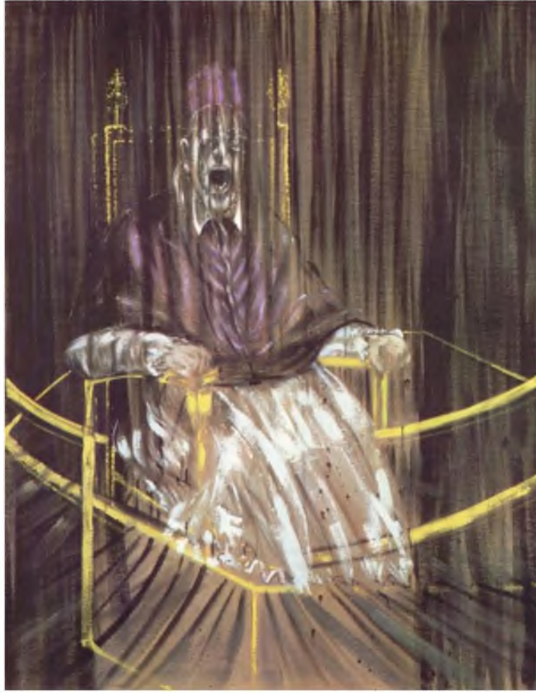
Görüntü 11: Francis Bacon, Velazquez'in X. Innocentius'un Portresi'nin Ardından Çalışma , 1953, tuval üzerine yağlıboya, 153 cm × 118 cm.

Çoğu kez öteki ve ötekileştirme birbirine karışabilmektedir. Öteki kavramı bireyin kendisinden kaynaklanmayıp ben(ler) tarafından yapılan bir müdahaledir. Ötekileştirmedeki eylem bölmeye, ırkçılığa, dışlamaya ve özdeğerliliğini başkasını kötümeye yöneliktir. Öteki kavramında değiştirme, eleştiri, karşılaştırmanın biraradılığı ve karşılaştırma vardır. Dolayısıyla bu kavram Postmodernizmin kapılarını aralamaktadır. Kanımca Post modernizmin sanatta arayacağı yeni bir kavram öteki'nin sorgulanması üzerine olmalıdır. Bacon'un Papa serilerinde bir eleştiri, dönüşüm, yorumlama ve iki aynı karakterin karşılaştırması olduğu için öteki'dir.