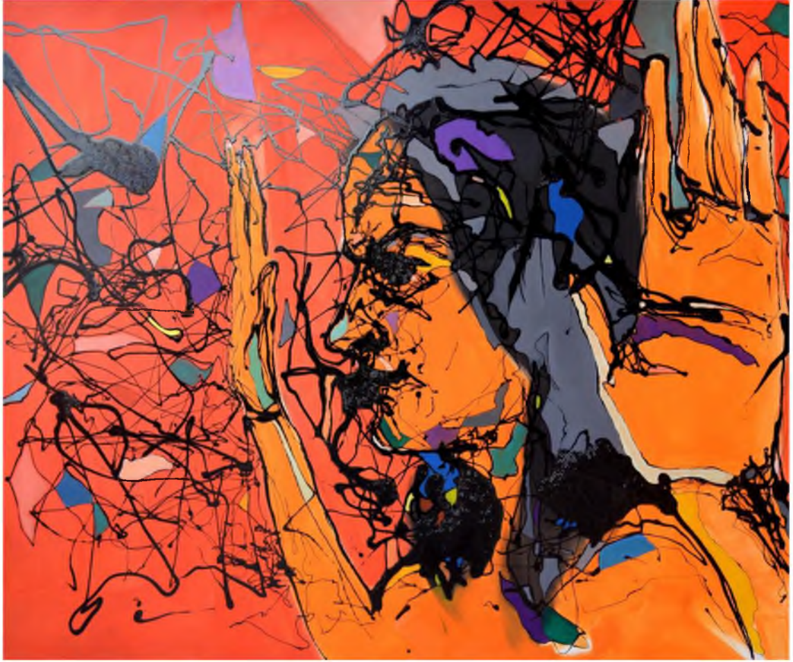
Görüntü 47: Evrim Özeskici, Teslimiyet , 2014, tuval üzerine karışık teknik, 100x120 cm.

“Bilinçli Müdahale”, “Yitik”, “Teslimiyet”, “İsimsiz” ve “Kapalı Diyalog” adlı çalışmalar benzer kavramlar doğrultusunda yapılmıştır. Bu çalışmalarda modern kadın imgesinin feminist bir aktarımı söz konudur. Çalışmaların kavramsal alt yapısında epistemolojik bir yaklaşımın varlığı sezilmektedir. Felsefi düzlemde bilginin sorgulanmasıyla birlikte toplumsal problemler ortaya çıkaracaktır. Kadının toplumdaki yeri-önemi, temsil sorunu, egemen güç, cinsiyet, ve ona yüklenen roller bu kapsamda değerlendirilmesi gerekenlerdir.