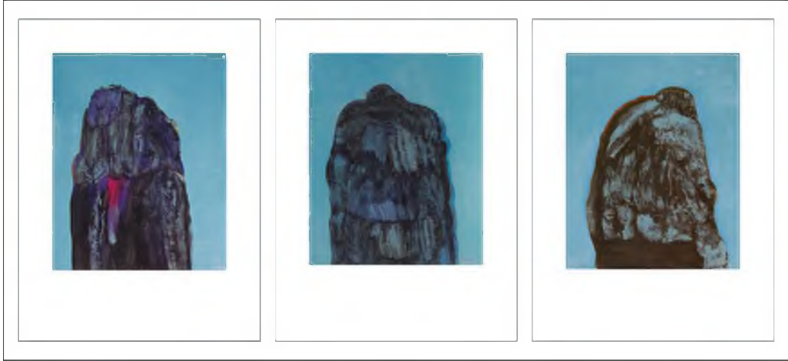
Görüntü 20: Bilge Alkor, İdentikit Caliban , 1995, tuval üzerine yağlıboya, 160x590 cm.

temaların siyasal dozu gittikçe belirginleşmiş; kültürel, siyasal ve cinsel kimlik, etnisite ve ulusallık çelişkisi, adalet, iktidar, tarihin yapıbozumu, modernlik ve postmodernlik, medya, mekan, göç, melezlik, ötekilik, bellek ve daha birçok konu sorunsallaştırılmıştır (Yılmaz, 2015, 195).