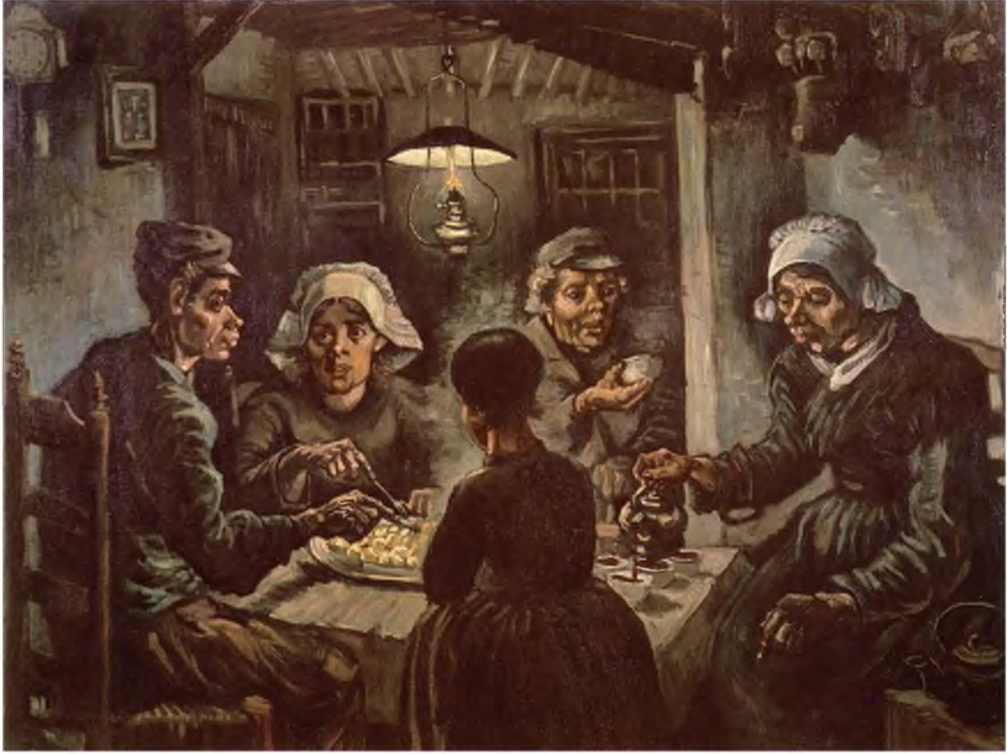
Görüntü 8: Vincent Willem van Gogh, Patates Yiyenler , 1885, tuval üzerine yağlıboya, 82 x 114 cm.

Van Gogh'un "Patates Yiyenler" isimli eseri toplumun gerçeklerini dile getiren hüzünlü bir atmosfer çizmektedir. Maden işçilerini konu alan eserde sefalet ve iç çöküş vardır. Van Gogh sıradan bir olayı izleyiciye bilinçli olarak göstererek farkındalık yaratmak istemiştir. Ötekiler maden işçileridir. Toplumun ayrıcalıklı sınıflarından değildirler. Ezilenlerdir. Yüz ve ellerdeki biçimler ile resmin karanlık atmosferi ekspresiftir. Patates yiyeceği resimde önemli bir işarettir. İşçilerin ve köylülerin yiyebileceği bir besindir. Savaşlar ve devam eden kıtlıklar sırasında daima toplumun ihtiyaç duyduğu bir sebze olmuştur. Patatesin yüzyıllardır tarih sahnesinde toplumsal bir işlevi olduğuna göre bu yönüyle "öteki"nin varlığına da işaret edebilir. Bu bağlamda nesne/patates üzerinden bir ilişki kurularak öteki olgusuna bir göndermede bulunulduğu söylenebilir.