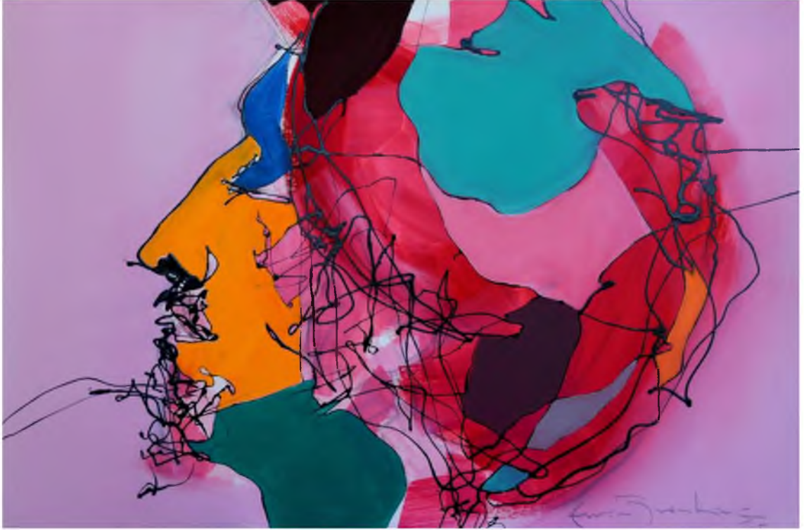
Görüntü 35: Evrim Özescici, Zıt Kutuplar-I , 2015, tuval üzerine karışık teknik, 40x60 cm.