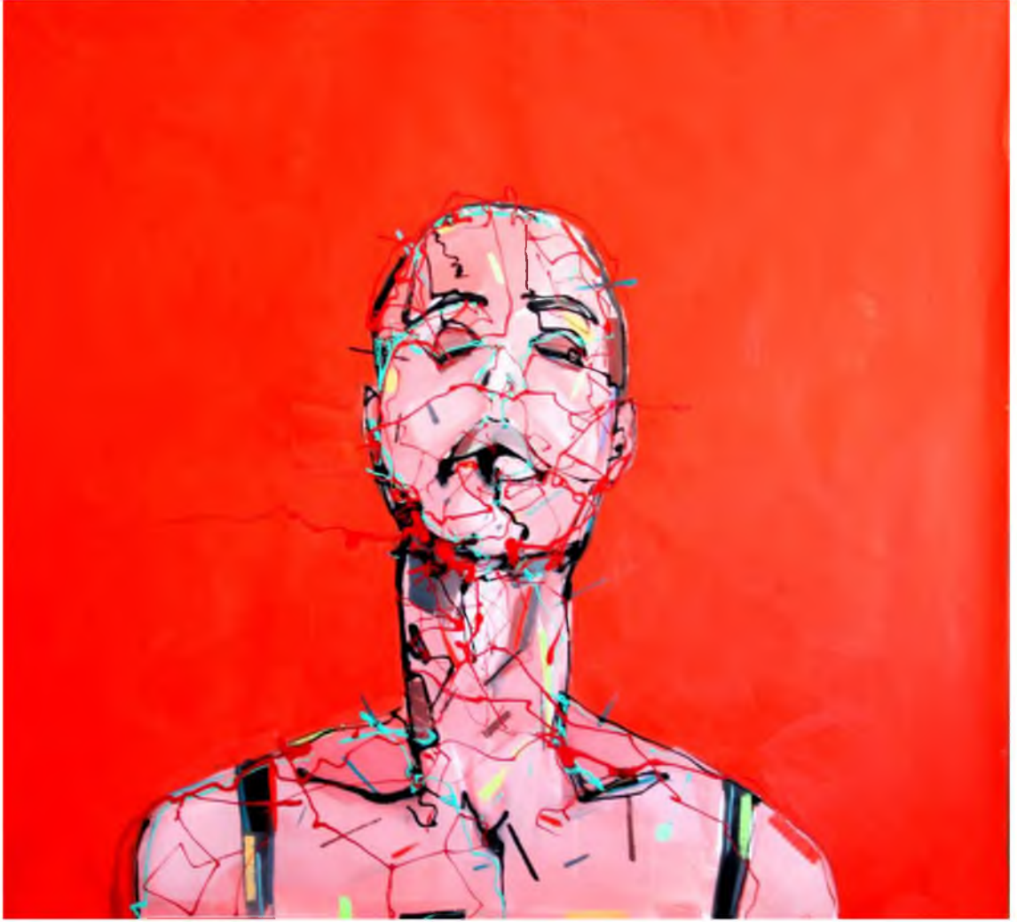
Görüntü 28: Evrim Özeskici, Öteki , 2016, tuval üzerine yağlıboya, 100x100 cm.