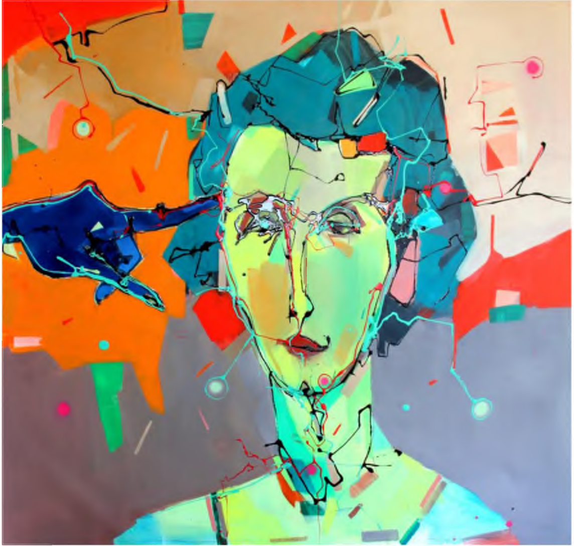
Görüntü 29: Evrim Özescici, Kimlik Kaybı , 2016, tuval üzerine yağlıboya, 100x100 cm.

Fotoğraftaki kişilerin kimliği rol değişimine uğrayarak tüm toplumu ele alan bir sorunsala dönüşmüştür. Bu bağlamda resimlerdeki figürler üzerinden ifadenin okunması başkadır. Öteki serilerim her türlü ayrımcılığa, bölmeye, ayrıştırmaya ve ırkçılığa karşı olarak gelişmiştir. İçerik ve bağlam olarak ötekiyi resimlerimde ele almamın en önemli sebebi toplumun eleştirisidir. Alımlayıcının zihninde öteki ve ötekileştirmenin toplum üzerindeki travmatik etkisini hissettirmek resimlerimde bir arayış olarak devam edecektir.