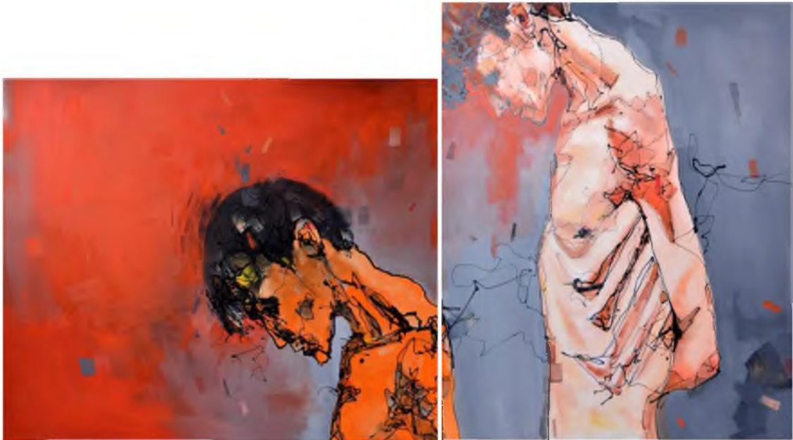
Görüntü 48: Evrim Özescici, Öteki Ben , 2015, tuval üzerine karışık teknik, 120x220 cm.

Tüm bu sorgulamalar beden, kimlik ve cinsiyet üzerinden ötekiyi yaratır. Çalışmaların temelinde yatan sorunsal, egemen erkek gücün kadın(lar)a yönelik bilinçli yapılan müdahalesidir. Toplumun zamanla bu durumu kanıksamasına ve duyursuzluğuna bir göndermedir. Eşitliğe ve toplumsal adalete duyulan bir özlem vardır. Kavramsal olarak iki farklı beden in eşitsizliği ve dengesizliği sorgulanmaktadır. Buradaki kadın bedenleri tüm kadınlara yönelik toplumsal bir bilinç oluşturarak fikir ve kavramlara dönüşmüştür.