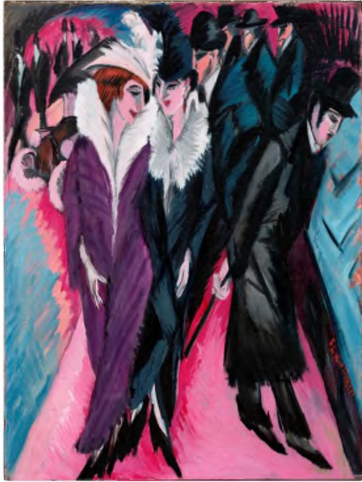
Görüntü 9: Ernst Ludwig Kirchner, Berlin Sokağı , 1913, tuval üzerine yağlıboya, 1,21 m x 91 cm.

Örneğin; Kirchner'in 1913'te yaptığı "Berlin Sokağı" adlı eserindeki karakterler Alman burjuva kültürünü yansıtmaktadır. Sanatçının ötekisi, burjuva halkıdır. Bedenleri ve yüzlerdeki ifadeyi bilinçli olarak çarpıtmıştır. Kirchner burjuvayı halktan kopuk bir sınıf olarak tanımlar ve toplumsal olayların başkahramanları olarak değerlendirir. Onları çirkinleştirmiş ve çoğu kez de gözlerini karanlık ve çukur yapmıştır. Bu yüzden kimlikleri okunamamaktadır. Dolayısıyla savaş öncesi ve sonrasında "Berlin Sokağı" serilerinin farklı varyasyonlarını devam ettirmesi tesadüf değildir.