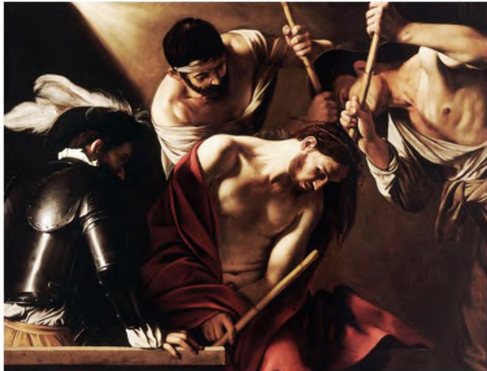
Görüntü 5: Michelangelo Merisi da Caravaggio, Hz. İsa ve Dikenli Taç , 1602, tuval üzerine yağlıboya, 125 x 178 cm.

Bir başka örnek Mathias Grünewald'ın "Çarmıha Gerili İsa" adlı eseridir. İsa bu sahnede çarmıha gerilmiştir. Resmin sağ tarafındaki Vaftizci Yahya'nın eliyle İsa'yı işaret etmesi yine "öteki"nin varlığını kanıtlayan bir durumdur. Çünkü işaret etmek yargılamanın bir diğer ifadesidir. Bir olayı ve varlığı açıklamaktır. İfşa etmektir. Dolayısıyla "özne"nin varlığı "öteki"nin ortaya çıkarılmasıdır.