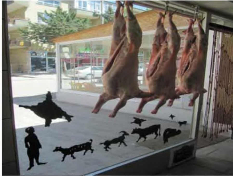
Görüntü 24: Atilla İlkyaz, Asmayalım da Besleyelim mi? , 2012, enstalasyon görüntüsü.

Sanatçı benzer olarak 2013 yılında Arter'deki Haset, Husumet, Rezalet adlı sergiye “Böyle Tanıdıklarım Var III” adlı yerleştirmeye katılarak 90'lardaki tepkisini 2000'li yıllarda da devam ettirmiştir. Fotoğrafların röntgenlerinden oluşturduğu yerleştirmesinde sokak çatışmalarını ve şiddet olaylarını görselleştirmiştir. Böylece Tenger, toplumsal bir eleştiriye ve güncel bir soruna yoğunlaşarak öteki sorununa dikkati çekmiştir.