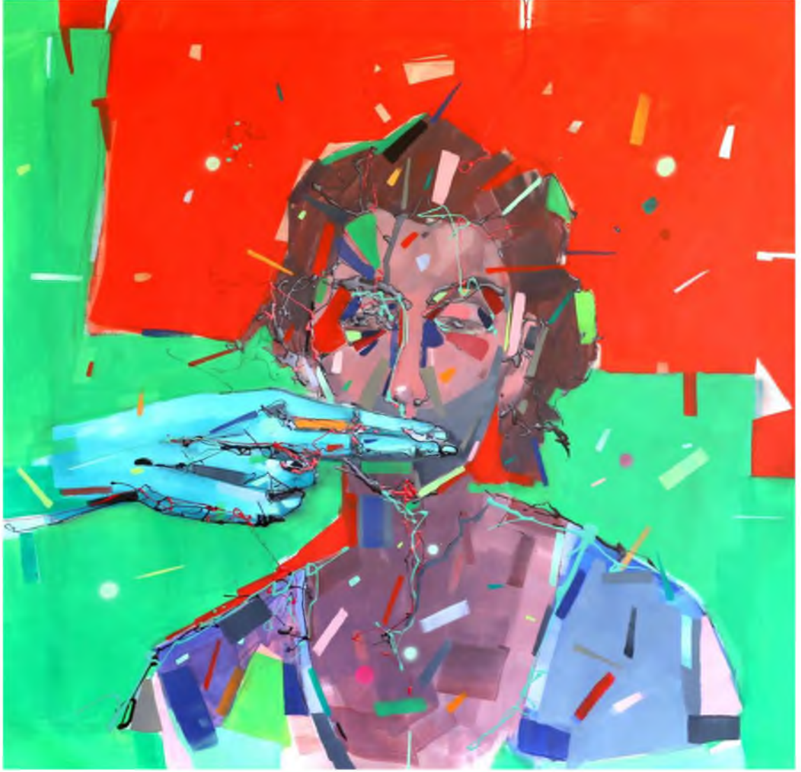
Görüntü 46: Evrim Özescici, Yitik , 2016, tuval üzerine yağlıboya, 100x100 cm.