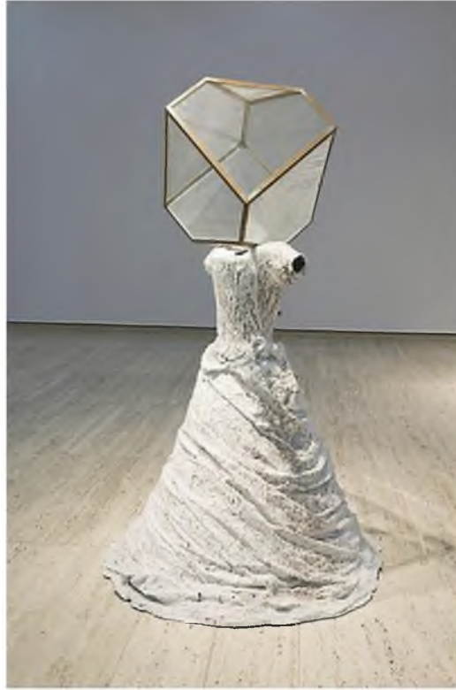
Görüntü 12: Anselm Kiefer, Antik Kadınlar , 2002, heykel, bronz, demir, cam, kül ve kurşun.

Anselm Kiefer'in yapıbozuma uğrattığı kadın bedenleri öteki üzerine önemli dönütler vermektedir. 2002 yılında gerçekleştirdiği "Antik Kadınlar" adlı enstalasyon heykelleriyle ötekileştirilen insanların dramına vurgu yapar. Bronz, demir, cam, kül ve kurşun gibi materyallerle dönüşüme uğrattığı bedenler savaşın tanıklarındır. Bedeni bir ifade alanı olarak ele almaktadır. Çünkü öteki denilen şey varlığın bedeni üzerinde okunabilmektedir.