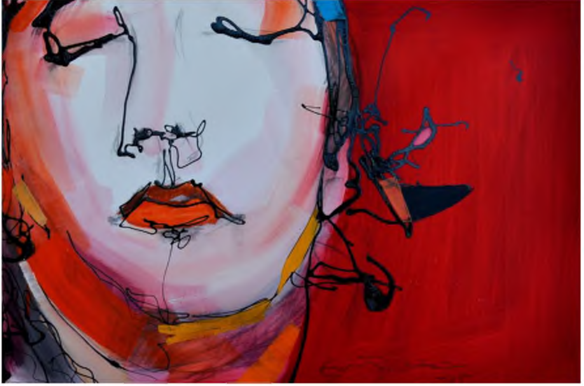
Görüntü 34: Evrim Özskici, Farkındalık-II , 2015, tuval üzerine karışık teknik, 40x60 cm.