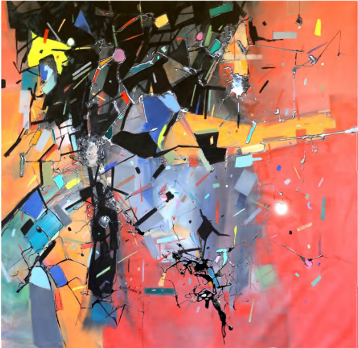
Görüntü 30: Evrim Özescici, Parçalanma , 2016, tuval üzerine karışık teknik, 100x100 cm.

Fotoğraftaki kişiler ve oluşturulan serilerdeki karakterler kendi kimliklerini kaybedip toplumsal duyarsızlık üzerine kitlesel bir eleştiri sunmaktadır. Resimlerde çoğu kez korku, baskı, gerginlik, melankolik ve depresif bir ruh halinin oluşması bu sebeplerden dolayıdır.