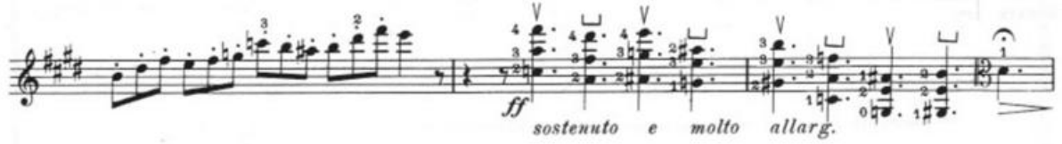
Görsel 54- Maurice Vieux, Vingt Etudes Pour Alto , no.20, 35-37. ölçüler.

Aynı karakter etüdün sonuna kadar devam etmiş ve büyük bir crescendo ile etüdün bitiriş köprüsüne geçilmiştir. Sostenuto e molto allargando belirtilmiş akorlarda geldiği gibi arşe kullanılmış ve son notadaki puandorga kadar fortissimo nüans belirtilmiştir. Puandorgtan sonraki ölçüde tekrar ana tempoya dönülerek yavaşlama olmadan etüt tempoda ve altında con fuoco belirtilmiş bir crescendo ile bitirilmiştir. Bu etüt; müzikalite, pozisyon geçiş, entonasyon, hızlı arşe, aralık ve spiccato çalışmaları için yararlı bir çalışmadır.