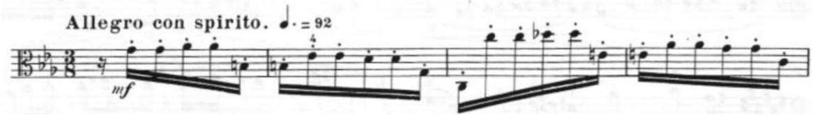
Görsel 48 - Maurice Vieux, Vingt Etudes Pour Alto , no.18, 1-4. ölçüler.

Allegro con spirito olan etüt tek bölmelidir ve do minör tonundadır. Ölçü birimi olarak üç sekizlik, noktalı dörtlüğe doksan iki metronom belirtilmiştir. Bütün olarak bakıldığında on altı numaralı etüt gibi çok hızlı bir temposu vardır, aynı şekilde spiccato ve farklı bağlı arşe grupları kullanılmıştır.