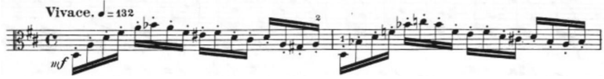
Görsel 44- Maurice Vieux, Vingt Etudes Pour Alto , no.16, 1-2. ölçüler.

Geçiş köprüleri ve bitiriş notaları hariç etüdün tamamı on altılık notalardan oluşmaktadır. Bütününe teknik açıdan bakıldığında etüt spiccato ve iki bağlı arşe gruplarından oluşur. Etüdün genelinde spiccato , büyük tel atlamalarının olduğu ölçülerde ise genellikle zayıf zamanlarda bağ kullanılmıştır. Hızlı bir tempoda yazılmış canlı bir karaktere sahip olduğu için sol el ajilitesi ve sol-sağ el dengesi için yararlı bir çalışmadır. Açık arpejlerden oluşan bu etütte ölçü içerisinde birçok arıza değişimi kullanılmıştır. Aynı zamanda çok sık tel ve pozisyon atlamaları olduğu için tempo sürekliliğini korumak açısından da zorlayıcı bir etüttür.