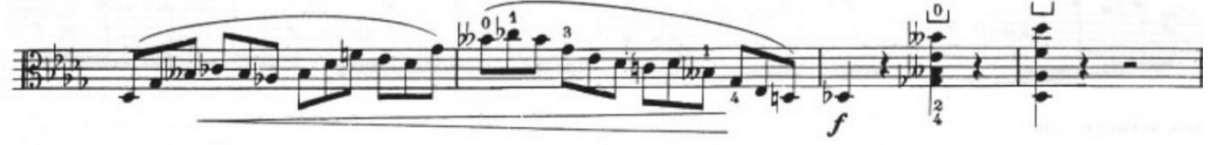
Görsel 32- Maurice Vieux, Vingt Etudes Pour Alto , no.11, 49-52. ölçüler.

Vieux bu iki ölçüde armonik yapı dışında gelen arızaları göstermek ve okuma kolaylığı sağlamak için bu ölçülerde enharmonic 26 ibaresi koymuştur. Etütte sol el tekniği açısından dikkat edilmesi gereken bir diğer unsur da entonasyondur. Vieux ilk kez bu etütte gamların aralığına göre uygun olarak özellikle do ve si çift bemol kullanılmıştır. Aynı zamanda hem tonun beş bemollü olması hem de cümlelerde sürekli değişen arızalar olması sebebi ile entonasyon ve sol el kalıp çalışması açısından zorlayıcı ve yararlı bir çalışmadır.