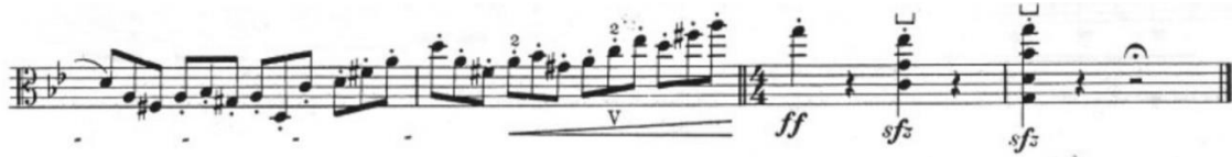
Görsel 20- Maurice Vieux, Vingt Etudes Pour Alto , no.7, 57-60. ölçüler.

Piu lento e espressivo olan ikinci kısım uzun sesler ardından gelen on altılık üçlemelerden oluşur. Bu kısmın yumuşak tonda çalınmasına uygun olarak arşede uzun bağlar kullanılmıştır. Legato arşede açık olarak belirtilen süslemelerin olduğu bu kısım, nüans çeşitliliği açısından zengindir. Genellikle çıkıcı pasajlar crescendo , inici pasajlar diminuendo yazılmıştır.