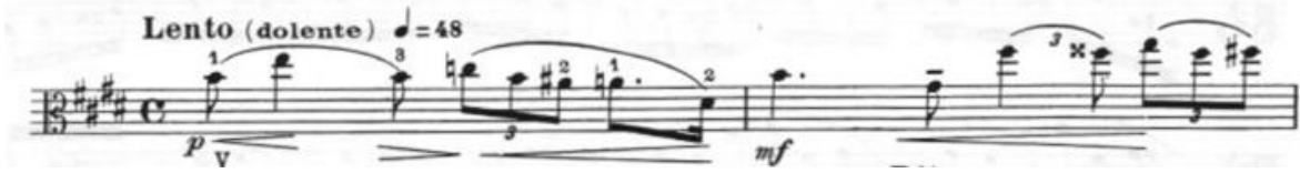
Görsel 52- Maurice Vieux, Vingt Etudes Pour Alto , no.20, 1-2. ölçüler.

dörtlüğe yüz yetmiş altı metronom belirtilmiştir. Bütün olarak bakıldığında etüt; legato , hızlı arşe, aralık, arpej ve ajilite çalışmasıdır.