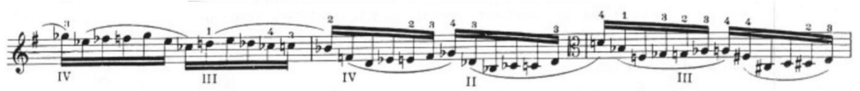
Görsel 12- Maurice Vieux, Vingt Etudes Pour Alto , no.4, 37-39. ölçüler.

Allegretto animato olan B bölümü legato ve spiccato olmak üzere iki arşe tekniğinden oluşur. Legato notalarda kromatik çıkış ve inişler, spiccato notalarda arpej çevrimlerinden oluşan atlamalar vardır. Her ölçüde nüanslar, pozisyon geçişi olan yerlerde ise pozisyonlar belirtilerek duate verilmiştir.