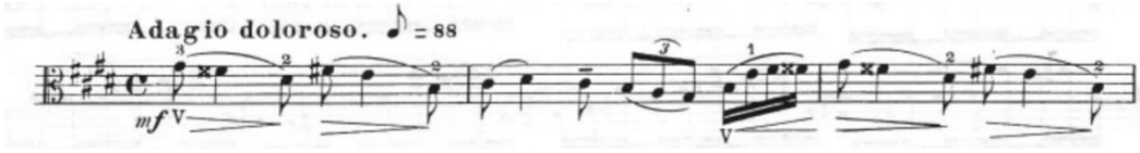
Görsel 35- Maurice Vieux, Vingt Etudes Pour Alto , no.13, 1-3. ölçüler.

Adagio doloroso ve moderato olmak üzere iki bölmeden oluşan etüt; mi majör tonundadır. İlk bölümde ölçü birimi dört dörtlük, sekizliğe seksen sekiz metronom belirtilmiştir. Moderato olan ikinci bölümde ise ölçü birimi altı sekizlik, noktalı dörtlüğe seksen metronom belirtilmiştir. Gösterişli bir girişle başlayan bu etüt; içerisindeki teknik çalışmaların dışında müzikal ve görkemli yapısıyla kitap içerisindeki etütler arasında konserde seslendirilmeye uygun etütlerden biridir.