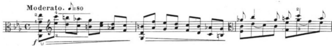
Görsel 21- Maurice Vieux, Vingt Etudes Pour Alto , no.8, 1-3. ölçüler.

Etüt moderato ve vivo e leggiro olmak üzere yedi numaralı etüt gibi iki bölümden ve bu bölümlerin tekrarlarından oluşur. Moderato olan orta hızlı bölümlerde ölçü birimi dört dörtlük, sekizliğe seksen metronom belirtilmiştir. Vivo e leggiro olan hızlı bölümlerde ise altı sekizlik, noktalı dörtlüğe yüz yirmi altı metronom belirtilmiş olan etüt do minör tonundadır.