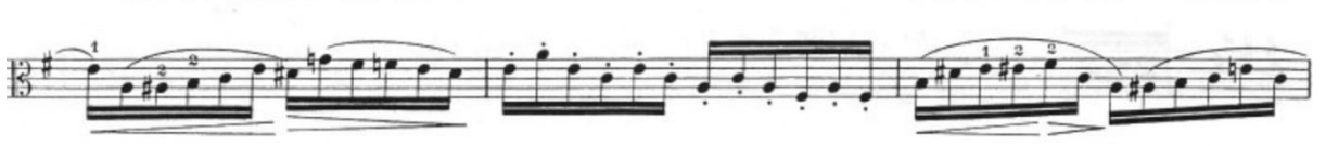
Görsel 11- Maurice Vieux, Vingt Etudes Pour Alto , no.4, 19-21. ölçüler.

Allegretto animato olan B bölümü legato ve spiccato olmak üzere iki arşe tekniğinden oluşur. Legato notalarda kromatik çıkış ve inişler, spiccato notalarda arpej çevrimlerinden oluşan atlamalar vardır. Her ölçüde nüanslar, pozisyon geçişi olan yerlerde ise pozisyonlar belirtilerek duate verilmiştir.