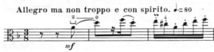
Görsel 15- Maurice Vieux, Vingt Etudes Pour Alto , no.6, 1-3. ölçüler.

Sol el ajilitesinin önemli olduğu bu etüt aynı zamanda bir spiccato çalışmasıdır. Bütüne bakıldığında etüt bu üç ölçülük motif ve çeşitli tekrarlar ile spiccato pasajlardan oluşur. Etüdün ritmik pasajlarında birinci ve üçüncü vuruşta gelen mordanlar ve farklı zamanlarda gelen aksanlar ile zenginleştirilmiştir.