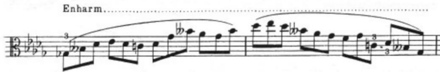
Görsel 31- Maurice Vieux, Vingt Etudes Pour Alto , no.11, 7-8. ölçüler.

Bu verilerin de doğrultusunda nota geçişlerinde tempoda aksamalar olmaması için eşit ve dengeli arşe kullanılmalıdır. Yedinci etütte de bahsedildiği gibi nüans değişimlerinde arşe paylaşımı yapılırken her notaya ne kadar arşe ayrılması gerektiğine dikkat edilmesi icracıya arşe hakimiyeti sağlar. Bu farkındalık nüansların denge içerisinde yapılmasını sağlar.