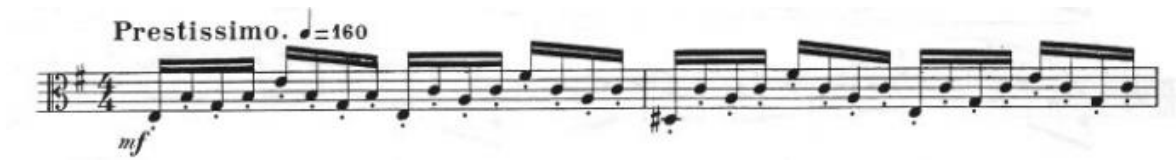
Görsel 4- Maurice Vieux, Vingt Etudes Pour Alto , no.2, 1-2. ölçüler.

Etüdün temposu prestissimo olarak belirtilmiştir ve tek bölmeden oluşur. Mi minör tonunda olan bu etütte ölçü birimi olarak dört dörtlük, dörtlüğe yüz altmış metronom belirtilmiştir. Son iki ölçüdeki bitiriş notaları hariç etüdün tamamı on altılık notalardan oluşmaktadır. Bu etüt kitapta baştan sona on altılıklardan oluşan tek spiccato 17 etüttür.