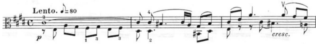
Görsel 7- Maurice Vieux, Vingt Etudes Pour Alto , no.3, 1-3. ölçüler.

Mi majör tonunda olan etüt; lento ve poco mosso olmak üzere iki bölümden oluşur. Etüdün tamamına bakıldığında yavaş ve hızlı bölümlerden oluştuğu görülür. Yavaş bölümde ölçü birimi olarak dört dörtlük, sekizliğe seksen metronom belirtilmiştir. Hızlı bölümde ise sekizliğe doksan altı metronom istenmiştir. Etüdün ilk kesiti olan A bölümü çift sesler ve üç sesli akorlardan oluşur. B bölümü ise on altılık nota grupları kullanılmış hızlı bir bölümdür. Bütüne bakıldığında etüt A ve B temasının iki kez tekrarından ve finalde iki temasın kalıplarının da kullanıldığı C temasından oluşur.