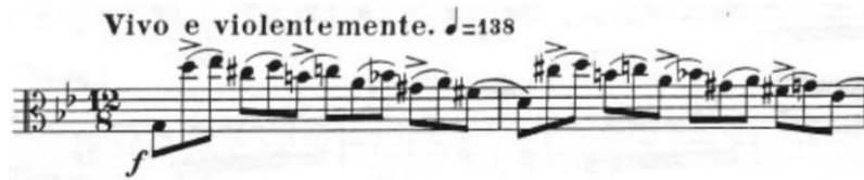
Görsel 18- Maurice Vieux, Vingt Etudes Pour Alto , no.7, 1-2. ölçüler.

Etüt vivo e violentemente 25 ve piu lento e espressivo olmak üzere iki bölümden ve bu bölümlerin tekrarlarından oluşan bu etüt sol minör tonundadır. Hızlı bölümde ölçü birimi on iki sekizlik, dörtlüğe yüz otuz sekiz metronom belirtilmiştir. Yavaş bölümde ise ölçü birimi üç dörtlük, dörtlüğe altmış altı metronom belirtilmiştir.