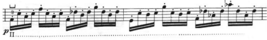
Görsel 5- Maurice Vieux, Vingtt Etudes Pour Alto , no.2, 23-24. ölçüler.

Bazı ölçülerin altında pasajın hangi pozisyonda çalınması gerektiği belirtilmiştir. Etüdün üzerindeki pozisyonlara uyulursa bestecinin o pasajlarda geliştirilmesini istediği teknik kazanım daha kolay anlaşılır. Vieux'un bu etütte kullandığı nüans yelpazesi bir önceki etüde göre daha dardır. Bütüne bakacak olursak crescendo ve decrescendolar cümle geçişlerinde kullanılmıştır. Nüans değişimleri yapılırken inici ve çıkıcı partilerde kontrolsüz nüans oluşumuna dikkat etmek gerekmektedir. Etüt mezzo forte başlamış ve aynı nüansta hiçbir dalgalanma olmadan devam etmiştir. Yirmi yedinci ölçüde Vieux bu düzeni bozarak yedi ölçülük bir crescendo , üç ölçülük decrescendo ve tekrar altı ölçülük bir crescendo ile etüdü renklendirmiştir. Sadece etüdün bu kısmında nüans farkları olduğu için icracının buradaki nüansları belli etmesi daha çarpıcı bir performans sağlayabilir.