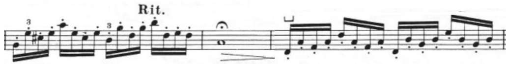
Görsel 6- Maurice Vieux, Vingtt Etudes Pour Alto , no.2, 42-44. ölçüler.

Bazı ölçülerin altında pasajın hangi pozisyonda çalınması gerektiği belirtilmiştir. Etüdün üzerindeki pozisyonlara uyulursa bestecinin o pasajlarda geliştirilmesini istediği teknik kazanım daha kolay anlaşılır. Vieux'un bu etütte kullandığı nüans yelpazesi bir önceki etüde göre daha dardır. Bütüne bakacak olursak crescendo ve decrescendolar cümle geçişlerinde kullanılmıştır. Nüans değişimleri yapılırken inici ve çıkıcı partilerde kontrolsüz nüans oluşumuna dikkat etmek gerekmektedir. Etüt mezzo forte başlamış ve aynı nüansta hiçbir dalgalanma olmadan devam etmiştir. Yirmi yedinci ölçüde Vieux bu düzeni bozarak yedi ölçülük bir crescendo , üç ölçülük decrescendo ve tekrar altı ölçülük bir crescendo ile etüdü renklendirmiştir. Sadece etüdün bu kısmında nüans farkları olduğu için icracının buradaki nüansları belli etmesi daha çarpıcı bir performans sağlayabilir.