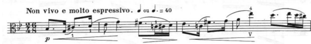
Görsel 46- Maurice Vieux, Vingt Etudes Pour Alto , no.17, 1-4. ölçüler.

Non vivo e molto espressivo olan etüt tek bölmeli ve sol minör tonundadır. Ölçü birimi olarak iki dörtlük, ritim grupları açısından da parantez içerisinde altı sekizlik yazılmıştır. Dörtlüğe ve noktalı dörtlüğe kırk metronom belirtilmiştir. Etütte iki farklı zaman grubu iç içe kullanılmıştır. Bazı ölçüler iki zamanlı, bazı ölçüler ise üç zamanlı kalıpta yazılmıştır.