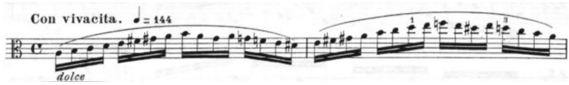
Görsel 39- Maurice Vieux, Vingt Etudes Pour Alto , no.14, 1-2. ölçüler.

Con vivacita 27 olan bu etüt tek bölmeli ve la minör tonundadır. Ölçü birimi olarak dört dörtlük, dörtlüğe yüz kırk dört metronom belirtilmiştir. Bütün olarak bakıldığında etüdün tamamı sekiz ve on altı bağlı on altılık notalardan oluşur.