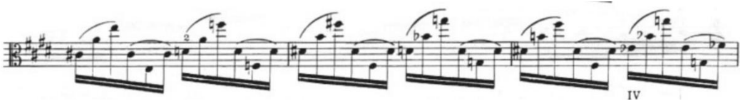
Görsel 38- Maurice Vieux, Vingt Etudes Pour Alto , no.13, 45-47. ölçüler.

Lee Ann J. Morgan daha önceden de bahsedilen makalesinde bu etütte yazım hatası olabileceği düşüncesine değinmiş ve spiccato yazılan pasajların ses efekti olarak arşenin ucunda özellikle istendiğinden bahsetmiştir. Staccato istenen yerlerde ise martele tekniğinin de birlikte kullanılabilceğini belirtmiştir. Tel geçişlerindeki arşe hareketlerini en aza indirmenin, arşenin tele yakın olmasının ve küçük arşe kullanılmasının icracıya rahatlık sağlayacağından bahsetmiştir. Spiccato pasajlar genelde arşenin zıplama noktasında çalındığı için özel olarak bu etütte spiccatonun uçta staccatonun ise alt yarıda istenmesinin ters yazılmış, yazım yanlışlığı yapılmış olabileceğini de dile getirmiştir.