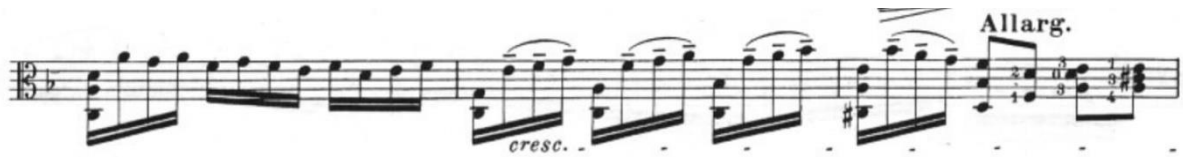
Görsel 13- Maurice Vieux, Vingt Etudes Pour Alto , no.5, 16-18. ölçüler.

Fa majör tonunda olan bu etüdün temposu modéré, ölçü birimi olarak üç dörtlük, dörtlüğe altmış metronom belirtilmiştir. Bütün olarak bakıldığında etüdün ilk sayfasında iki, üç ölçüde bir allargando 20 kullanılmıştır. Gelen ritardando lardan sonra a tempo ya geri dönmüştür. Etüdün melodik yapısında ise çift sesli partiler ve akorlar ile notalar çok sesli olarak ilerlemiştir. Çift ses çalışmaları olan bu etüt aynı zamanda art arda akor çalışma becerisini de geliştiren yararlı bir çalışmadır.