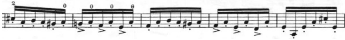
Görsel 16- Maurice Vieux, Vingt Etudes Pour Alto , no.6, 56-58. ölçüler.

Sol el ajilitesinin önemli olduğu bu etüt aynı zamanda bir spiccato çalışmasıdır. Bütüne bakıldığında etüt bu üç ölçülük motif ve çeşitli tekrarlar ile spiccato pasajlardan oluşur. Etüdün ritmik pasajlarında birinci ve üçüncü vuruşta gelen mordanlar ve farklı zamanlarda gelen aksanlar ile zenginleştirilmiştir.