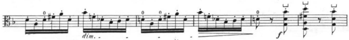
Görsel 17- Maurice Vieux, Vingt Etudes Pour Alto , no.6, 118-123. ölçüler.

Etüdün bazı ölçülerinde özellikle boş tel kullanımı belirtilmiştir. Spiccato karakteri içerisinde bu duate kullanımı tel atlamaları ve balans açısından zorluk oluşturabileceği için bu konuda özenli bir çalışma gerektirir. Spiccato çalışmasının yanı sıra, motifin geldiği son tekrarda on altılık notalar beşli ve altılı aralıklarla yazılmıştır. Aralık ve tel atlama çalışmalarının da olduğu bu etütte ajilitenin yanı sıra sol el ve sağ el beraberliği de önemlidir. Etüt hızlı bir tempoda olduğu ve sürekli değişen modülasyonlar bulunduğu için aynı zamanda sol el açısından da yararlı bir kalıp ve denge çalışmasıdır.