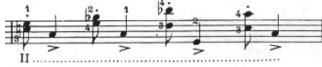
Görsel 29- Maurice Vieux, Vingt Etudes Pour Alto , no.10, 44. ölçü.

Kuvvetli zamanda gelen çift ses akor ve sonrasında zayıf zamanda gelen aksanlı notalar özellikle ikinci telde istenmiştir. Sekizlik çift sesli notaların üzerinde nokta, dörtlük notalarda ise aksan belirtildiği için kontrast farkının ortaya çıkarılması bu tip pasajlar için önemlidir.