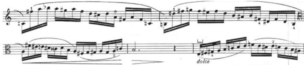
Görsel 41- Maurice Vieux, Vingt Etudes Pour Alto , no.14, 23-27. ölçüler.

Vieux pasajlarda belirttiği parmak numaralarında sol eli kalıp olarak kullanılmak için dördüncü parmak kullanımını belirtmiştir. Hızlı geçişler olduğu için dördüncü parmak kullanımından sonra konumunu bozmadan tel üzerinde hazır bulurulması entonasyon ve ajilite nin bozulmaması açısından icracıya kolaylık sağlar. On numaraları etütte de bahsedildiği gibi yarımınıc pozisyon pek tercih edilen bir pozisyon olmamasına rağmen Vieux ihtiyaç duyulan ve yarımınıc pozisyon kullanılırsa daha rahat çalınabilecek olduğunu düşündüğü pasajlarda bu pozisyonu çalıştırmaktadır.