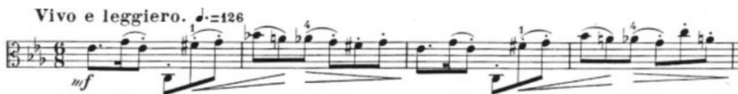
Görsel 22- Maurice Vieux, Vingt Etudes Pour Alto , no.8, 17-20. ölçüler.

Bütün olarak moderato bölüme bakıldığında yavaş bölüm sekizlik akorlar ve devamında gelen çift sesli notalardan ve on altılık notalardan oluşur. Bu bölüm çift ses çalışması olarak sınıflandırılabilir. Çift ses çalışması; sol el tekniği açısından en önemli çalışmalardan biridir. Çift ses sekizlik kullanımının yanı sıra yürüyen sekizlik partinin üzerine yazılmış farklı ritim kalıpları da vardır. Sekizliklerden sonra gelen on altılık bağlı notalarda akıcı bir yazım kullanılmıştır. Aynı zamanda entonasyon ve tuşe hâkimiyeti içinde yararlı bir çalışma olan bu etüt; bir çok çalışmayı içerisinde bulundurulur.