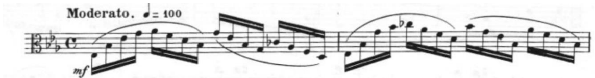
Görsel 50- Maurice Vieux, Vingt Etudes Pour Alto , no.19, 1-2. ölçüler.

Moderato olan etüt; tek bölmeli ve mi bemol majör tonundadır. Ölçü birimi olarak dört dörtlük, dörtlüğe yüz metronom belirtilmiştir.