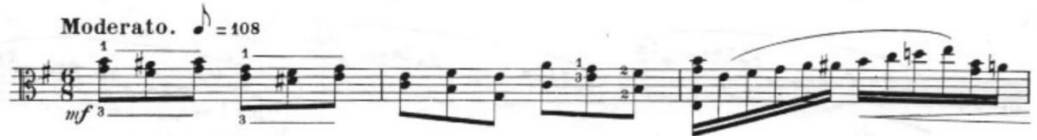
Görsel 33- Maurice Vieux, Vingt Etudes Pour Alto , no.12, 1-3. ölçüler.

Üçleme sekizliklerden ve bağlı on altılık nota gruplarının kullanıldığı etüt baştan sona kadar aynı ritmik kalıplardan oluşur. Bu etütte Vieux iki farklı karakter sunmuştur. Birincisi çift seslerin kullanıldığı üçleme sekizliklerin olduğu kalıptır. Bazı gelişlerde küçük aralıklar bazılarında ise büyük atlamalar kullanılmıştır. İkincisi ise on altılık bağlı notalardan oluşan kalıptır. On altılık nota grupları genelde inici ve çıkıcı gamlardan oluşsa da bazı tekrarlarda kromatik, tel ve pozisyon atlamaları da kullanılarak çeşitlendirilmiştir. Entonasyon ve pozisyon çalışmaları için yararlı olan bu etüt aynı zamanda sol ve sağ el denge çalışması için de yararlıdır.