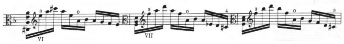
Görsel 14- Maurice Vieux, Vingt Etudes Pour Alto , no.5, 45-47. ölçüler.

sağlayacağını düşünmüştür. Makaleye göre araştırılıp denendiğinde; etütteki çift ses ve akorlarda foutte tekniği, on altılık pasajlarda ise loure tekniği kullanılabilir.