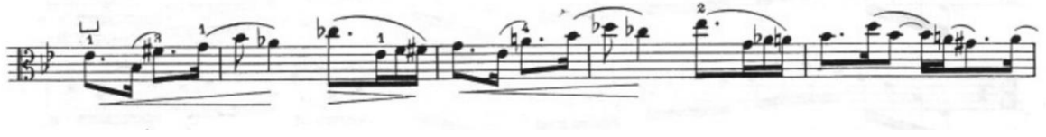
Görsel 47- Maurice Vieux, Vingt Etudes Pour Alto , no.17, 23-26. ölçüler.

yapılmasından ve son olarak da gerekirse çizgi çekerek ritme göre notalarda gruplandırma yapılmasının icracı için yararlı bir çalışma olacağından bahsetmiştir.