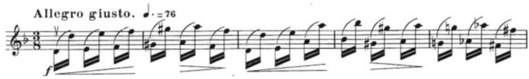
Görsel 42- Maurice Vieux, Vingt Etudes Pour Alto , no.15, 1-5. ölçüler.

Allegro giusto olan bu etüt tek bölmeden oluşur ve re minör tonundadır. Ölçü birimi olarak üç sekizlik, noktalı dörtlüğe yetmiş altı metronom belirtilmiştir. Bu etüt kitap içerisindeki tek oktav çalışması olan etüttür.