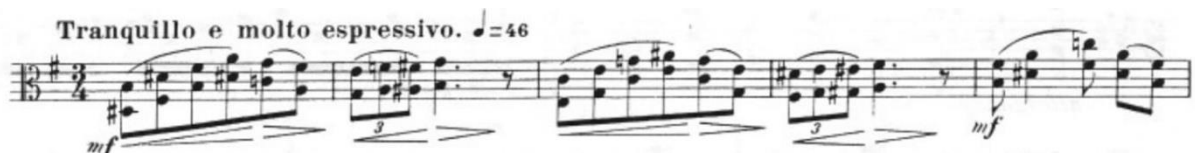
Görsel 10- Maurice Vieux, Vingt Etudes Pour Alto , no.4, 1-5. ölçüler.

Etüt tranquillo e molto espressivo ve allegretto animato olmak üzere iki bölümden oluşur, mi minör tonundadır. Bütüne bakıldığında etüt yavaş ve hızlı bölümlerden oluşur. Yavaş bölümde ölçü birimi olarak üç dördlük, dördlüğe kırk altı metronom belirtilmiştir. Hızlı bölümde ise ölçü birimi altı sekizlik, noktalı dördlüğe altmış dokuz metronom istenmiştir. A bölümü olan yavaş bölüm çift seslerden, B bölümü olan hızlı bölüm ise kromatik pasajlardan oluşur. Ardından tekrar espressivo A teması gelen etüt, A B A formunda yazılmıştır.