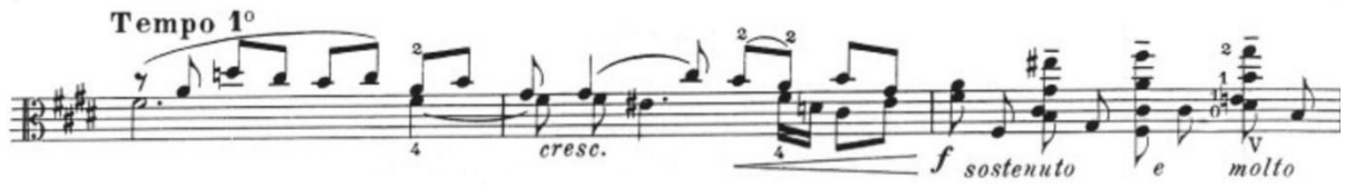
Görsel 9- Maurice Vieux, Vingt Etudes Pour Alto , no.3, 25-27. ölçüler.

Poco mosso başlıklı olan etüdün B bölümü hızlı pasajlar, tel atlamaları ve pozisyon geçişi gibi teknik özellikler içerir. Bu bölümde yedinci pozisyon gibi daha çok üst pozisyonlarda okuma kolaylığı olması için sol anahtar kullanılmıştır. Farklı modülasyonlar içeren gamlardan oluşur. Çıkıcı pasajlarda crescendo , inici pasajlarda ise diminuendo kullanımı etüde farklı renkler katmıştır. Pozisyon ve armoni değişimlerinin bilinçli çalışılması gerektiğini vurgulayan J. Morgan daha önce de bahsedilen aynı makalesinde; kalıp değişikliklerinin farkındalıkla çalışılması gerektiğini belirtmiştir.