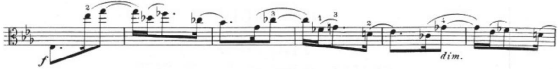
Görsel 49- Maurice Vieux, Vingt Etudes Pour Alto , no.18, 45-50. ölçüler.

Senkop ve aksanlı arşe kullanımı ve yüksek pozisyon atlamaların bulunduğu bu etütte farklı ritim grupları olduğu için sol ve sağ elin koordinasyonu önemlidir. Özellikle etüdün ikinci sayfasında sürekli değişen ritim gruplarında tempoda sekme yaşanmaması için hem eşit arşe, hem de sol ve sağ elin dengeli kullanımı icracıya kolaylık sağlar. Etütte tekrar eden cümleleri ve cümle geçişlerini belli etmek dışında fazla nüans kullanılmamıştır. Hızlı tempoda sürekli değişen ritim kalıpları ve arızalar olması sebebiyle yoğun ve zorlayıcı bir etüttür. Son geçiş köprüsü ad libitum olarak belirtilmiş küçük bir kadans ile tonun eksen sesine çözülür. Etüt yedinci ve dokuzuncu etütte olduğu gibi art arda çekerek yazılmış iki akor ile biter. Bu etüt; hızlı spiccato , pozisyon geçişi, büyük atlamalar, entonasyon ve arşe çalışması olarak yararlı bir çalışmadır.