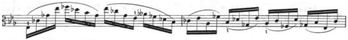
Görsel 51- Maurice Vieux, Vingt Etudes Pour Alto , no.19, 7-8. ölçüler.

Bütüne bakıldığında etüt; geçiş köprüleri ve sonundaki üç akor dışında bağlı on altılık arpejlerden oluşur. Dört ve sekiz bağlı arşe grupları kullanılmıştır. Bu bakımdan arşe ve sol el sürekliliğinin önemli olduğu bir etüttür. Sürekli değişen arşe bağları ve tel ve arşe geçişleri olduğu için bu etüt diğer etütler arasında arşe çalışması etüdü olarak sınıflandırılabilir.