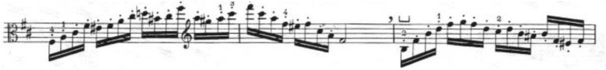
Görsel 45- Maurice Vieux, Vingt Etudes Pour Alto , no.16, 15-17. ölçüler.

Geçiş köprüleri ve bitiriş notaları hariç etüdün tamamı on altılık notalardan oluşmaktadır. Bütününe teknik açıdan bakıldığında etüt spiccato ve iki bağlı arşe gruplarından oluşur. Etüdün genelinde spiccato , büyük tel atlamalarının olduğu ölçülerde ise genellikle zayıf zamanlarda bağ kullanılmıştır. Hızlı bir tempoda yazılmış canlı bir karaktere sahip olduğu için sol el ajilitesi ve sol-sağ el dengesi için yararlı bir çalışmadır. Açık arpejlerden oluşan bu etütte ölçü içerisinde birçok arıza değişimi kullanılmıştır. Aynı zamanda çok sık tel ve pozisyon atlamaları olduğu için tempo sürekliliğini korumak açısından da zorlayıcı bir etüttür.