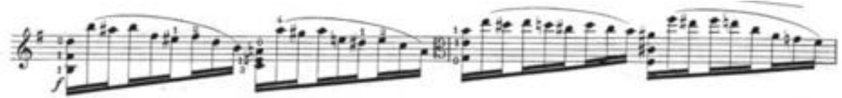
Görsel 34- Maurice Vieux, Vingt Etudes Pour Alto , no.12, 12-13. ölçüler.

Üçleme sekizliklerden ve bağlı on altılık nota gruplarının kullanıldığı etüt baştan sona kadar aynı ritmik kalıplardan oluşur. Bu etütte Vieux iki farklı karakter sunmuştur. Birincisi çift seslerin kullanıldığı üçleme sekizliklerin olduğu kalıptır. Bazı gelişlerde küçük aralıklar bazılarında ise büyük atlamalar kullanılmıştır. İkincisi ise on altılık bağlı notalardan oluşan kalıptır. On altılık nota grupları genelde inici ve çıkıcı gamlardan oluşsa da bazı tekrarlarda kromatik, tel ve pozisyon atlamaları da kullanılarak çeşitlendirilmiştir. Entonasyon ve pozisyon çalışmaları için yararlı olan bu etüt aynı zamanda sol ve sağ el denge çalışması için de yararlıdır.