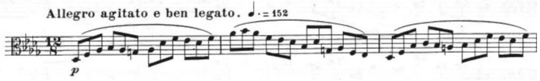
Görsel 30- Maurice Vieux, Vingt Etudes Pour Alto , no.11, 1-3. ölçüler.

Bütün olarak bakıldığında bu etüt on numaralı etüt gibi üçlemelerden oluşur. Fakat Vieux bir önceki etüdün aksine bu etütte legato arşe kullanmıştır. Kontrollü ve hızlı bir tempoda bir arşe içerisinde on iki bağlı nota kullanıldığı için arşe ve sol el sürekliliği önemlidir. Ajilite zorluğu açısından bu tip etütlerde farklı bağ şekilleri ve düşük metronomda çalışmalar yapmak icracıya yardımcı olabilir. Lee Ann J. Morgan'ın daha önce de bahsedilen "Journal of the American Viola Society" deki makalesinde bu etüt için; Ysaye'nin arşe dönüş tekniğinin bu tip arşe bağları olan etütlerde kullanılmasının icracıya kolaylık sağlayacağından bahsetmiştir. Aynı zamanda bu tekniğe göre arşenin eşige paralel kullanılması, bağ bitimindeki ölçü geçişlerinde arşenin durmadan devam etmesi ve arşe kolu sürekliliğinin korunması konusuna da değinmiştir.