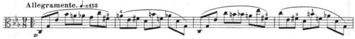
Görsel 2- Maurice Vieux, Vingt Etudes Pour Alto , no.1, 17-20. ölçüler.

Giriş bölümü çift ses aralıklarını ve çift ses kalıplarını zamanında değiştirmeyi, sol ve sağ eli birlikte kullanma ve denge kurma kazanımı sağlar. Bölümün son iki ölçüsü, dokuz sekizlik olan hızlı bölüme geçmek için köprü niteliğindedir.