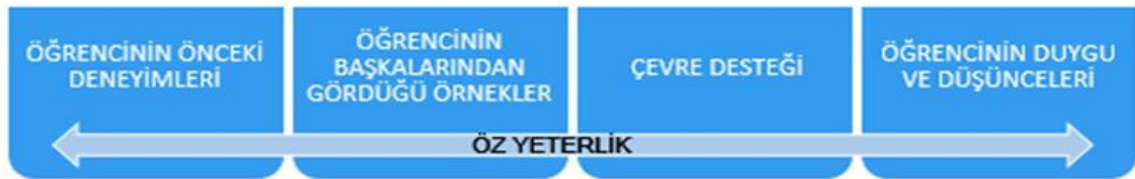
Öğrenci Öz Yeterliğinin Kaynaklarına İlişkin Diyagram

Şekil 1'de Bandura (1977) öğrenci öz yeterliğinin dört kaynağının birbiriyle etkileşim içinde olduğu görülmektedir. Öğrenci, bu dört öz yeterlik kaynağının etkileşimi yoluyla önemli bir kendine inanç veya inançsızlık geliştirmektedir. Öğrencinin geçmiş yaşantıları öz yeterliliğin birincil kaynağını oluşturmaktadır. Bir öğrencinin başarıları, kendileri hakkında düşünme biçimini doğrudan etkilemektedir, derste başarılı olmak özgüvenlerini arttırmakta ve benzer durumlarda tekrar başarı olasılığını da arttırmaktadır. Böylece öğrencinin kendi içinde her zaman önemli başarılar elde edebileceği hissini uyandırmaktadır. Başarısızlık tam tersini yapmaktadır, güvenini kırmakta ve kendinden şüphe duymaya yol açmaktadır. Kendini geliştirme yoluyla etkinlik yaratmak, başarı ile ilgili beklentileri yönetmek ve başarısızlığı olumlu bir şekilde kabul etmek esneklik gerektirmektedir. Geçmiş başarıları deneyimleyen öğrenciler, öz yeterlik konusunda güçlü bir inanca sahip olmaktadır. Öğrencinin başkalarından görerek yaşadığı deneyimler öz yeterliğin ikinci kaynağını