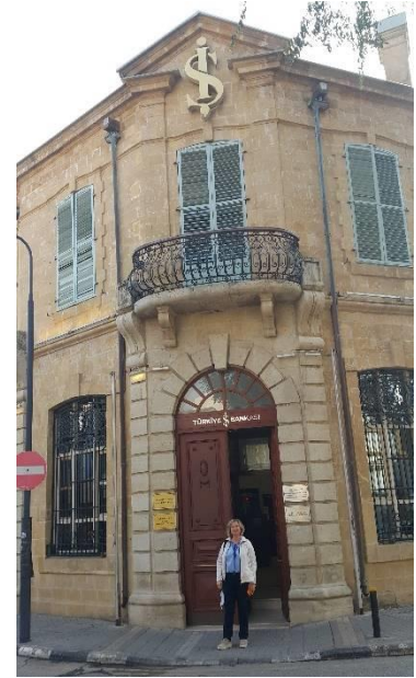
Lefkoşa İş Bankasının bugünkü görünümü