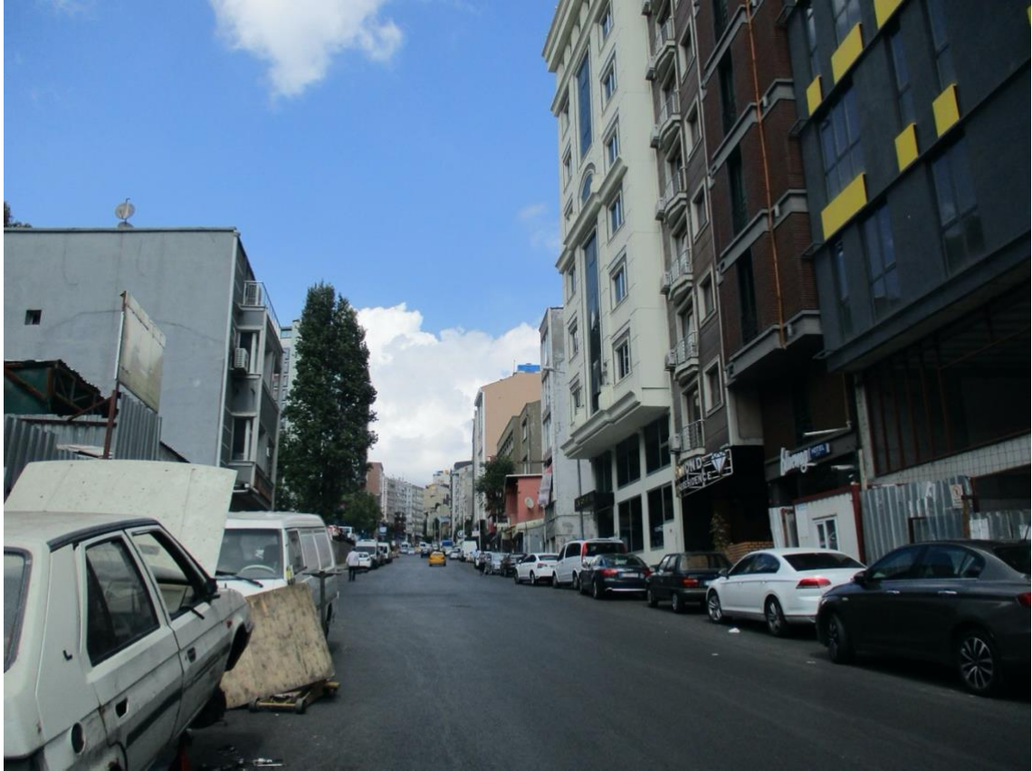
Görsel 5. (Irmak Caddesi Otel İnşaatları)

Bu çerçevede planlanan mekanlar sayesinde semtin daha çok kullanılması ve yeni ziyaretçilerin gelip gitmesi bu ivme ile artan bir canlılığı getirmiştir. Ağırlıklı olarak yerli ziyaretçilerin, sanatçıların ve turistlerin uğrak noktası olan Dolapdere: Şişli ve Beyoğlu'na yürüme mesafesinde önemli bir ulaşım kolaylığına sahiptir. Bu bağlamda Dolapdere'yi düşünürken geçiş bölgesi semtlerin Dolapdere'ye etkisi kaçınılmazdır. Soylulaştırma bir zamana yayılır ve işleyiş kazanması bir süreçtir.