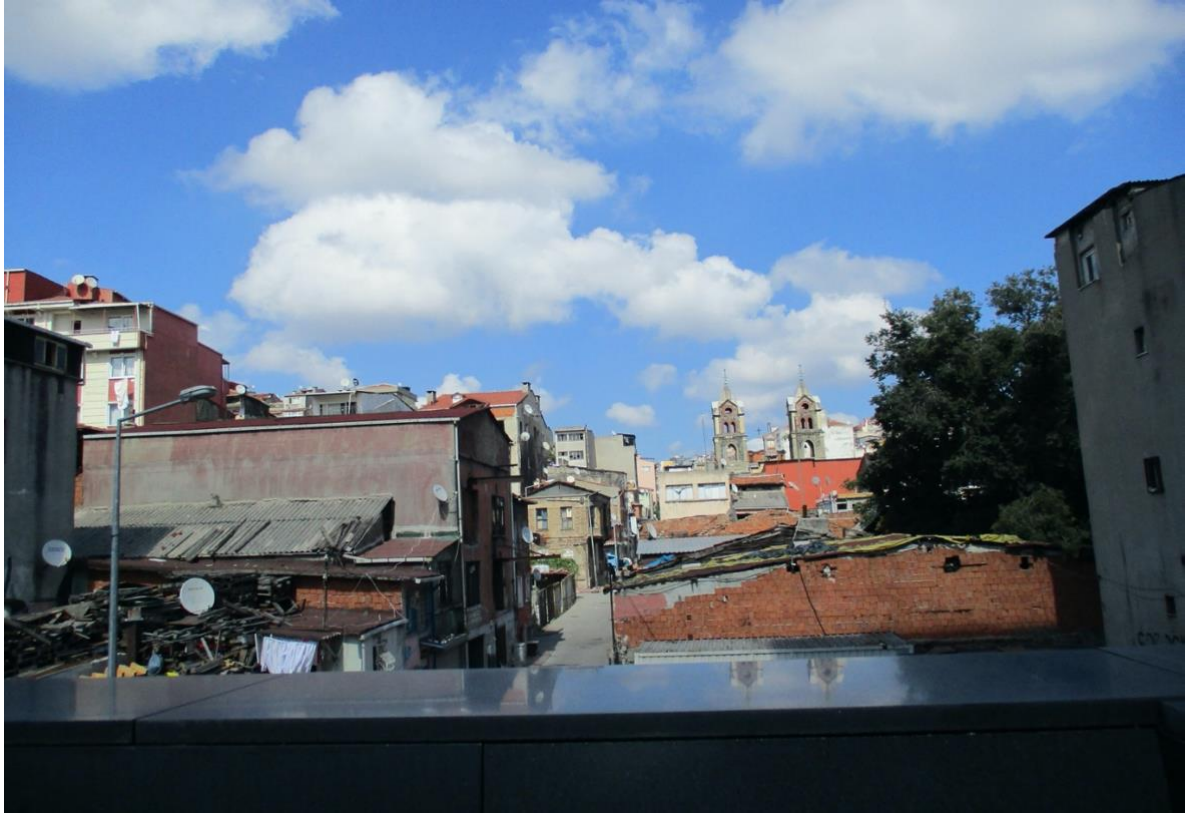
Görsel 7. (Arter İç Balkon/Dolapdere Mahallesi Görünümü)

“Özgül bir mekân inşa etmek, ortak dünyanın paylaşımının emsalsiz bir biçimini kurmak. Yüce estetiği, sanat bir mutlak öteki 'ye karşı ezeli bir borç altına sokar. Ama bu arada ona tarihsel bir misyon atfeder: “Avangard” olarak adlandırılan özneye emanet edilmiş bu tarihsel misyon, ticarî ürünlerin eşdeğerlilik dünyasından mutlak surette aynı, duyulur kayıtlardan oluşmuş bir doku meydana getirmektir, ilişkisel estetik hem sanatın kendine-yeterlik iddiasını hem de hayatı sanat yoluyla dönüştürme hayalini reddeder, ama hayatî önemde bir fikri de yeniden olumlar: Sanat, ortak olanın yerini yurdunu maddî ve simgesel olarak yeniden şekillendirmek için mekânlar ve ilişkiler kurmaktır.” (Ranciere, 2012, s. 26)