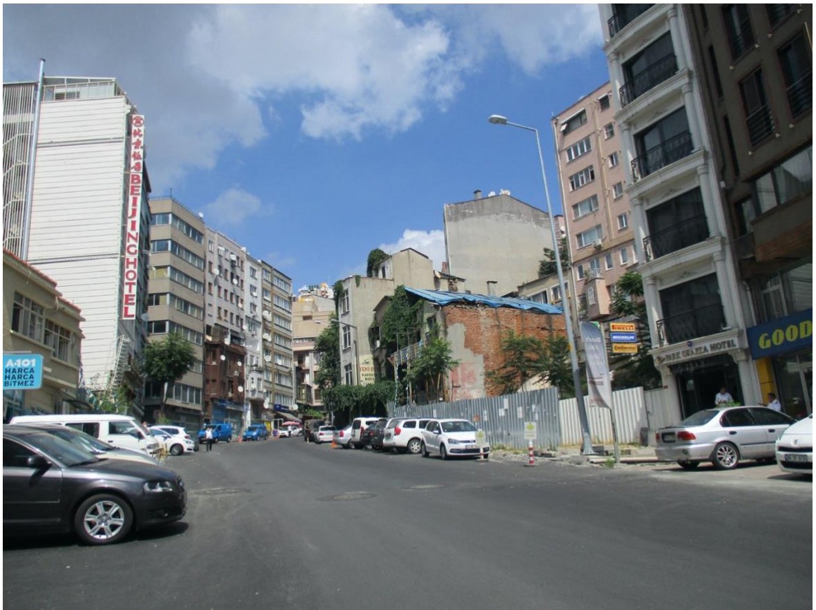
Görsel 4. (Dolapdere Irmak Caddesi)

2015 yılında Acıbadem Taksim hastanesinin açılmasıyla Dolapdere Irmak caddesi üzerinden hastaneye ulaşım yürüyerek on dakika ile sağlanıyor. Ulaşım ağı açısından değerlendirdiğimizde Osmanbey metro durağı, Halaskargazi Mahallesi üzerinden Şişli'ye ve Irmak Caddesi üzerinden yakınlığı yine on iki dakika ile mesafelendiriliyor. Sonuç olarak Dolapdere hem Taksim hattına hem de Şişli hattına çok yakın olan bir geçiş bölgesi özelliklerini barındırıyor.