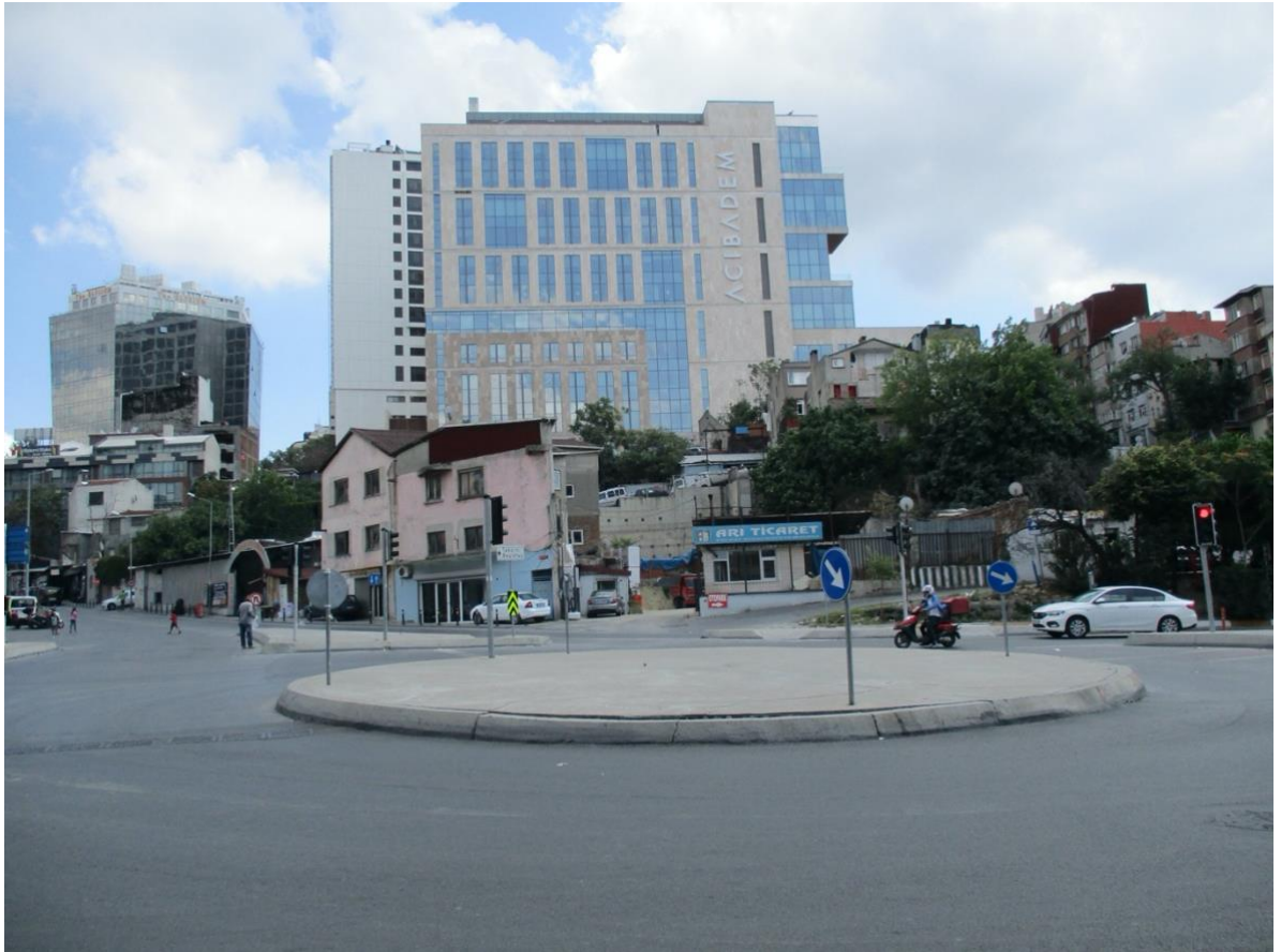
Görsel 3. (Dolapdere meydan- Acıbadem Hastanesi)

Tarlabaşı'nın tarihi konutları ve sokakları dönüşüm projesi ile temizlenerek üst sınıflara açıldı. Neo-liberal politikalar ile İstanbul küreselleşme bağlamında dünya için önemli yatırım ve turizm merkezi olma yolunda ilerledi, Tarlabaşı gibi bir tarihi mahallenin turistler ve yatırımcılar için bir alana dönüştü. (Yıldırım & Erdem, 2016, s. 104)