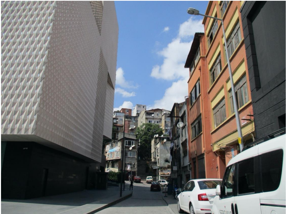
Görsel 1. (Dolapdere Arter/Ayrım)

55 yıldır Dolapdere'de yaşayan ve esnaflık yapan bir mahalleli, daha önceki başlıklarda geçen komşuluk üyeliğini şöyle tanımlıyor;