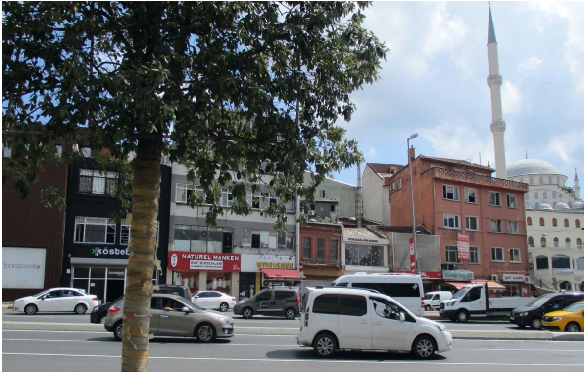
Görsel 6. (Dolapdere Irmak Caddesi Arter Önü, Karşı kaldırımca Evliyagil Dolapdere Görünüyor)