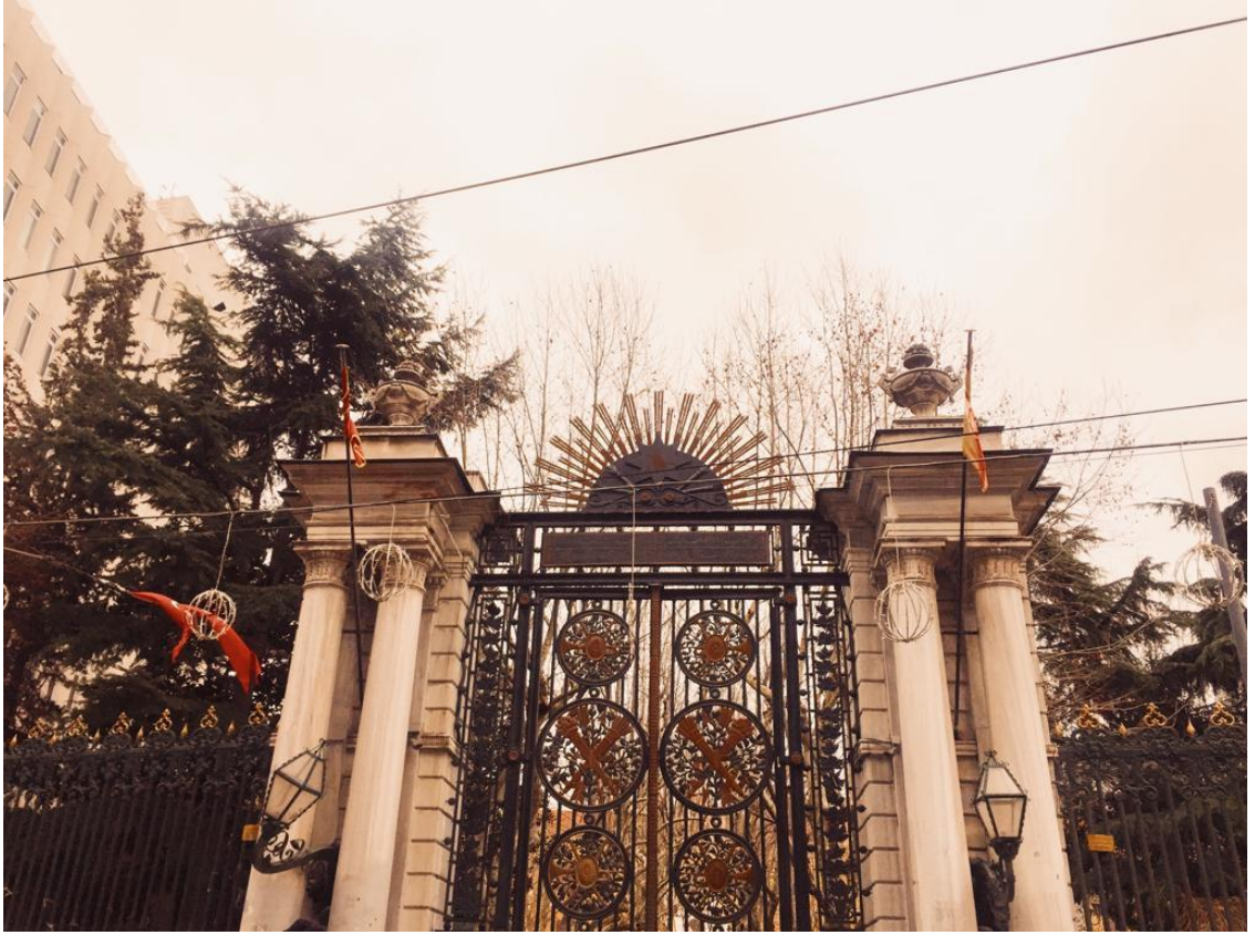
Ek 11. Mekteb-i Sultanî (Günümüzde Galatasaray Lisesi)