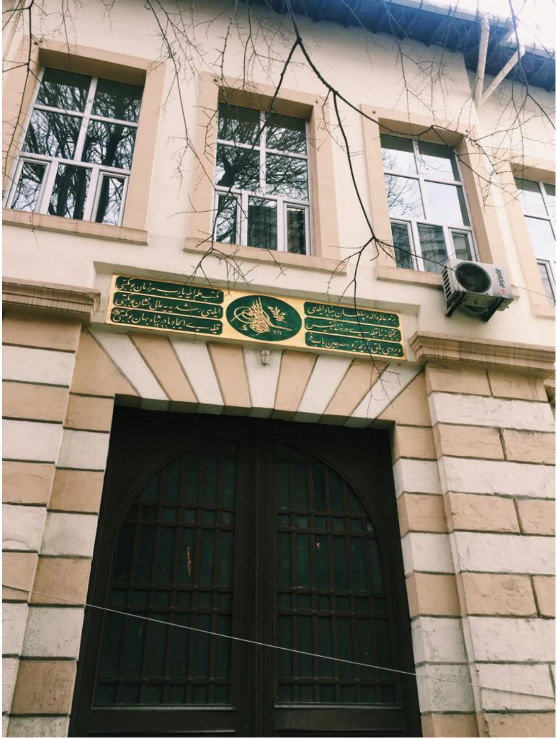
Ek 12. Bezmîâlem İnâs Sultanîsi (Günümüzde Çağaloğlu Anadolu Lisesi)