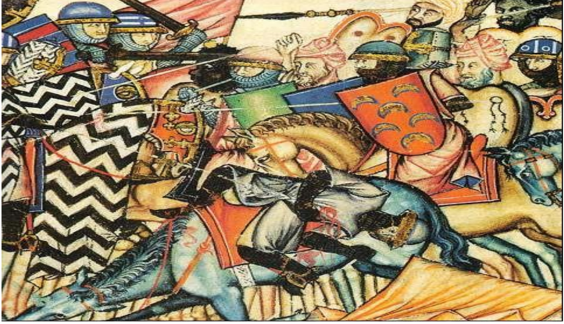
Reconquista sürecinde Müslüman-Hıristiyan mücadelesini anlatan bir illüstrasyon (XIII. yüzyıl): https://www.worldhistory.org/image/9300/reconquista-battle-scene/