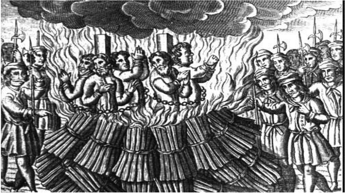
Kathar Kusursuzlarının yakılışına dair: https://www.newworldencyclopedia.org/entry/File:People_burned_as_heretics.jpg