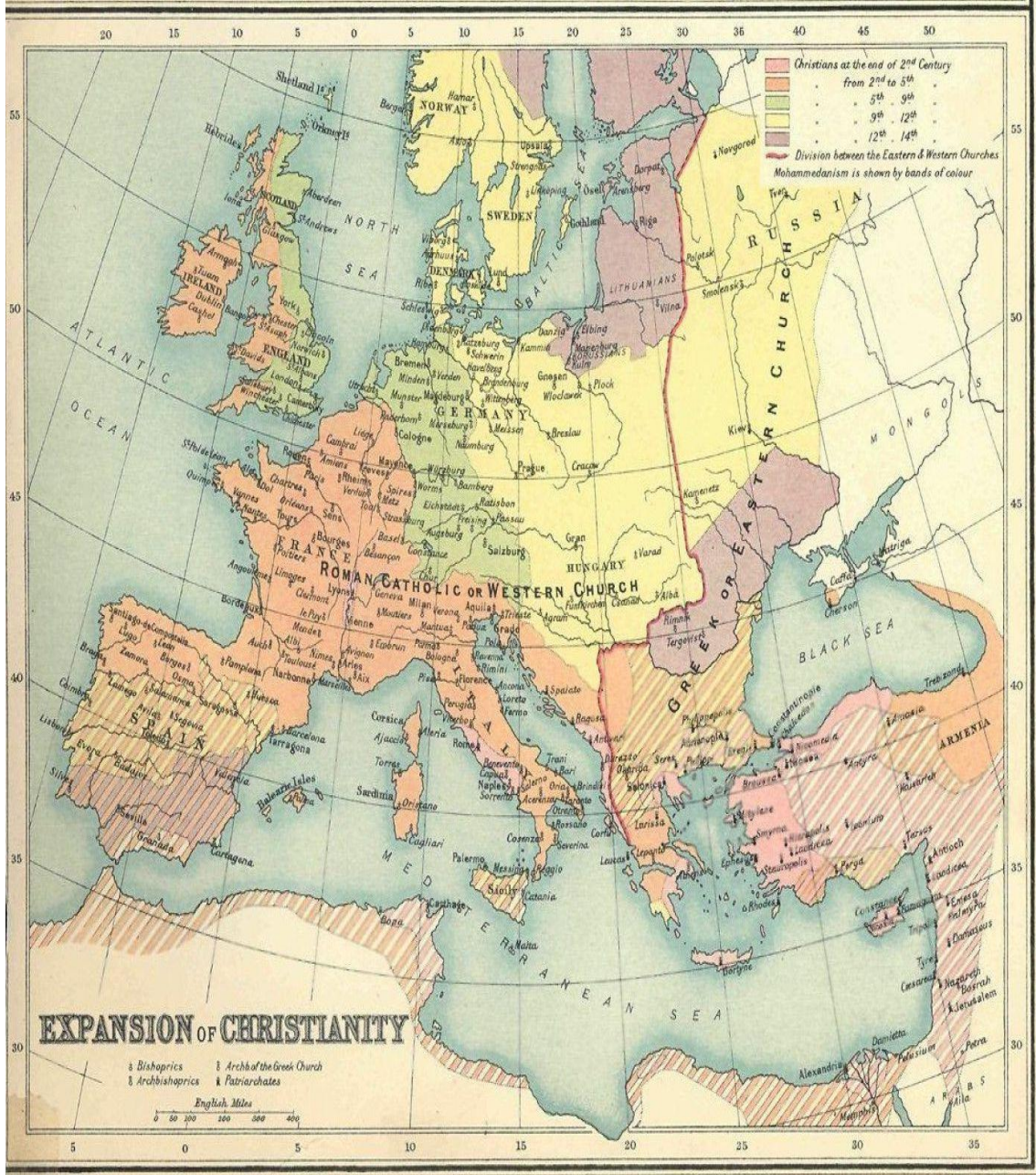
Hıristiyanlığın II. Yüzyıldan XIV. yüzyıla kadar olan yayılması. Ortadaki kırmızı çizgi Doğu ve Batı kiliselerinin nüfuz alanlarını temsil etmektedir: https://www.nationalgeographic.org/thisday/jul16/great-schism/