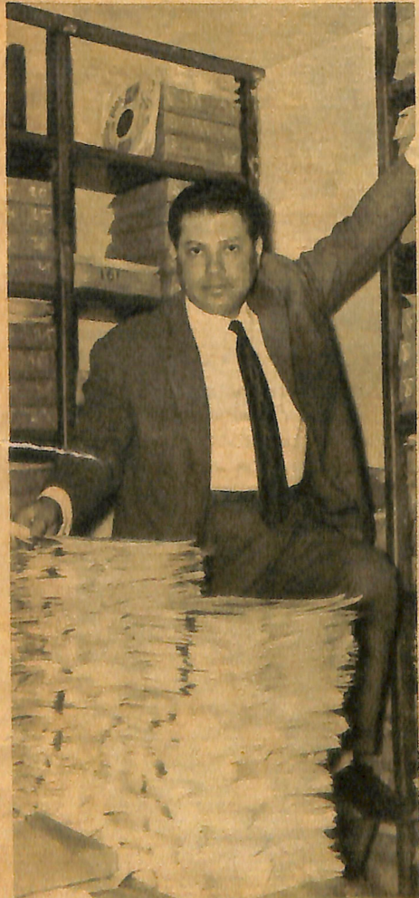
İŞ ADAMI — Şençalar iyi bir iş adamıdır da. Sanatkar, yazhanesinde görülüyor.

Dağ-ı hüsnün ey gül-i nazlı teni Ül fet ister gönlüm amma çare ne Gül cemalin gördüğüm günden beri Nîm nigâhım sıynede vardır yeri.