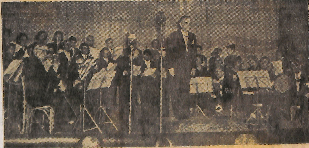
Tek sesli Türk müziğinin ünlü simalarından Münir Nureddin Selçuk; İstanbul Belediye Konservatuvarının Şan sineması salonunda düzenlediği Klâsik Türk Müziği Konserlerinin birinde solist olarak bir eseri okuduktan sonra dinleyicileri selâmlıyor