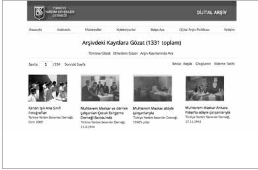
Şekil 4. Dijital arşivde materyaller bölümü arayüzü

Bu bölümlerin dışında koleksiyon yönetim sistemi üzerinden dijital arşivin koleksiyon yapısı görüntülenebilmekte, Türkiye Yardım Sevenler Derneği'nin iletişim kanalları hakkında bilgi sahibi olunabilmektedir.