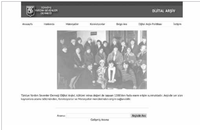
Şekil 1. Türkiye Yardım Sevenler Derneği Dijital Arşivi Ana Sayfası

Dijital Arşiv Projesi'ne yönelik politika oluşturma süreçlerinin ardından çevrimiçi hizmet verebilecek özellikte bir koleksiyon yönetim sisteminin kurulabileceği donanım ve gerekli sunucu yazılımlarının kurulmasına yönelik çalışmalar gerçekleştirilmiştir. Bu çalışmalarla dijital arşivin internet üzerinden erişilmesini sağlayacak adres ve depolama alanları tesis edilmiştir. Bu altyapı üzerine kültürel miras ürünlerinin yönetimini sağlayacak, uluslararası standartlarla uyumluluk gösteren ve açık kaynak kodlu bir koleksiyon yönetim sistemi olan OMEKA [OMEKA yazılımı ile ilgili ayrıntılı bilgi için bkz. https://omeka.org/ ] yazılımı kurulmuştur. Bu yazılım Türkiye Yardım Sevenler Derneği resmi web sitesi yapısına benzer bir şekilde ve kurumsal tercihleri dikkate alınarak özelleştirilmiştir. Bu özelleştirmelerde kullanıcılara öncelikle bir arama kutusu ile arşiv içeriğine erişim sağlamaları hedeflenmiştir. Bu çalışmalarla hazırlanan dijital arşivin ana sayfası aşağıda verilmiştir.