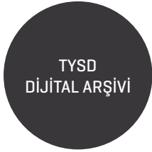
Şekil 5. Dijital arşiv konu dağılımı

Materyallerin konularına göre bölümlenmesiyle birlikte her bir kaynak içeriklerine göre incelenerek tanımlanmış ve koleksiyon yönetim sistemi üzerinden kullanıma sunulmuştur. Arşivde ayrıca Açık Erişim Girişimi Üstveri Harmanlama Protokolü [OAI-PMH] ile ilgili eklentiler de kurularak üstveri harmanlama araçlarının veri transferi yapabilmesi olanaklı hale getirilmiştir. Sistem ayrıca kayıt bazında üstverileri farklı formatlarda ve indirilebilir bir yapıda sunarak açık veri de sağlayabilmektedir. Bu da arşivin işlenebilir formatta veri sunmasına imkân tanımaktadır. Karşılıklı işlerlik protokollerini destekleyen bir yapının kurulmasıyla birlikte, Türkiye Yardım Sevenler Derneği Dijital Arşivi, OpenROAR kısaltmasıyla bilinen açık erişim arşivleri platformuna da kaydettirilmiştir. Bu kayıt ile Türkiye’den bu platformda bulunan 64 arşivden biri de Türkiye Yardım Sevenler Derneği Dijital Arşivi olmuştur. Arşivin bu platformdaki kayıt görüntüsü Şekil 6’dadır.