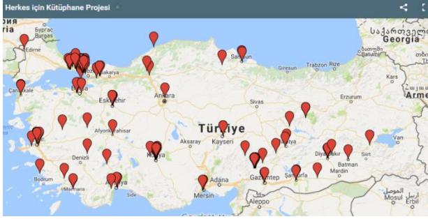
Şekil 1. Herkes için Kütüphane Projesi üyeleri [7]

materyalleri, personele verilecek eğitimler Proje ofisi tarafından ücretsiz olarak karşılanmaktadır. Proje sonunda yerel yönetimlere bağlı kütüphanelerin geleneksel kütüphane hizmetlerinin yanı sıra bölgede yaşayan vatandaşların, özellikle de dezavantajlı grupların yaşam boyu öğrenme çabalarına destek veren hizmetleri de sunan birer cazibe merkezi haline gelmeleri Proje'nin temel hedefidir [6]. Proje'ye 15 Ekim 2016 tarihi itibarıyla 169 kütüphane üyedir ve üye kütüphanelerle ilgili detaylı bilgiler http://www.herkesicin Kutuphane.org/uye-kutuphaneler/ adresinden elde edilebilir.