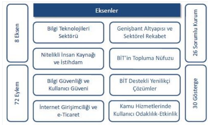
(Şekil 3): Eksenler

Öncelikle eksen adlarından yola çıkılarak, BTSEP Strateji belgesindeki bu eksenlerde kütüphanelere çeşitli sorumluluklar yüklenmiş olabileceği düşünülmüştür. Şekil 2'de belirtilen sekiz ana eksenden 5'inin (Nitelikli İnsan Kaynağı ve İstihdam, Bilgi ve İletişim Teknolojilerinin Topluma Nüfuzu, Bilgi Güvenliği ve Kullanıcı Güveni, Bilgi ve İletişim Teknolojileri Destekli Yenilikçi Çözümler, Kamu Hizmetlerinde Kullanıcı Odaklılık ve Etkinlik) kütüphanelerin varoluş felsefesi ve hizmet ilkeleri ile doğrudan ilişkili alanlar olabileceğine dair bir ön değerlendirme yapılmıştır. Daha sonra BTSEP içeriğinde kütüphane teriminin geçiş sıklıkları incelenmiştir.